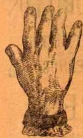
Antes de usar la Pomada Adrover