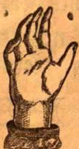
Después de usar la Pomada Adrover