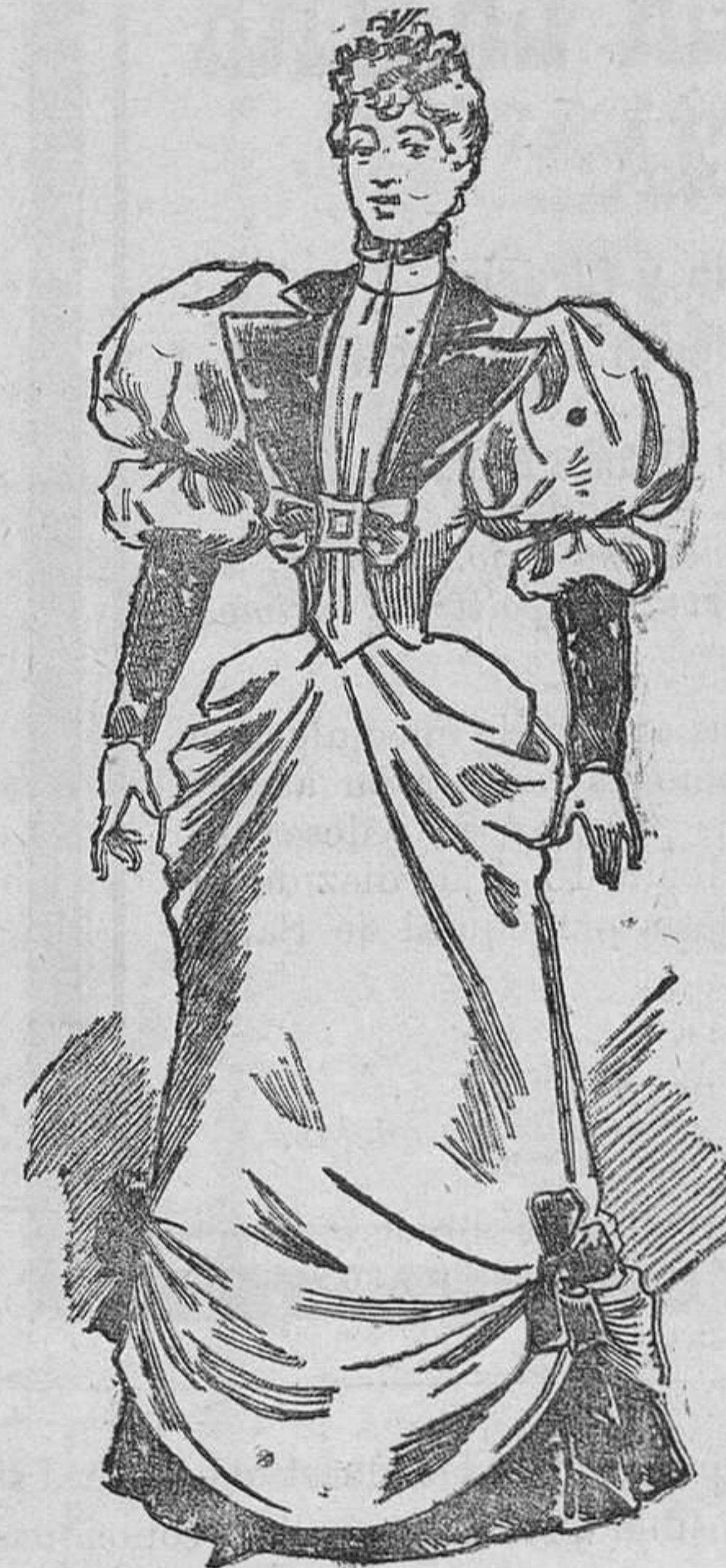
Vestido para recepción

Este elegantísimo traje de primavera se hace de seda bordada y se guarnece con terciopelos y azabaches. El cuerpo, que constituye un caprichoso figaro sin costuras en la espalda, se abre en ancha y triangular solapa sobre un chaleco ligeramente fruncido en la parte que ajusta al talle y liso en lo que forma el cuello. Este figaro se sujeta por un broche-lazo que parte bajo el pecho del nacimiento de las solapas y hace juego con el adorno de las mangas.