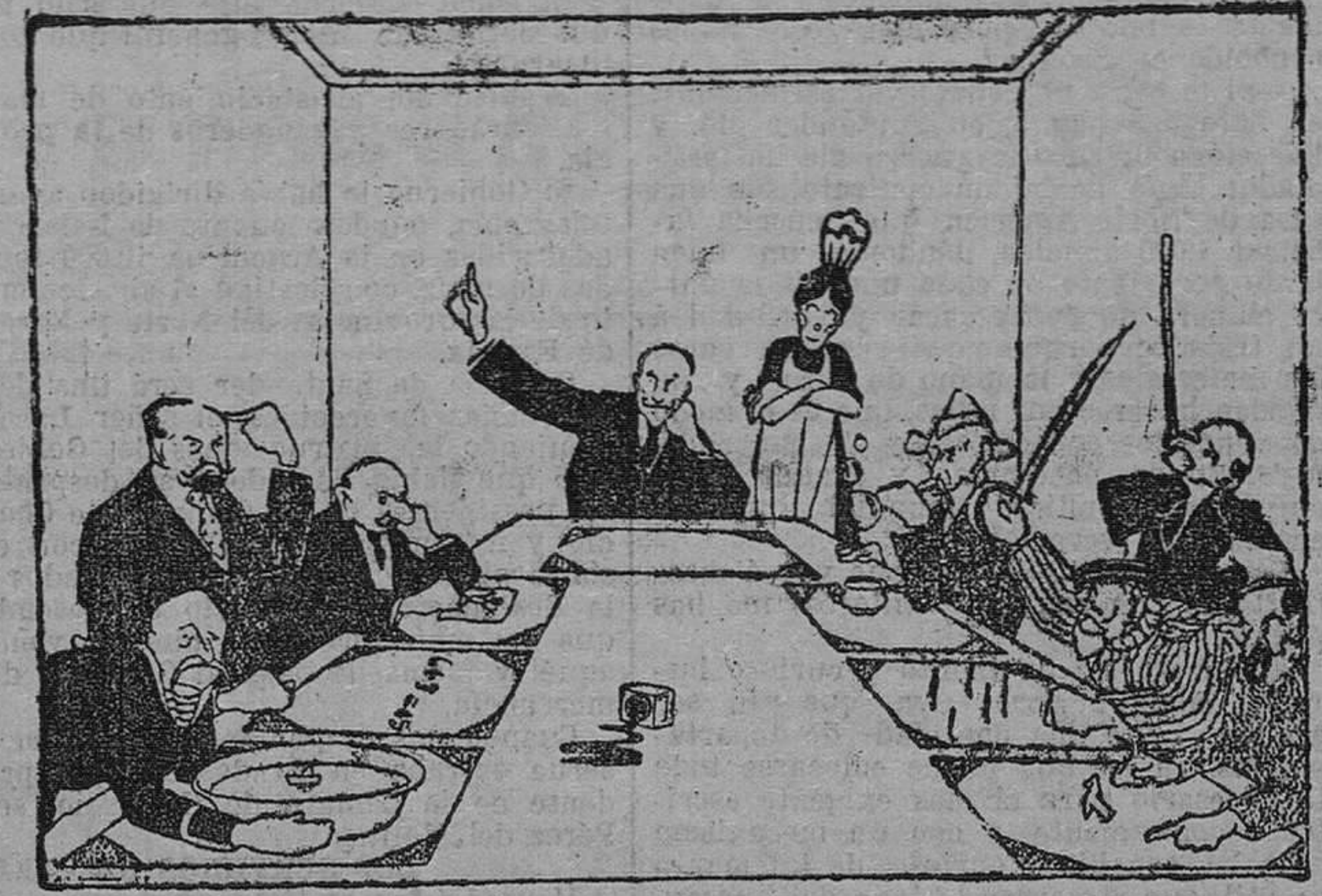
"El Gobierno labora tenazmente..."

ciendo la dulce y suave característica de que saben sostener su mirada, sin perder la pureza del alma.