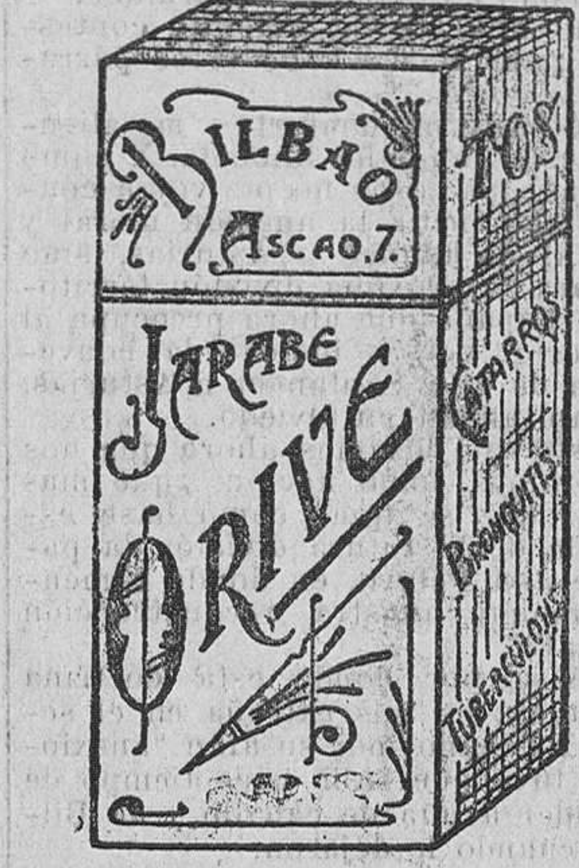
EL MEJOR remedio para EL PEOR catarro Jarabe Orive.

Procedentes de una quiebra saldo infinidad de juguetes. Muñecas desde 0,10 céntimos. Horas de venta de 10 a 1 y de 5 a 7. EL ARCA DE NOE.—Velasco, núm. 17