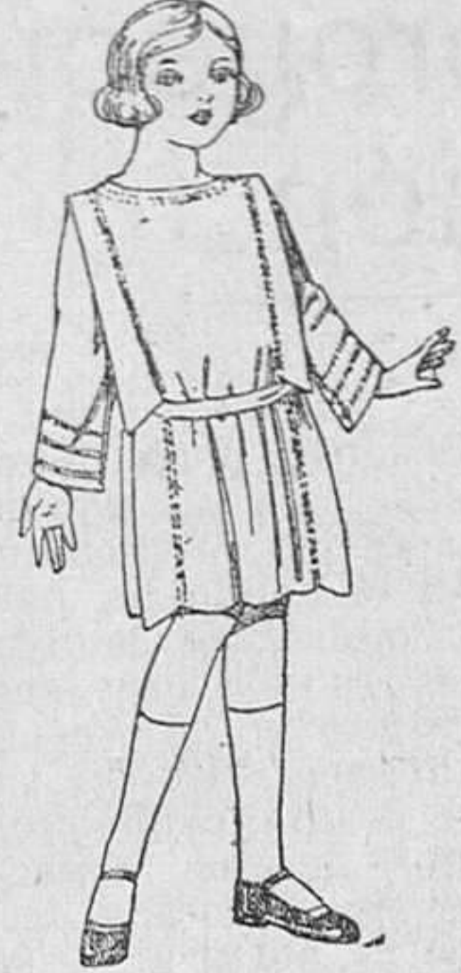
Vestidos de sarga inglesa popeline, etc., en azul y color adornos pespunte sedas para niñas de 4 a 9 años. De ptas. 35 a 42