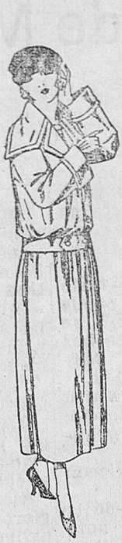
Guardapolvos de dril crudo gris, etc. De ptas. 25 a 41