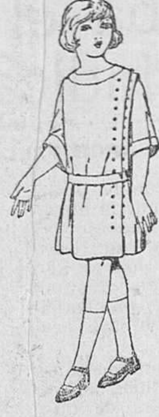
Vestidos crepé de lana, estambre, etc. en azul y color, para niñas de 4 a 9 años. De ptas. 30 a 40