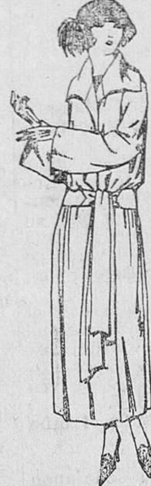
Abrigos de cheviot, gabardina, ratina, etcétera, en negro, azul y color. De ptas. 50 a 75