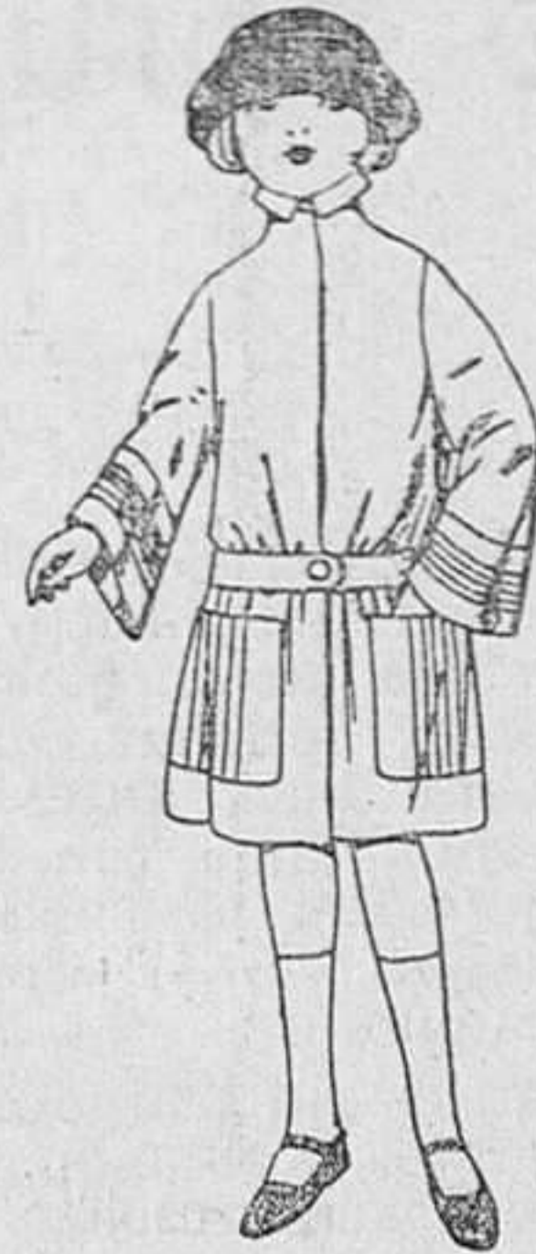
Abrigos de gamuza cheviot, etc., en azul y color, para niñas de 4 a 9 años. De ptas. 33 a 40