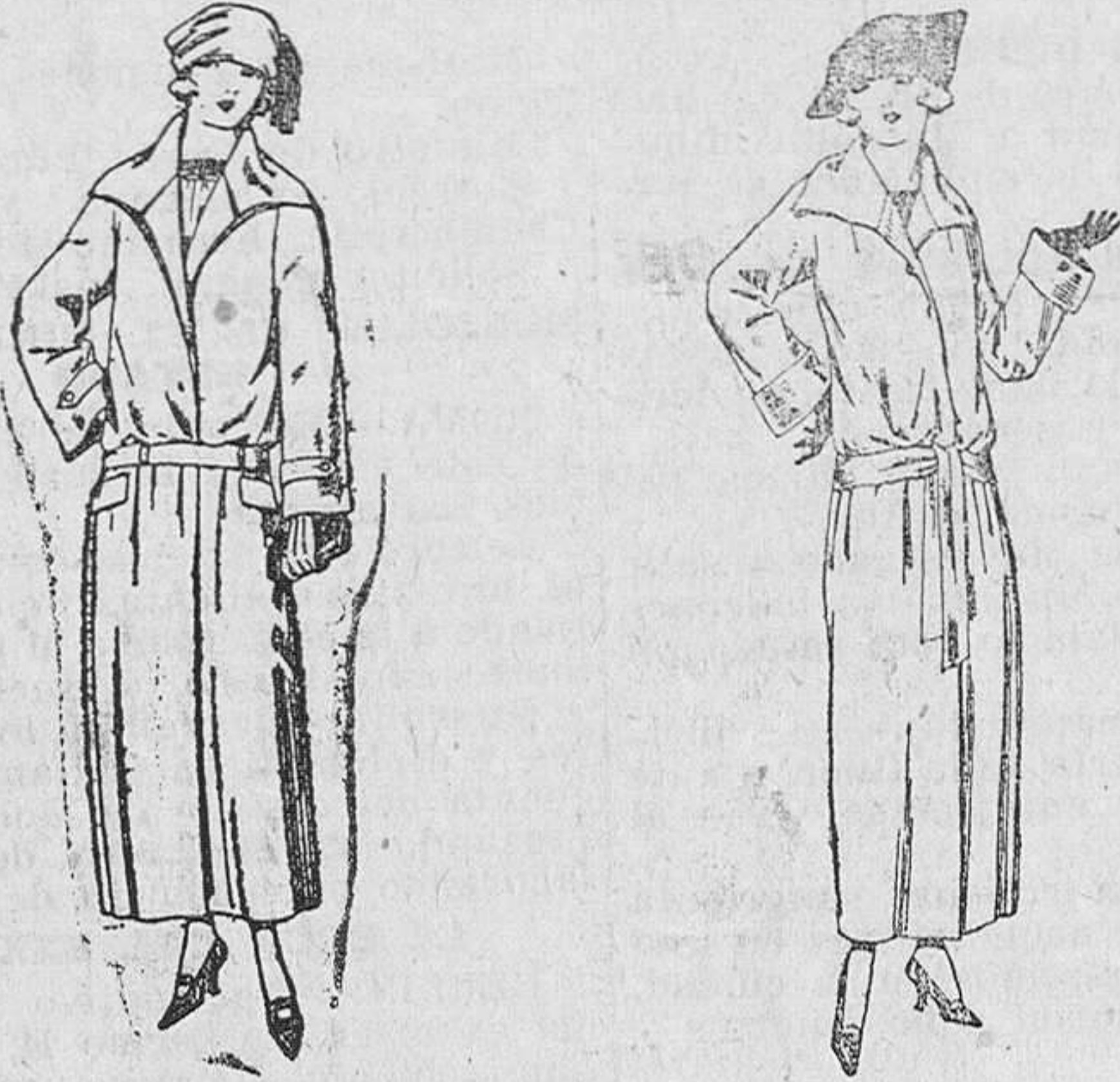
Abrigos de gabardina inglesa, impermeabilizada, en negro, azul y color. De ptas. 70 a 165