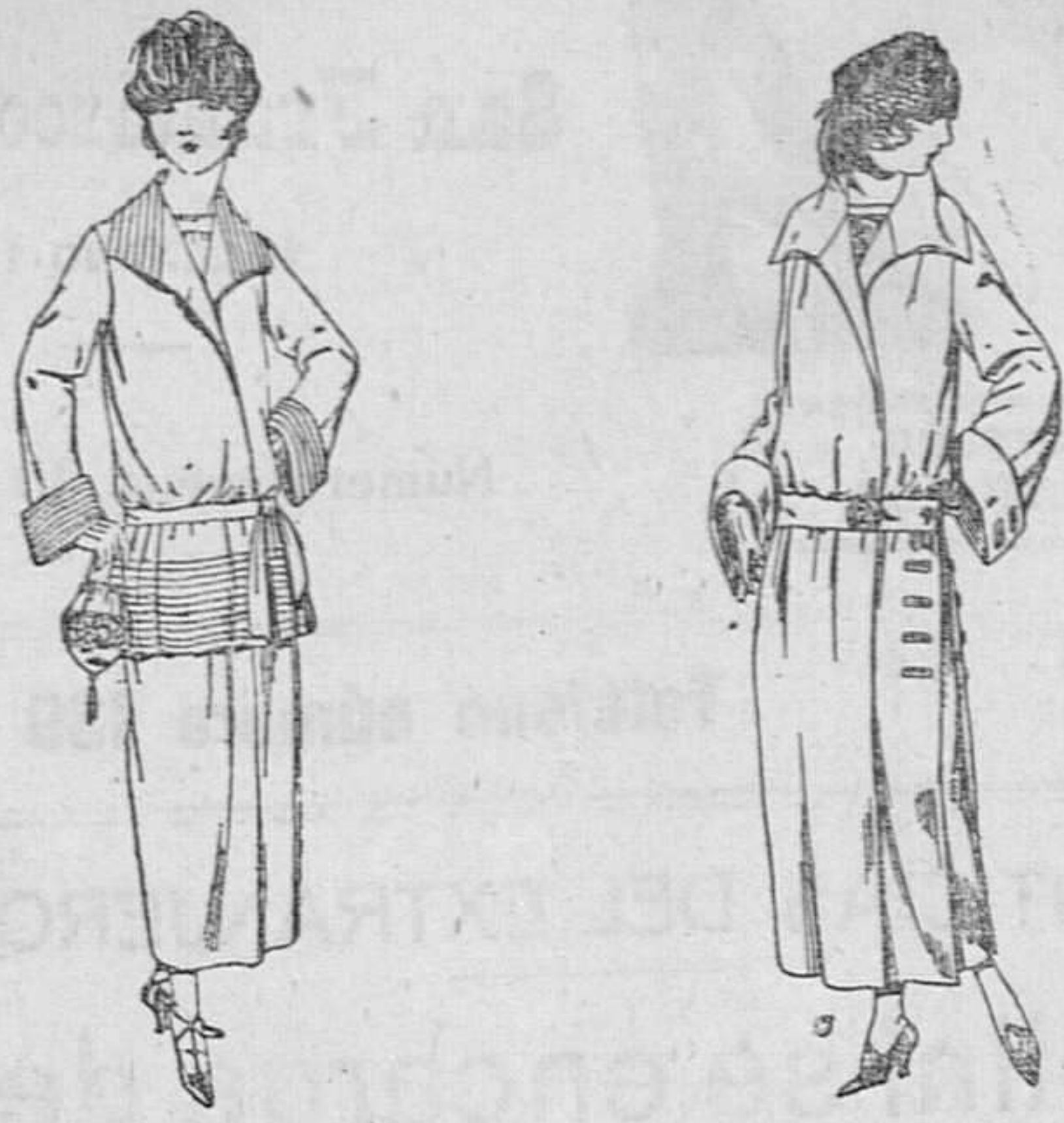
Trajes sastre, de sarga inglesa, Abrigo de gamuza gabardina, etc. cheviot, etc., adorno pliegues, chaqueta forrada de seda, en negro, azul y color. De ptas. 130 a 165

SUCURSALES: Madrid, Barcelona, Alicante, Almería, Bilbao, Cádiz, Cartagena, Gijón, Granada, Málaga, Palma de Mallorca, Sevilla, Valencia, Valladolid, Zaragoza