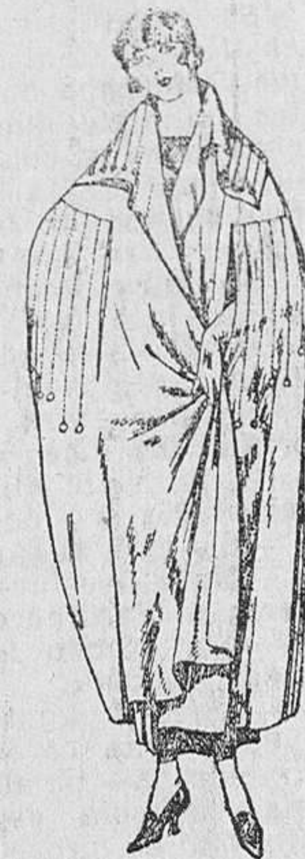
Capas de gabardina, p. fiote etcétera, de diferentes colores. De ptas. 85 a 125