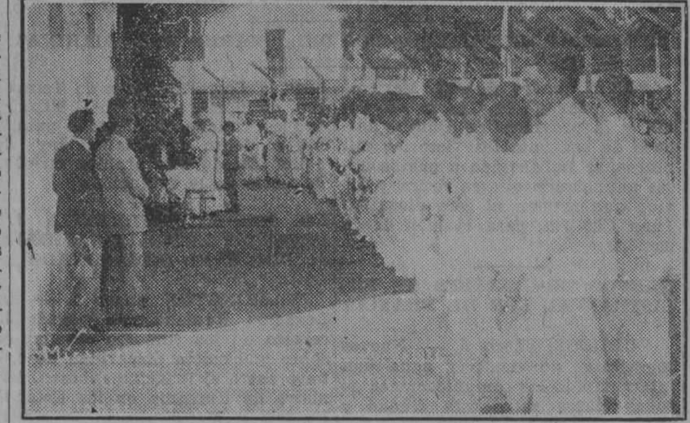
Misa celebrada el día 10, de Enero de 1926 en el Campamento del Nuevo Presidio Nacional de Isla de Pinos