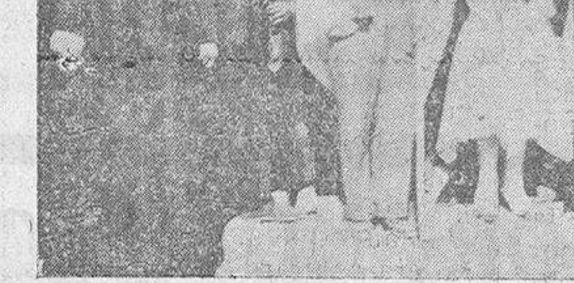
El excelentísimo señor Obispo con la madrina y socia de la Juventud Católica, después de bendecir la bandera.

A las doce hizo su entrada el señor Obispo, siendo recibido con una deli-