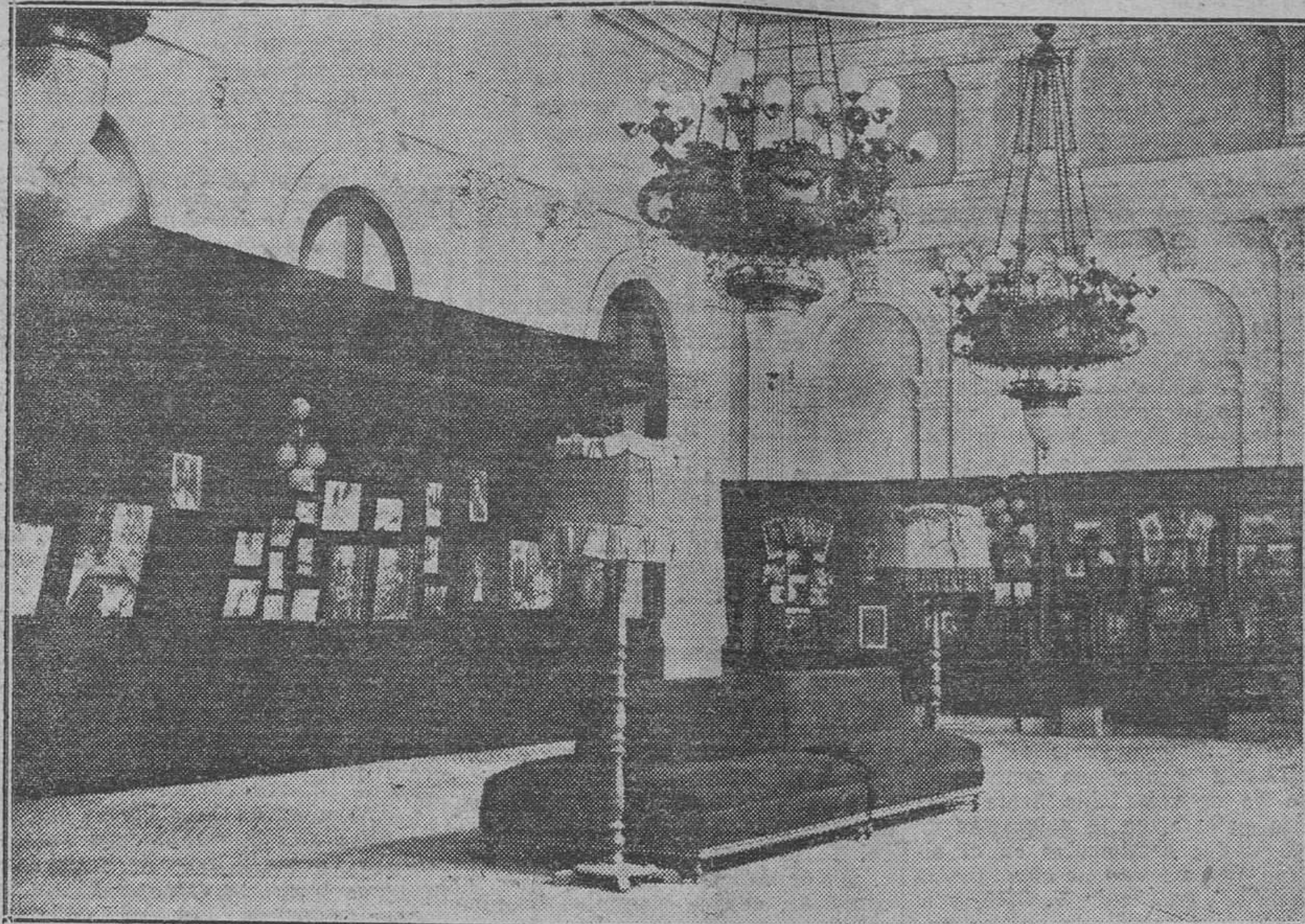
Un rincón del citado certamen

La patria de José Ribera el Español, que, con razón se ha dicho es como Toledo, un inmenso museo de arte antiguo, fiel a su tradición artística, se enorgullece de ofrecer un plantel admirable de jóvenes pintores, futuros maestros que ya nos recrean con las exquisiteces de sus obras.