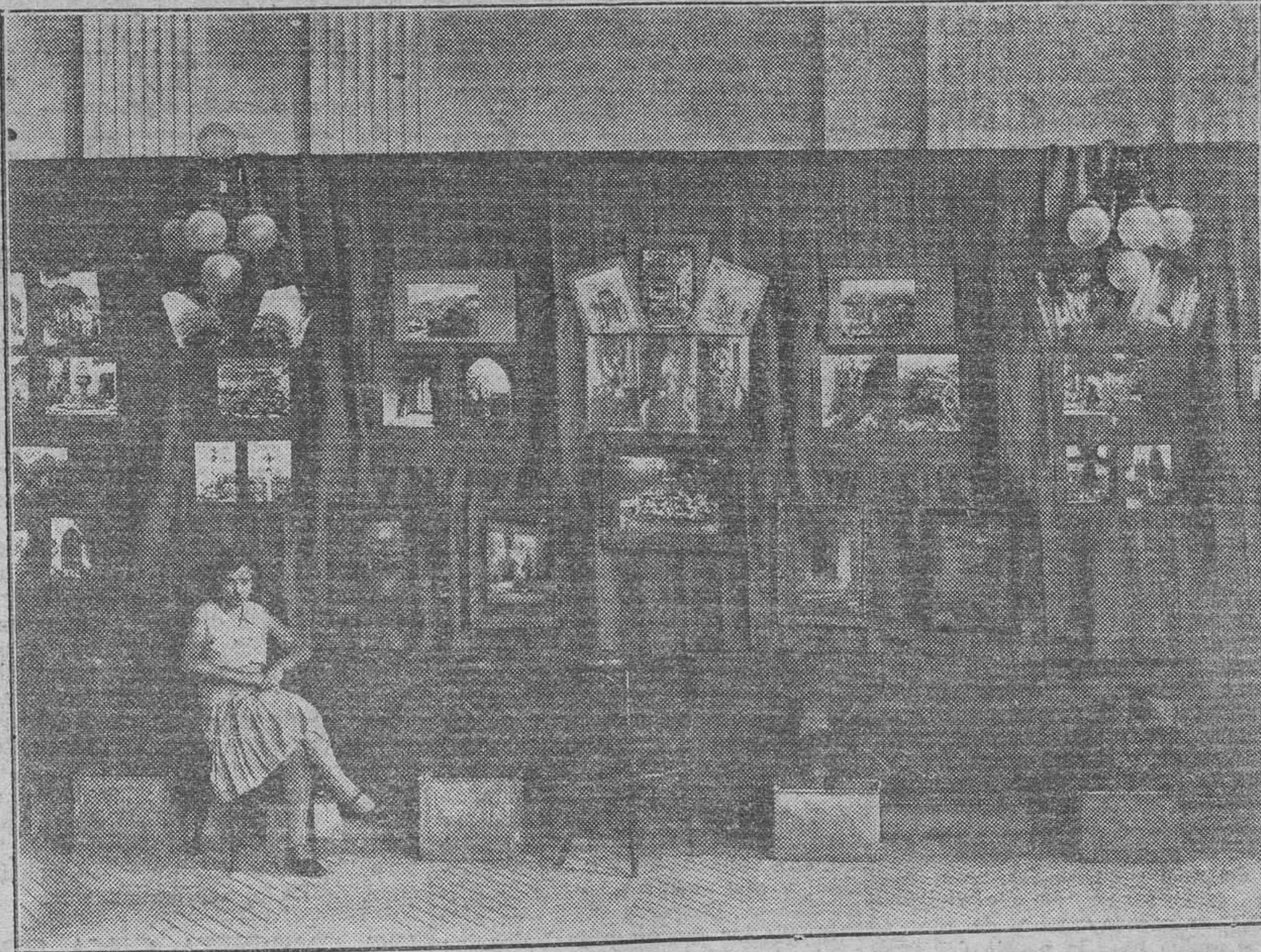
Un detalle de la Sección de Fotografías de Játiva y de la región valenciana, por nuestro colaborador don Carlos Sarthou Carreres

Todo ello nos demuestra la justicia que los premios que recientemente ha obtenido Sarthou Carreres en la Exposición de Barcelona y concursos de Madrid, Valencia y otras capitales.