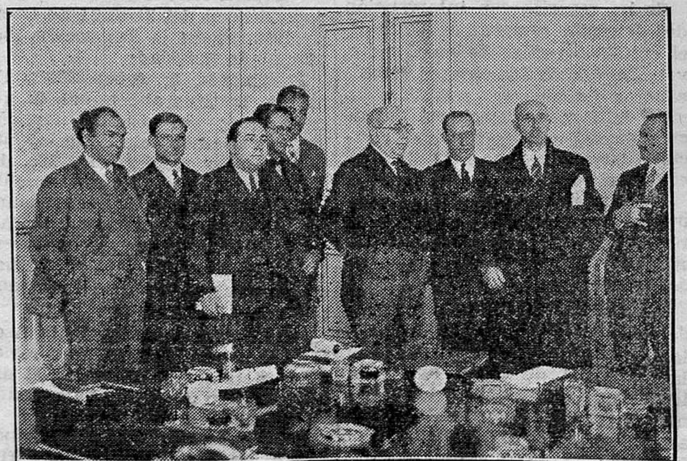
El jefe del Gobierno con el Patronato de incautación de bienes de los Jesuitas, después de la toma de posesión