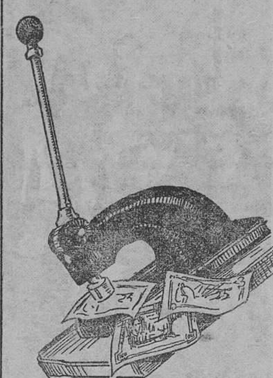
Troquel con el que se efectúa la operación de estampillar los billetes en el Banco de España

Esta ventanilla, sin embargo, tiene pocos o ningún visitante.