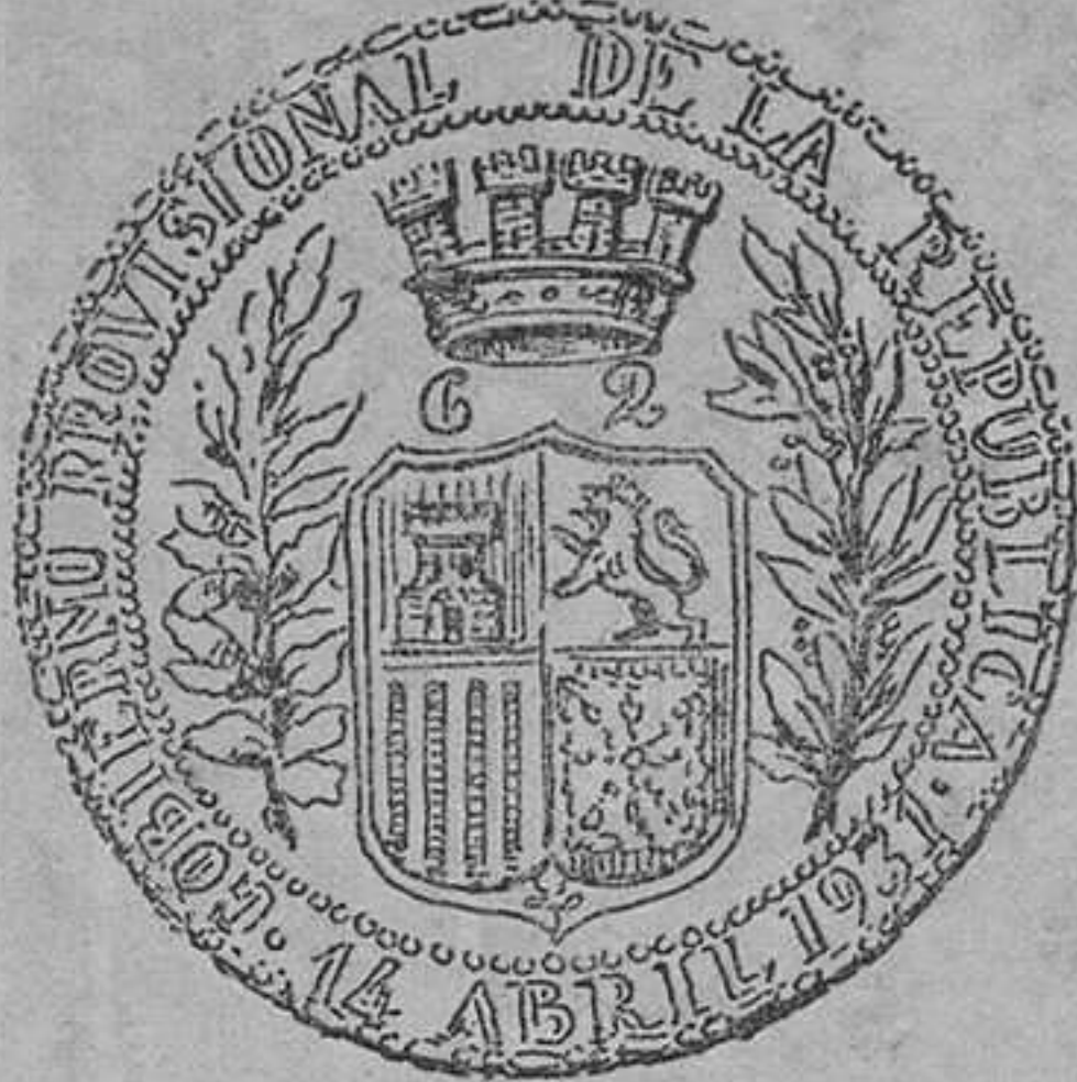
Estampilla que se imprime en los billetes

medidas resultan en la práctica "la carabina de Ambrosio".