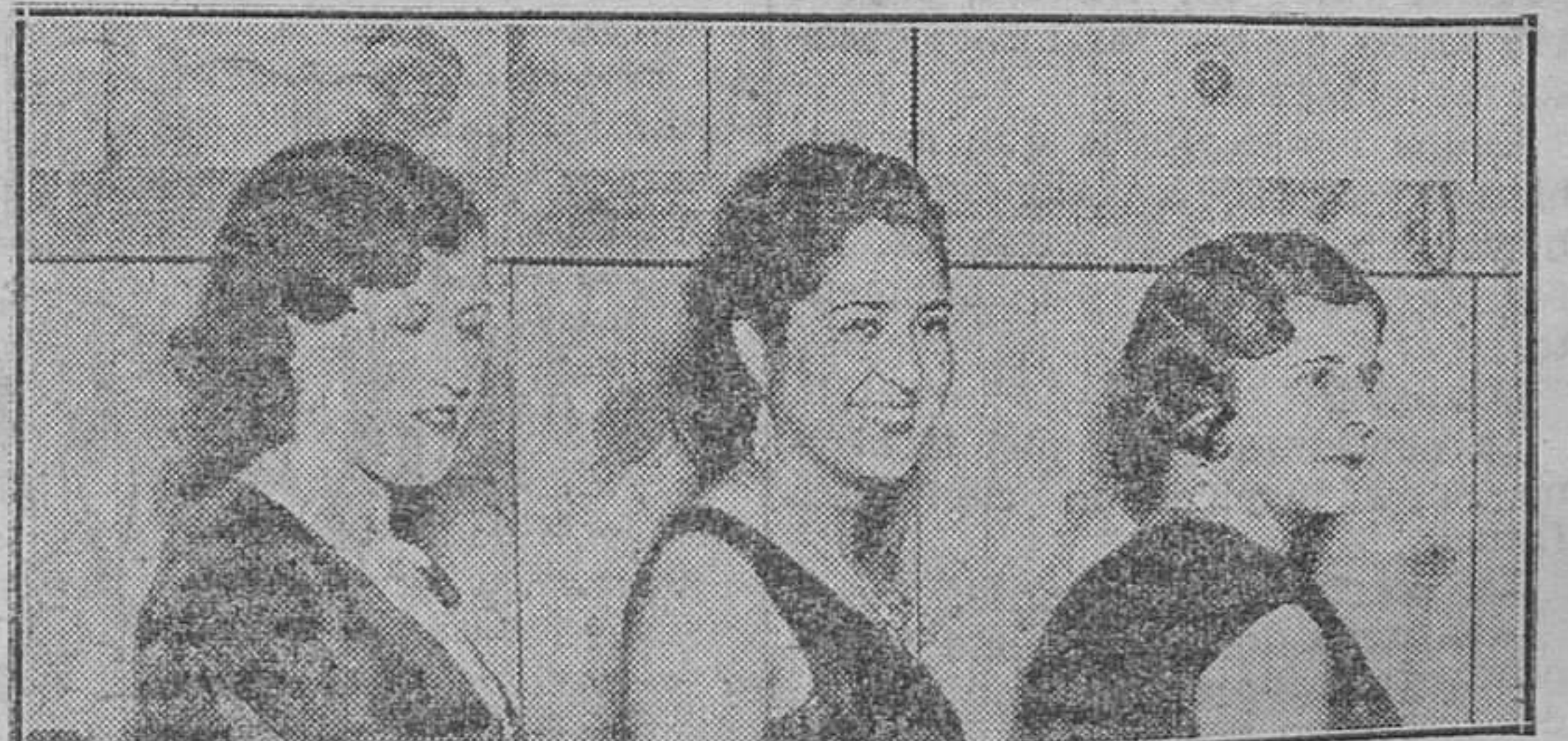
Las tres opositoras a reina del barrio. Quedó proclamada la que está en el centro