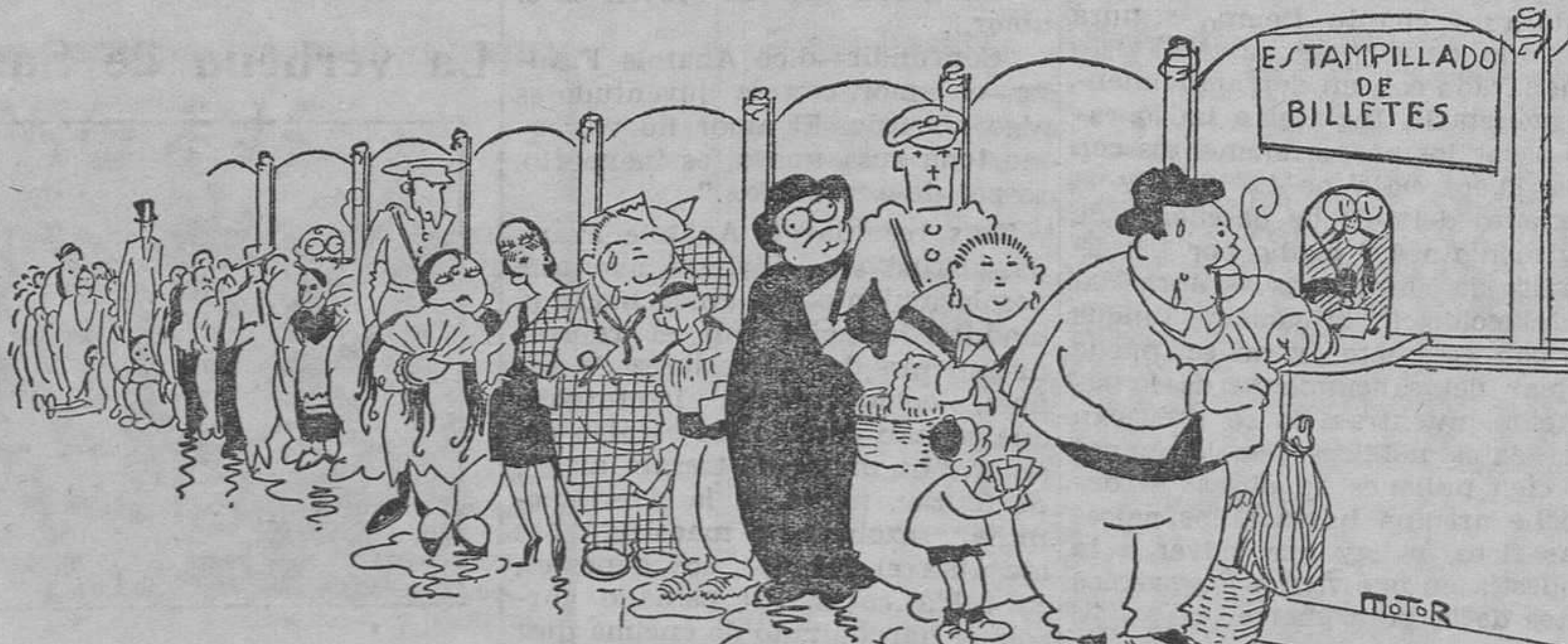
El estampillado o un asunto que trae "cola"

Un billete, jurídicamente considerado, es un pagaré representativo de un préstamo sin interés.