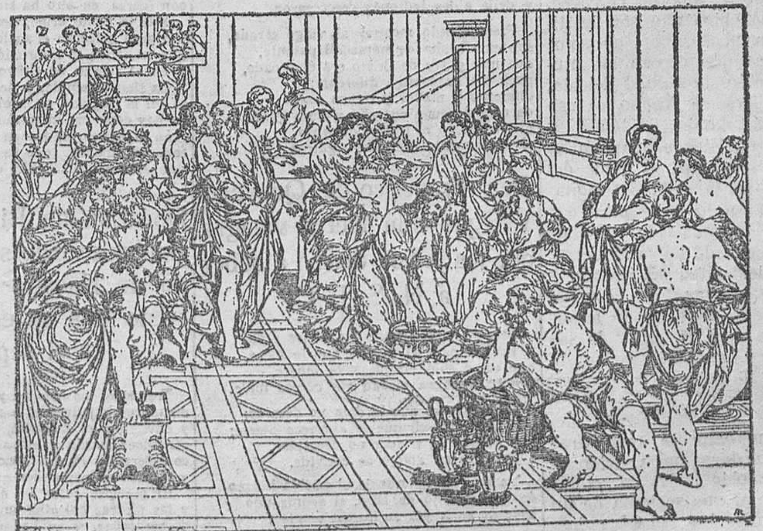
Cuadro de Muziano, del tesoro de la Catedral de Reims