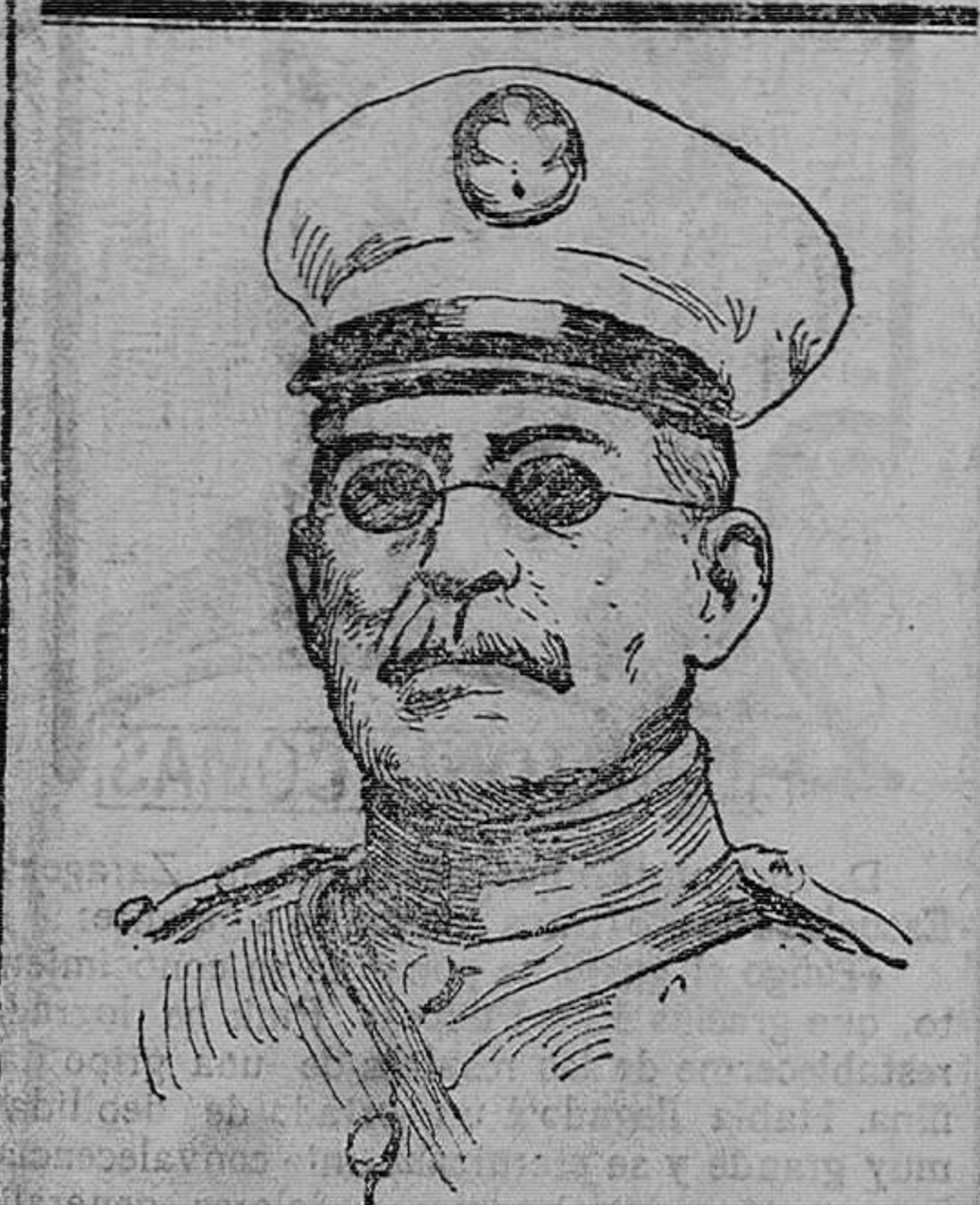
EL GENERAL HUERTA, quien después de renunciar la presidencia de la república de México, se ha embarcado para Europa.

Lina se encoge de hombros con supremo desdén. —Cuatro comidas no son más economías que el chocolate del loro.