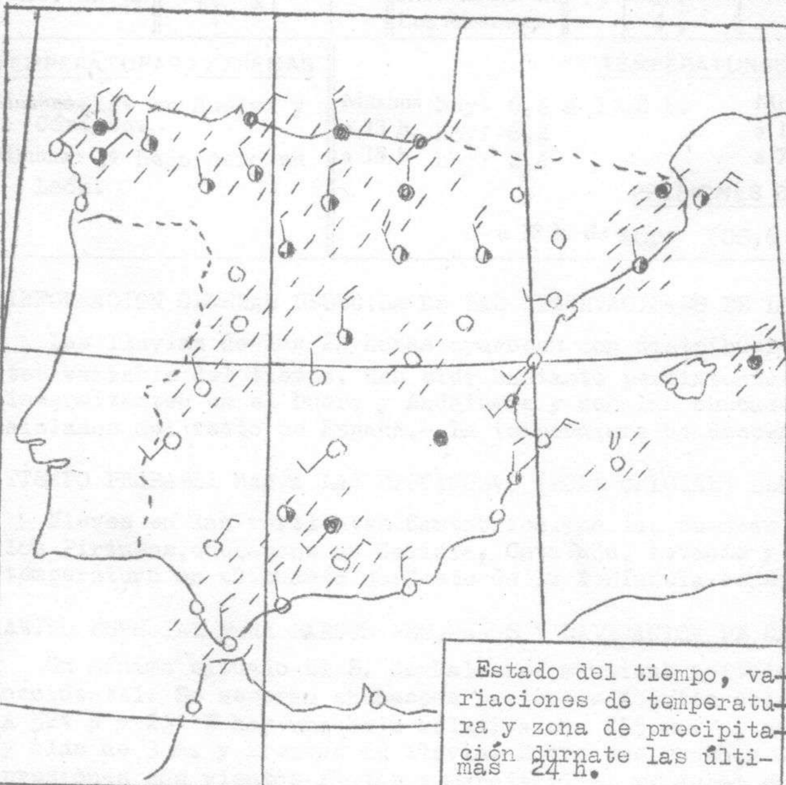
Estado del tiempo, variaciones de temperatura y zona de precipitación durante las últimas 24 h.