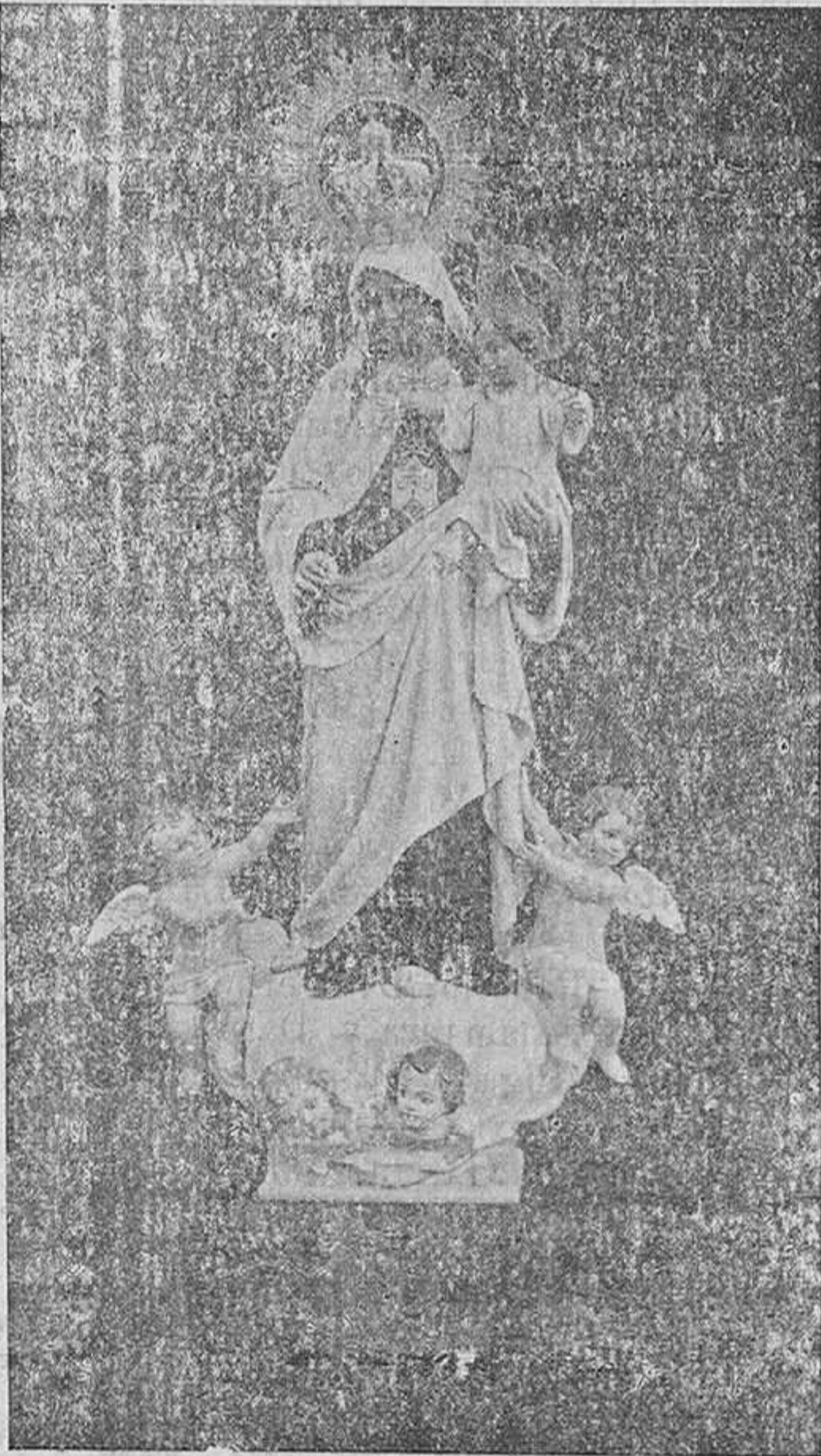
Nuestra Señora del Carmen.—Jesús Picón.

Día 17.—Misa de Comunión en San Francisco. Misa solemne en la Catedral, funcionando el «Botafumeiro». Vistrada ciudad. Pae lu