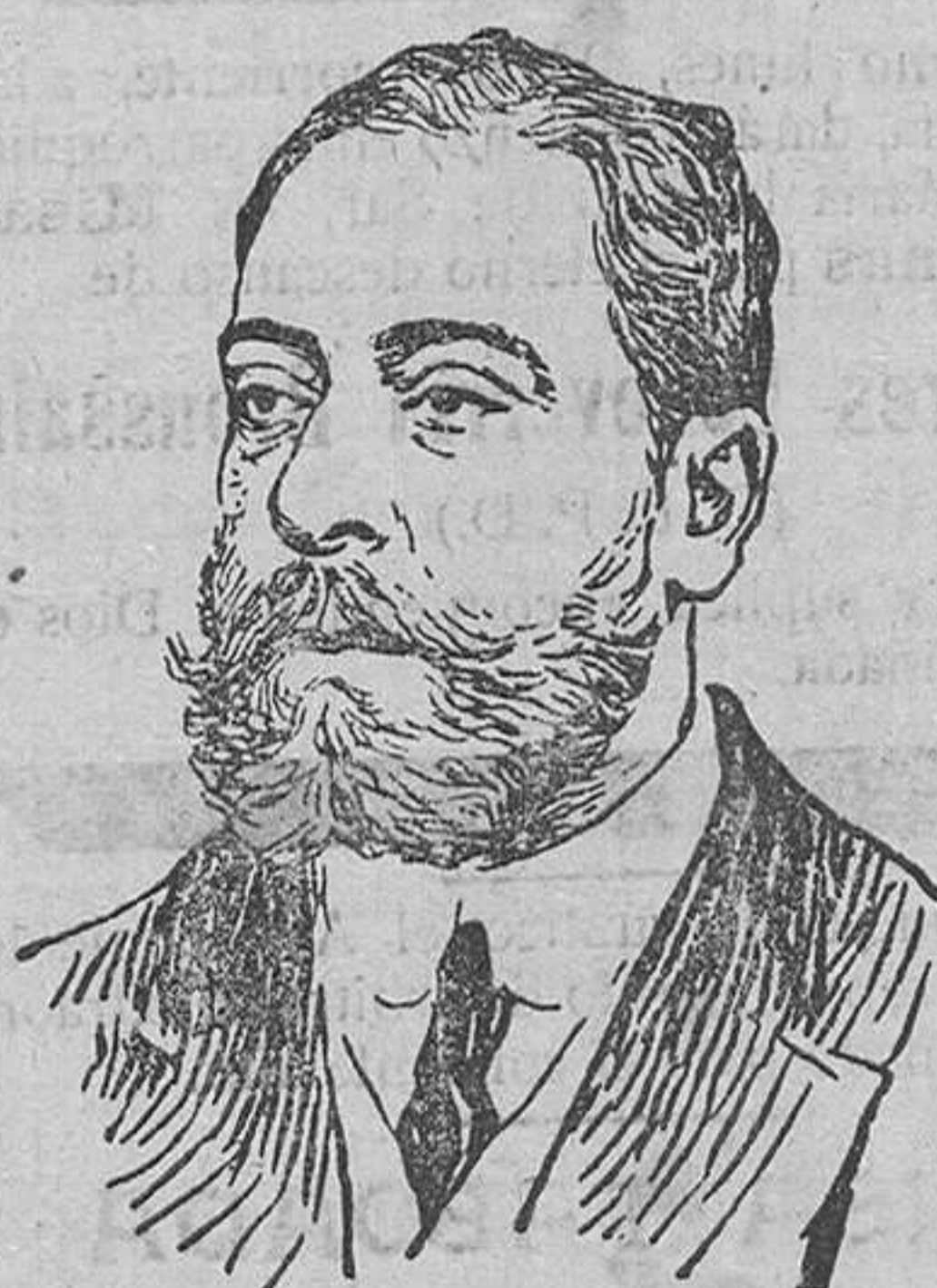
D. Julio Burell, nuevo ministro de la Gobernación.