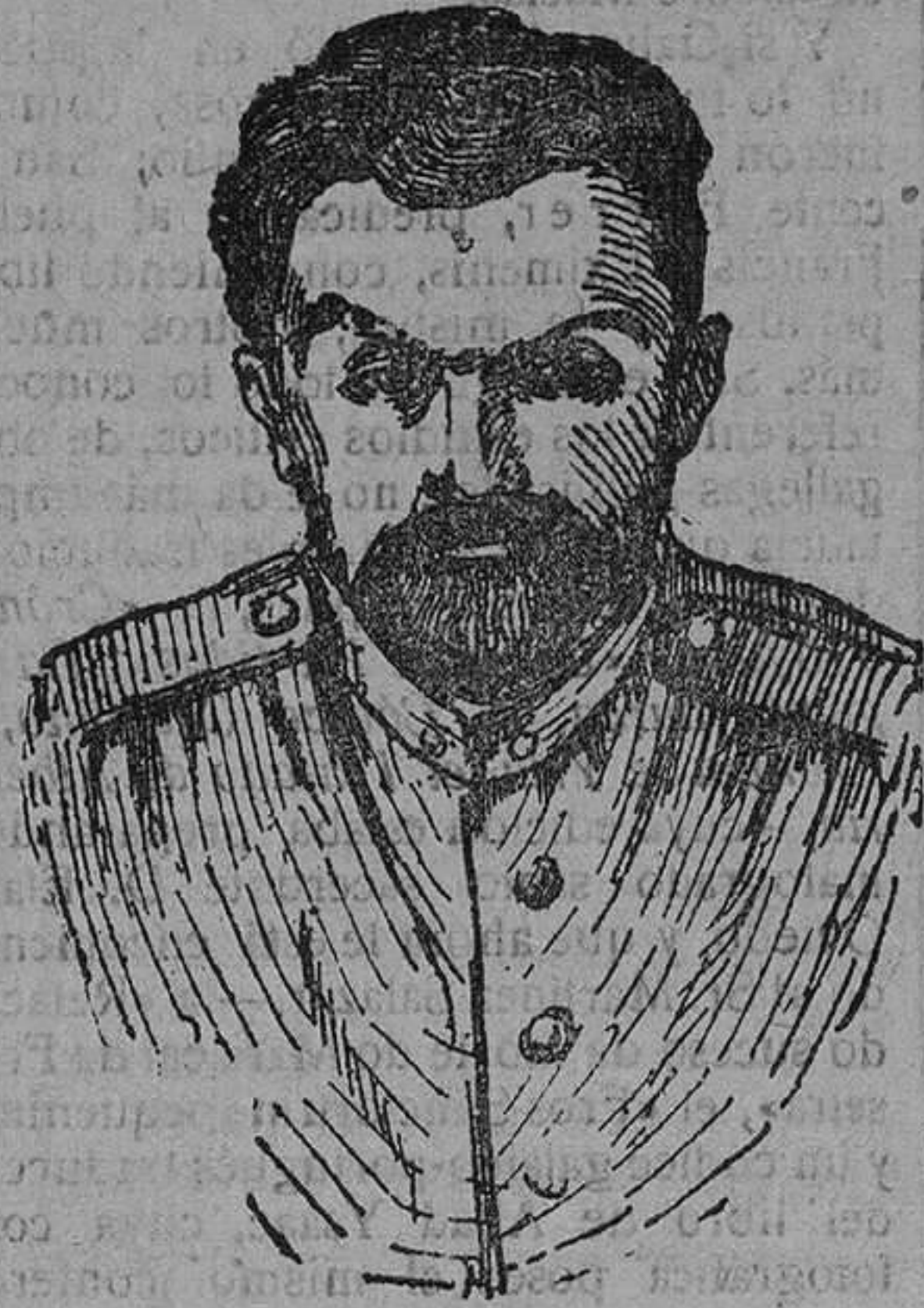
Mr. Moraloj, gobernador general de Moscow.