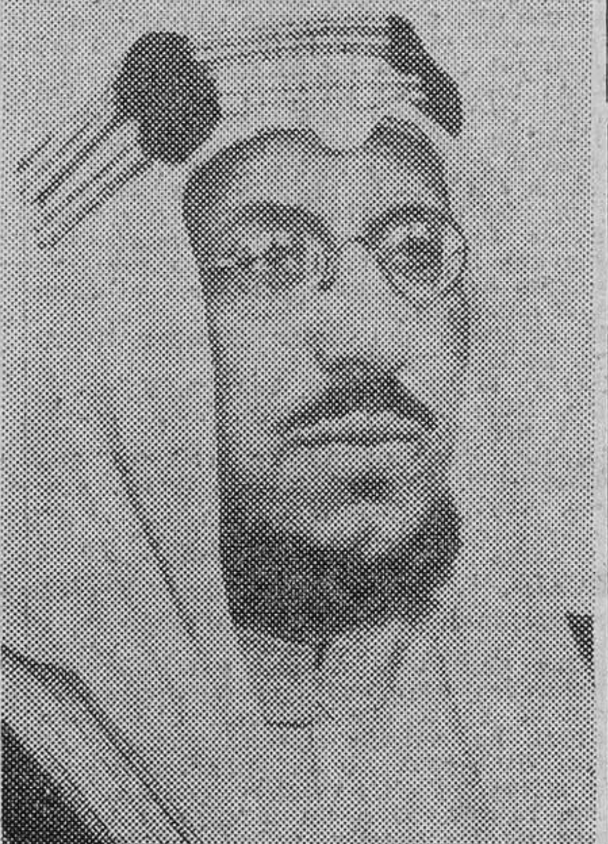
SAUD DE ARABIA

Cada vez que visitaba las tribus de su reino, contraía matrimonio con una de las hijas del jefe de la tribu. Como el Corán sólo permite cuatro esposas legítimas (aunque varias concubinas), cada unión iba precedida de la repudiación formal de una de las esposas precedentes. Aunque relegada al papel de concubina, la repudiada conservaba todas sus prerrogativas. Saud de Arabia se casó así cien veces. Ahora, apoyado por sus cien suegros todos jefes de tribu, regresó a su capital y volvió a ocupar prácticamente las riendas del Gobierno, destituyendo al príncipe Feisal.