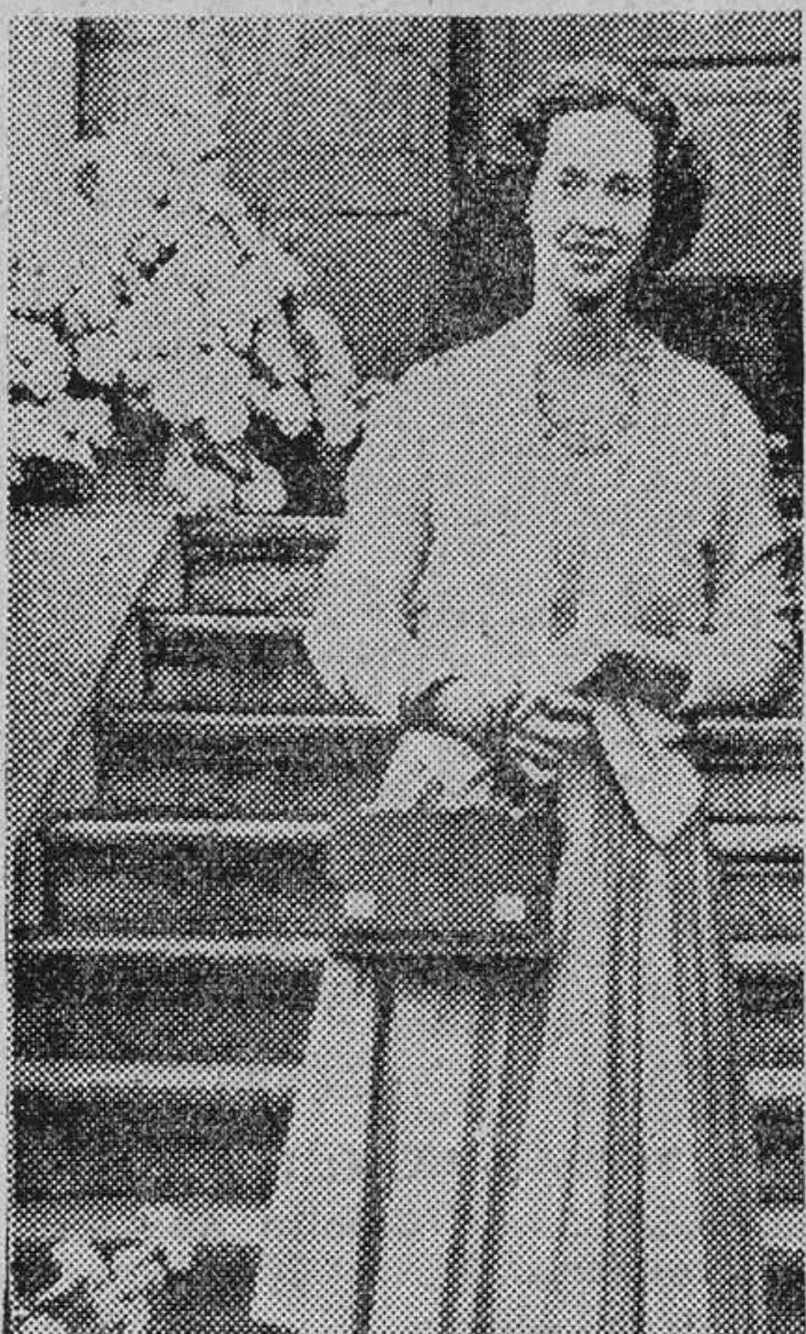
FABIOLA DE BELGICA

de Bruselas por tener algún acto oficial que deba celebrarse allí. Desde su boda, el rey prefiere trabajar en Laeken y ha-