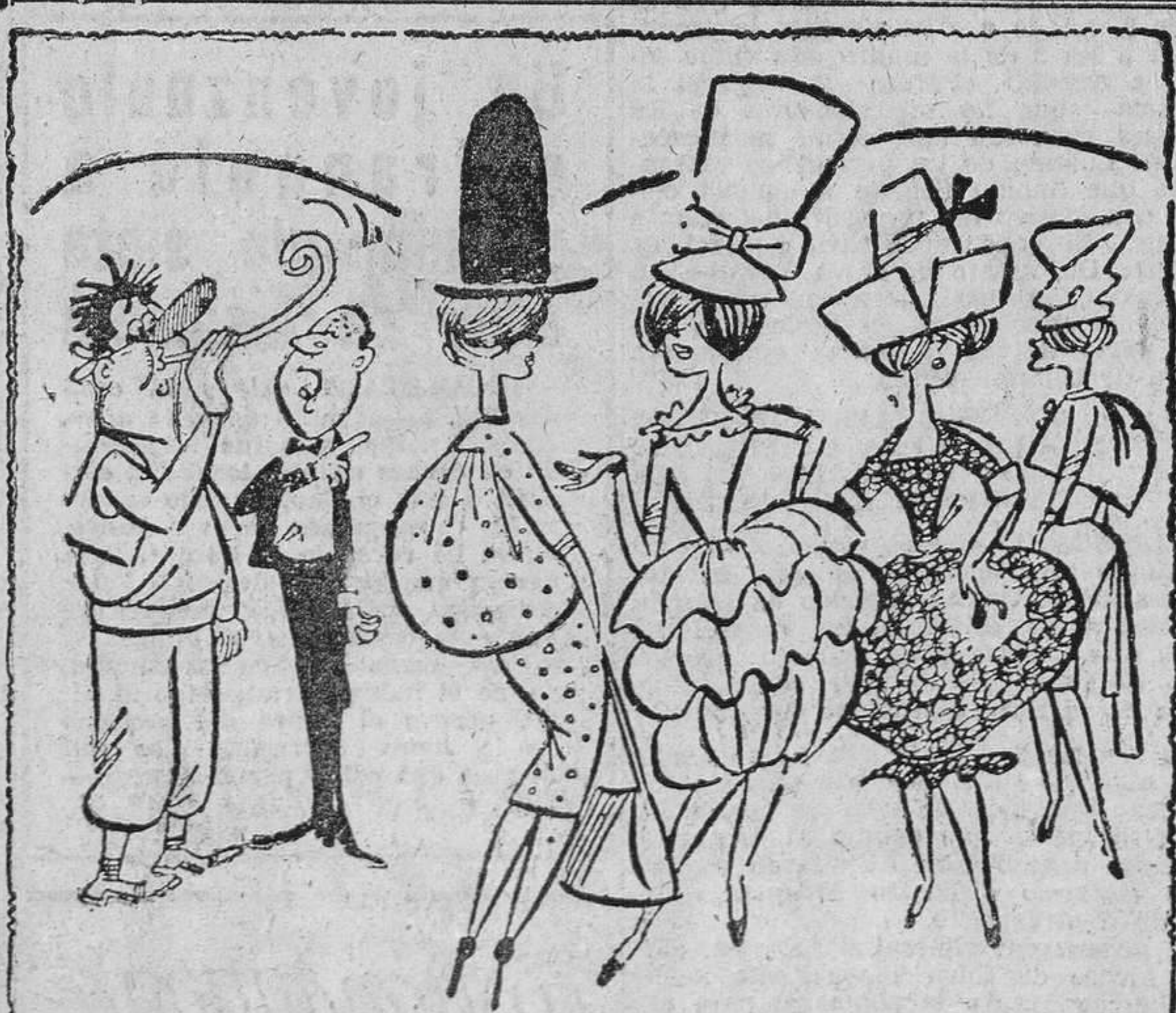
SE HA CONFUNDIDO SEÑOR. ESTO NO ES UN BAILE DE TRAJES, ES UN DESFILE DE MODELOS...

SEGUN EL GOBIERNO PORTUGUES, SE TRATA DE UN PLAN DE AGITACION, COINCIDIENDO CON LA CAPTURA DEL «STA. MARIA»