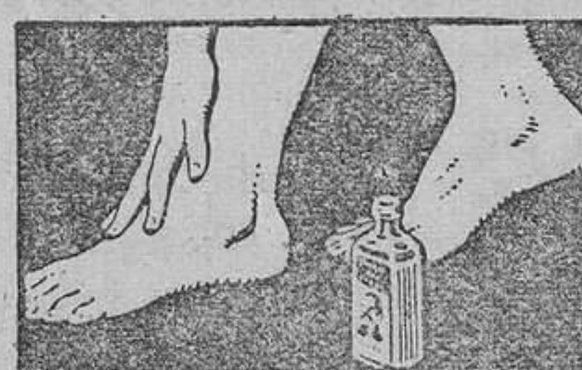
NO IRRITA NI CAUSA LA MENOR MOLESTIA

Dolores reumáticos, ciática, lumbago, resfriados, contusiones, torticolis, torceduras, toda clase de dolores musculares, desaparecen aplicando suavemente, sin frotar, el Linimento de Sloan.