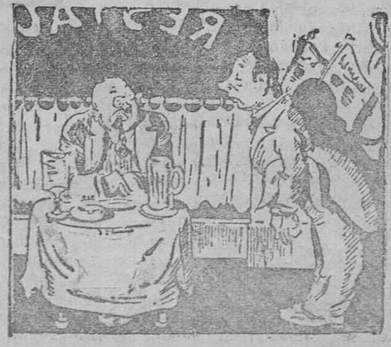
—Ya puede usted tomar un vaso de cerveza. —Cada hora o cada dos horas?