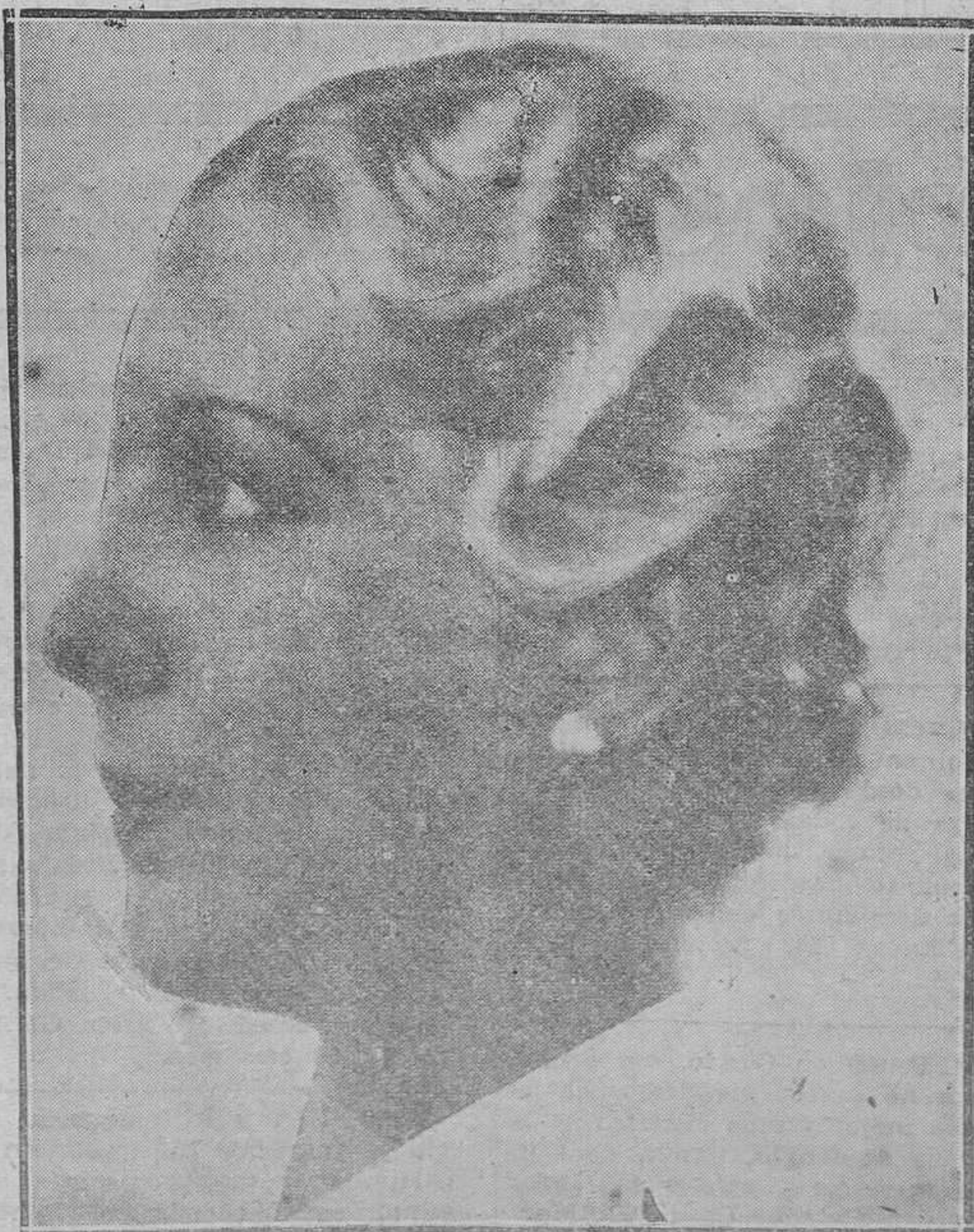
Natalia Moorehead, una de las más sugestivas bellezas de Cine-landia.