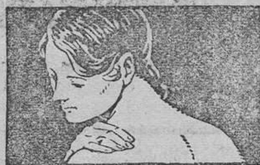
ALIVIA EL DOLOR DE TORSIONES Y DISLOCACIONES