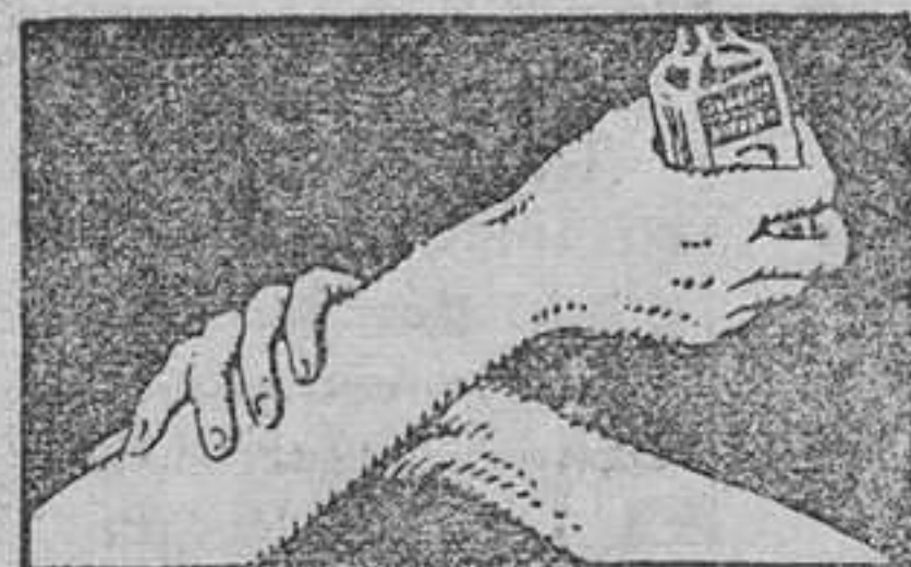
APLIQUESE SUAVEMENTE PENETRA SIN FROTAR

hay muchos remedios. Son todos ellos eficaces? El mejor remedio es aquel que ha probado su mérito durante cincuenta años. Y ese es el Linimento de Sloan. Productos nuevos, anunciados a bombo y platillo, han venido y han desaparecido, pero el Linimento de Sloan continúa siendo el verdadero "mata dolores".