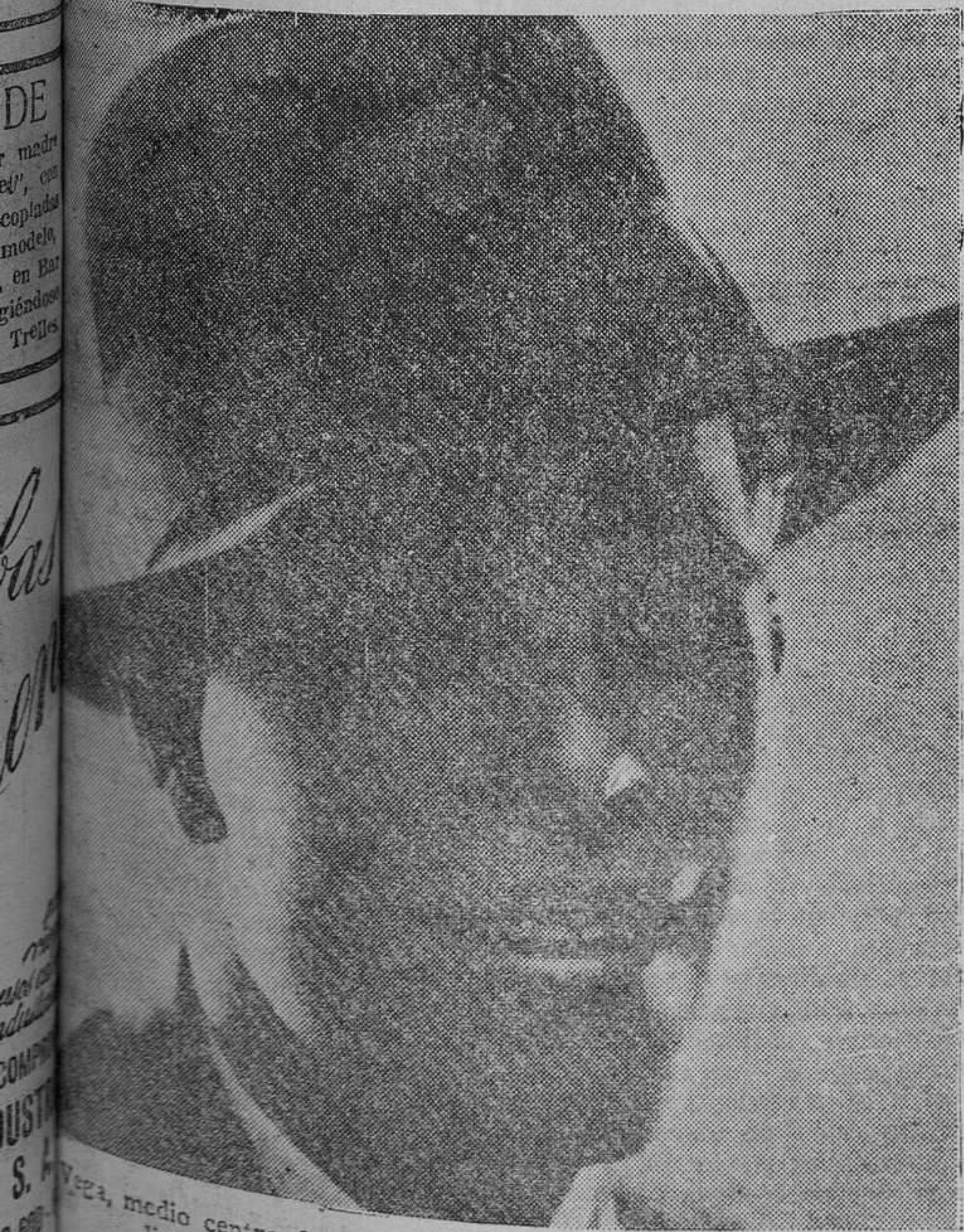
... medio centro del Celta de Vigo, que el domingo, en el Molinón, no acreditó la fama de que venía precedido.