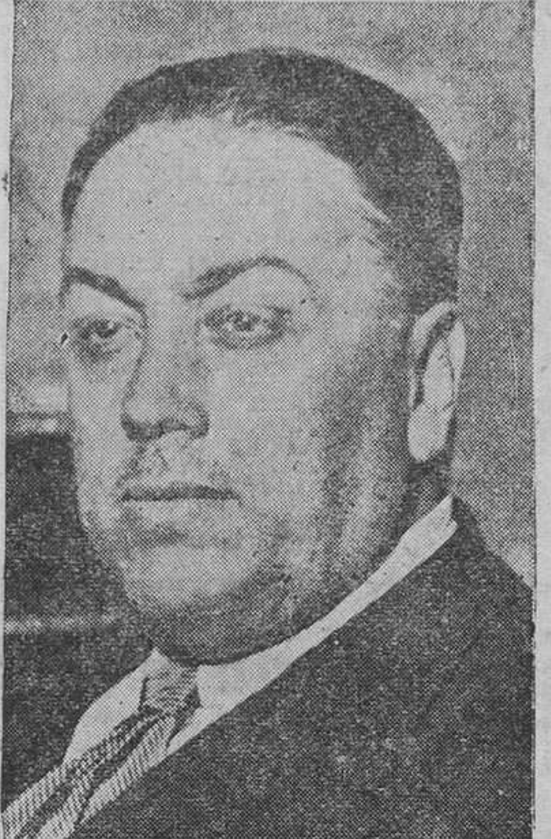
El señor Martínez Barrio, que de la cartera de Guerra pasa a Gobernación.

He podido—añadió—decirles a ustedes lo que hay al salir de Palacio después del Consejo. Pero de