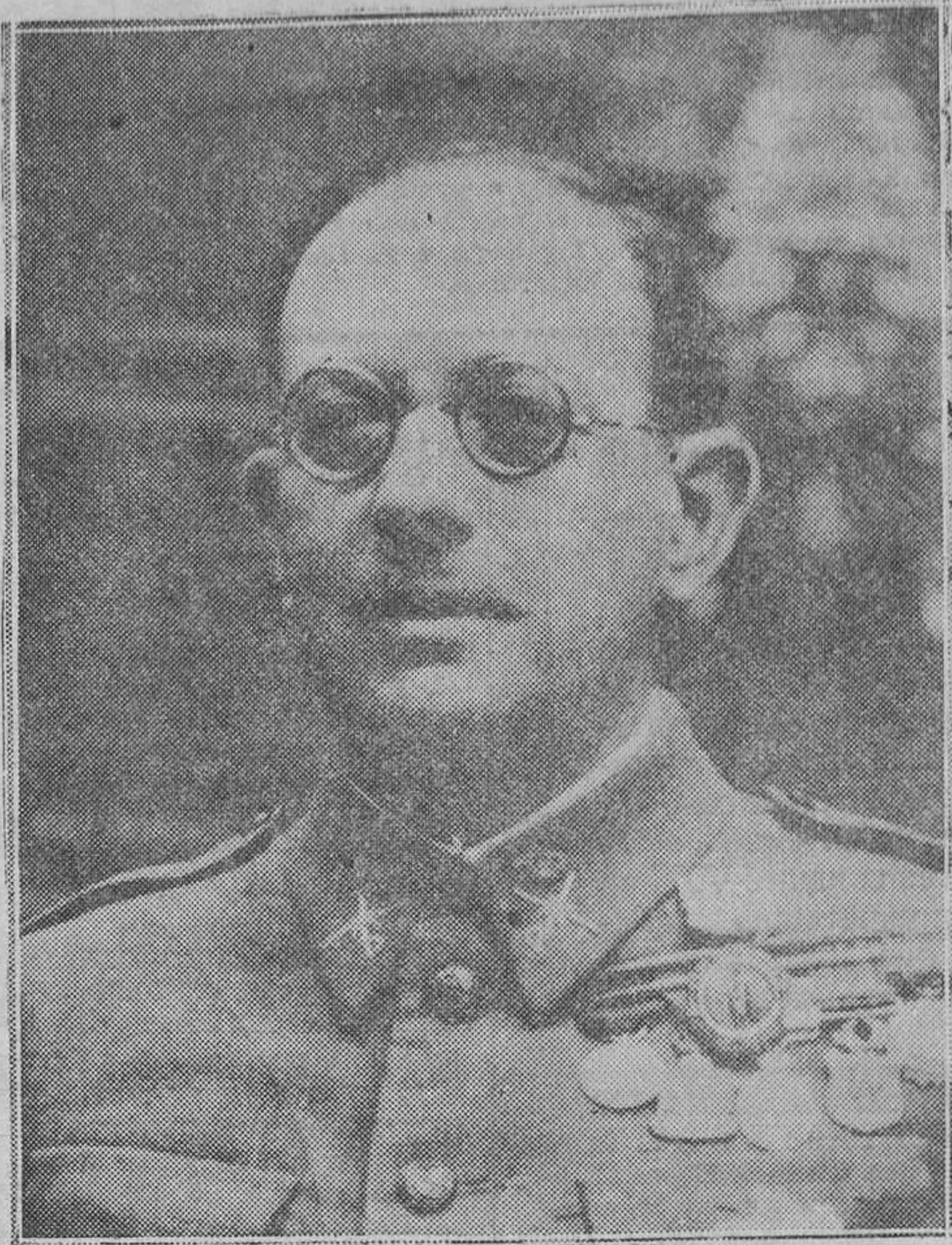
El general Gómez Morato nombrado Alto Comisario interino en Marruecos, en cuyo cargo fué confirmado ayer el señor Rico Avello.

Se le negó en algunos periódicos a don Alvaro el bagaje jurídico. Bien. Ya sabemos que el señor Albornoz no ha