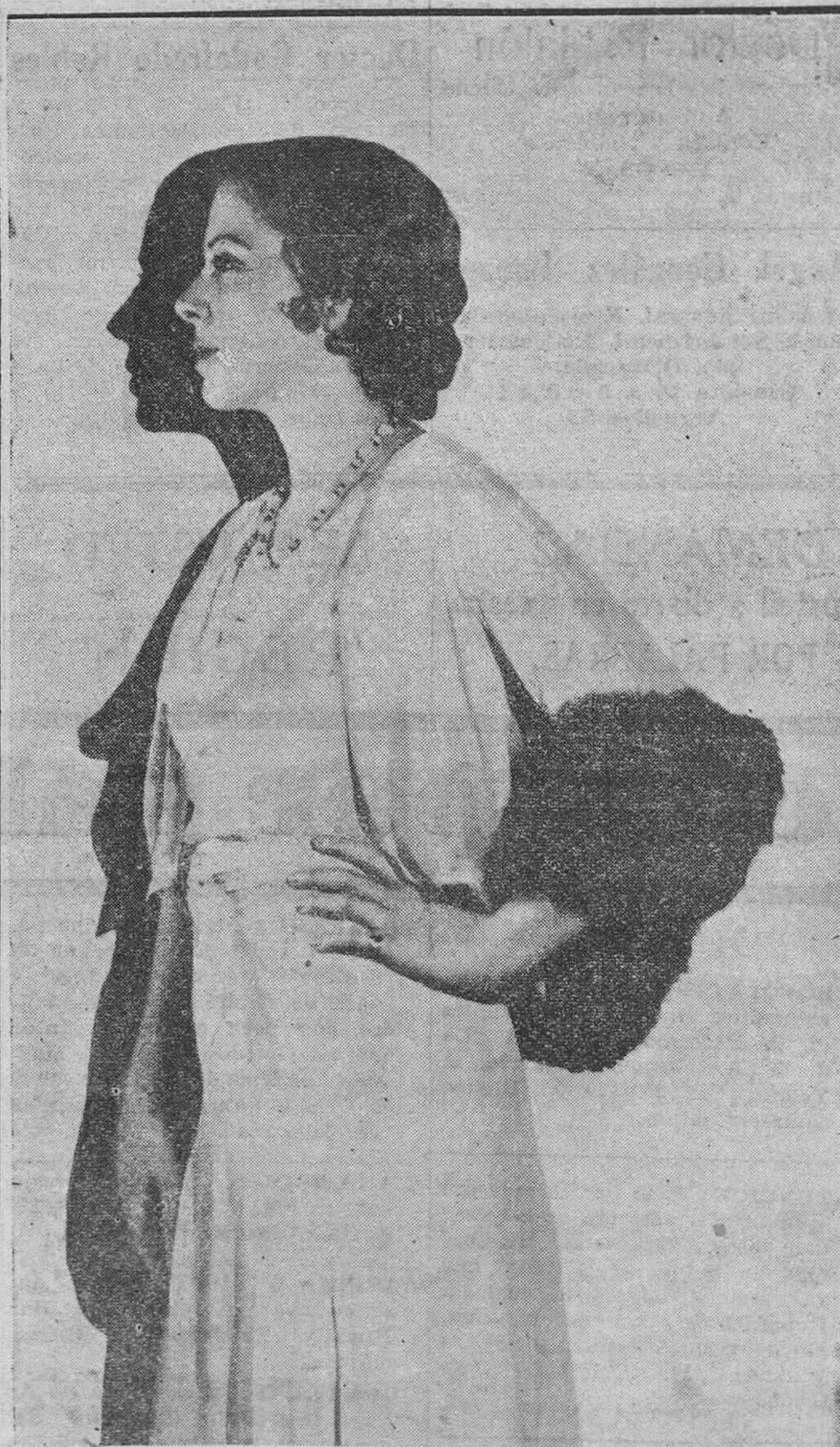
La ilustre actriz Catalina Bárcena, que logra otro éxito clamoroso con su interpretación de la protagonista de "Yo, tú y ella", hermosa película basada en una obra de Martínez Sierra, que se estrenó ayer en el Campoamor.