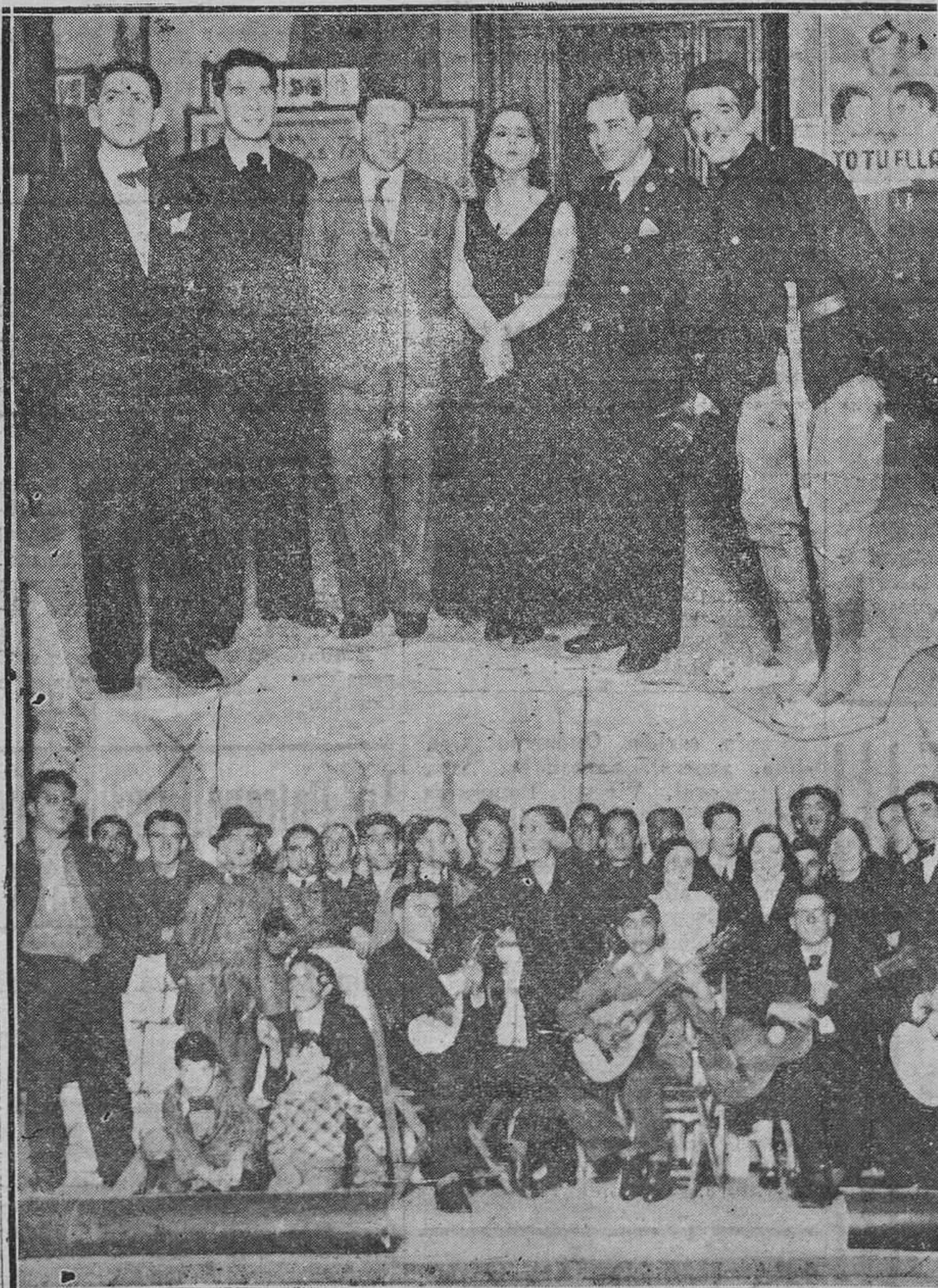
Arriba: Los más destacados elementos que contribuyen al éxito excelente del festival. Abajo: Cuarteto "Ilusión" y cuadro artístico de "La Corredoria" que se han revelado como verdaderos "ases" en sus diferentes interpretaciones artísticas. (F. Méndiz).