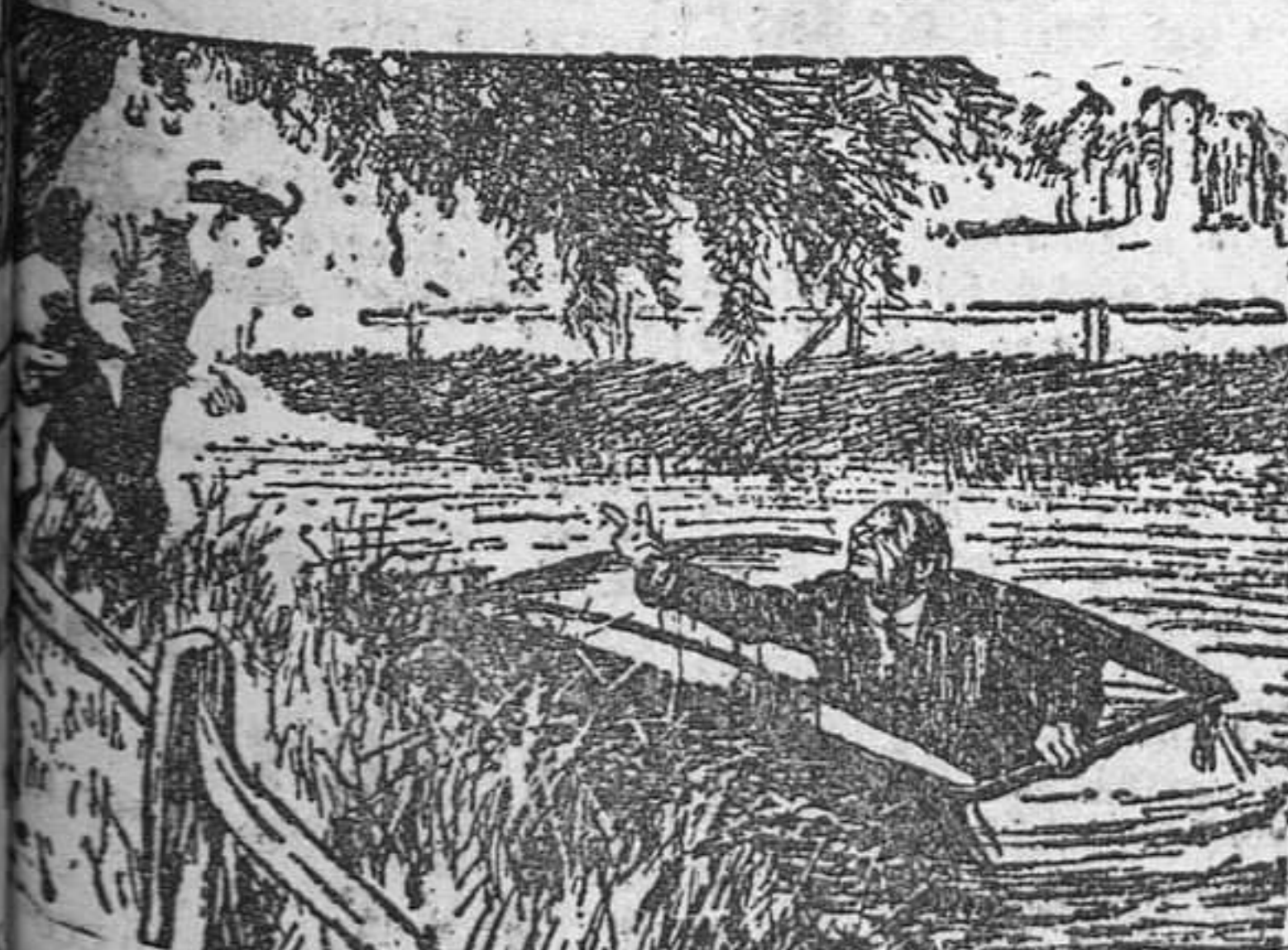
EL BARQUERO: - Pero ¿qué es esto? - Pues que mi amigo y yo fuimos expulsados anoche del Club Náutico.