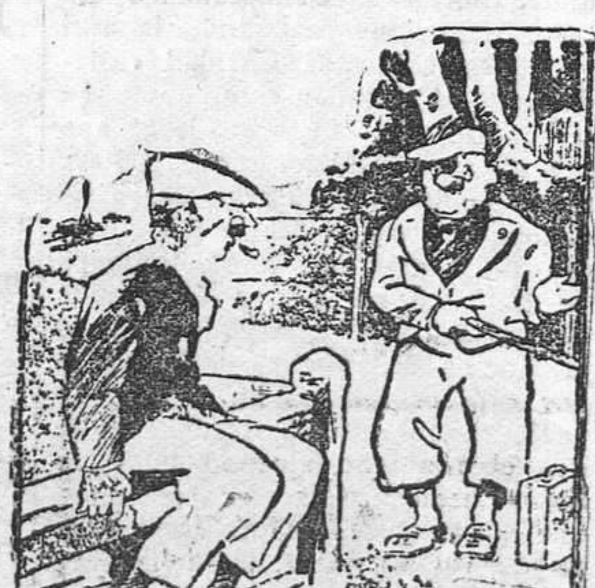
- Por poco no disparo contra su amigo, señor Gastón. Le había tomado por una bestia. - Pues no se ha equivocado usted.