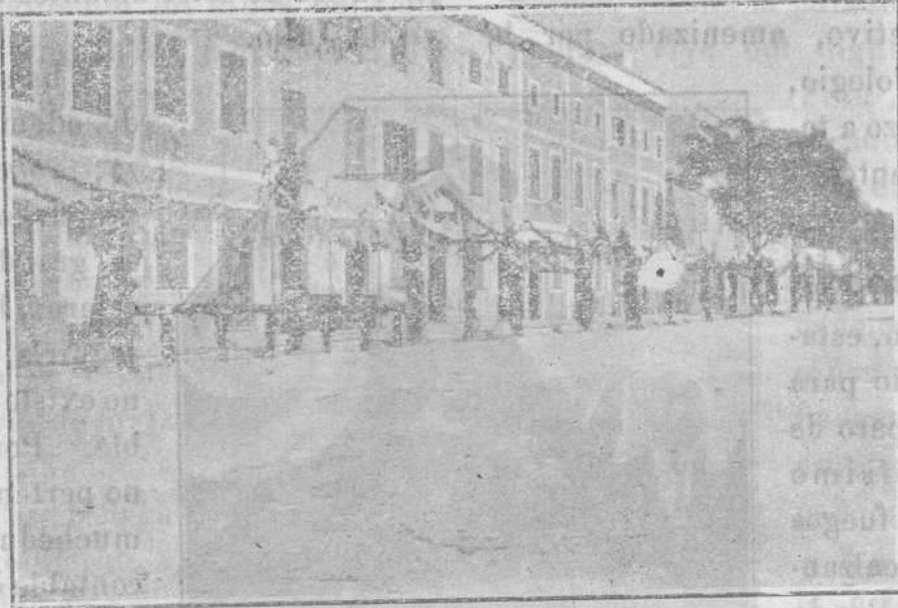
--- Aspecto que ofrecían los adornos de la calle de Alfonso III ---

patria se desarrolla, se vigoriza, se depura, y nos presenta acciones heroicas como las del 9 de Julio de 1558, a la par que recuerdos sentidos y ca-