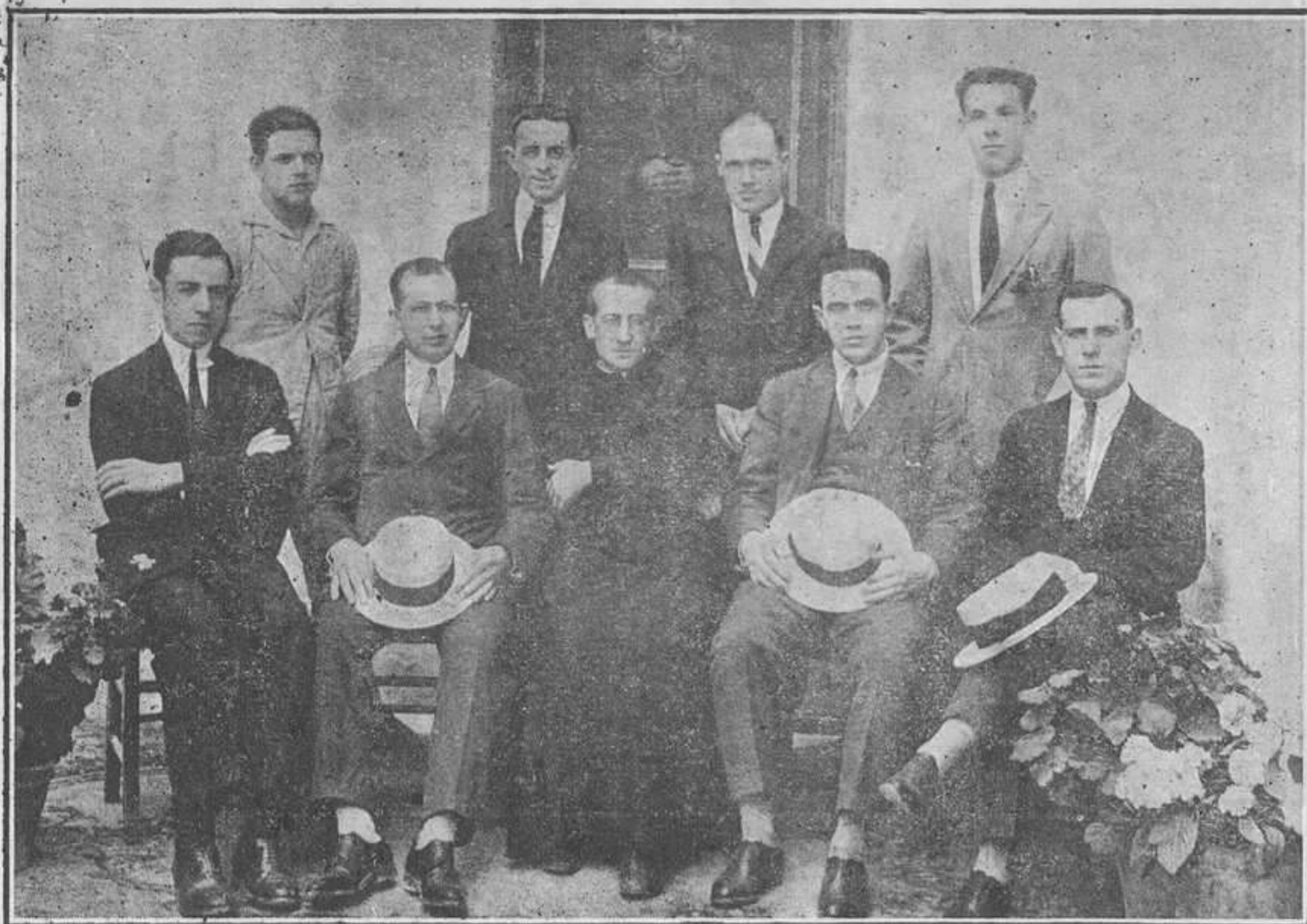
Junta Directiva de la «Unión» que organizó los festejos

Los Antiguos Alumnos Salesianos —rama pujante de una Congregación religiosa—, después de haber ofrecido ejemplo magnífico de piedad a Menor-