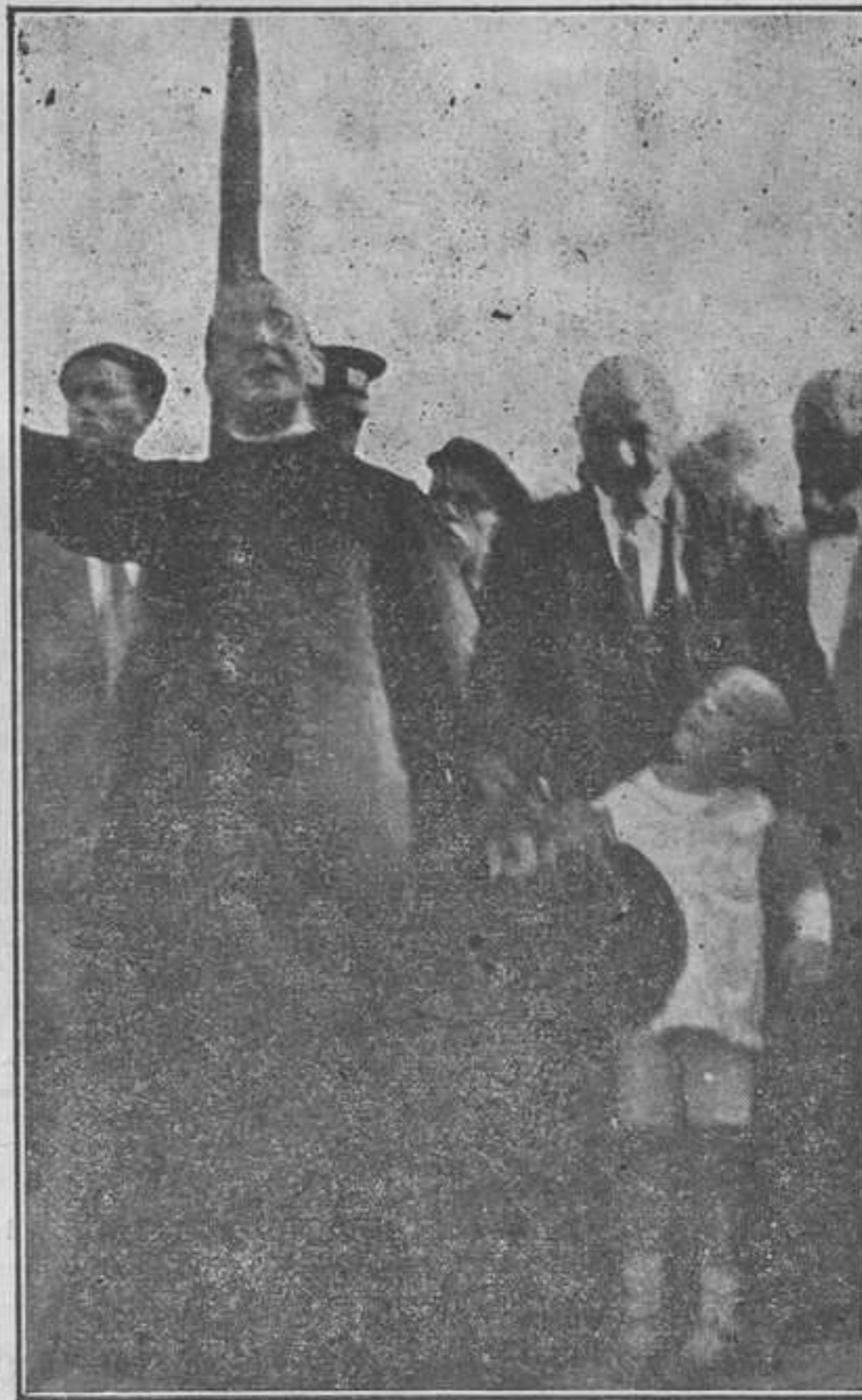
El P. Director durante su entusiasta disertación

Una multitud grandísima llenaba la vasta plaza, agolpándose alrededor de la pirámide que nos recuerda en lenguaje elocuente el sacrificio de nuestros antepasados que supieron combatir hasta la muerte en defensa de la religión y de la patria, pro aris et focis , según reza la lápida de nuestro obelisco.