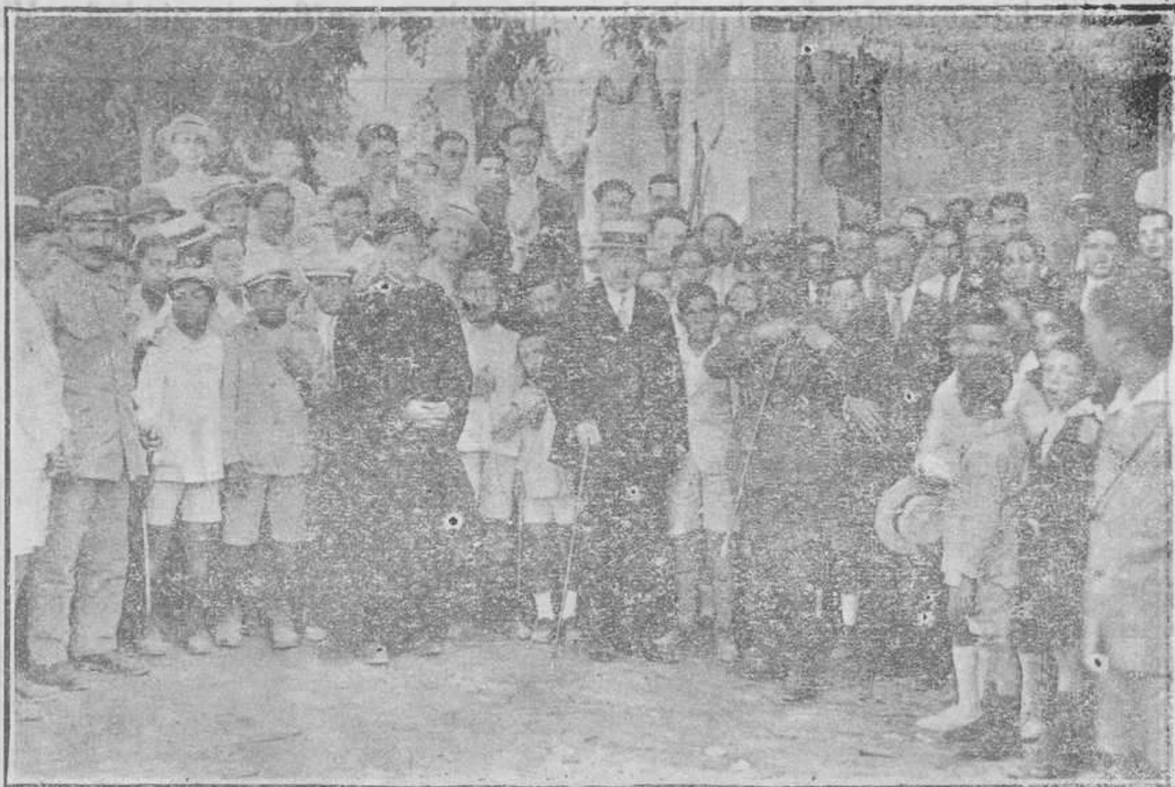
Llegada de las autoridades al «Centro de la Unión»

paces de oponer el pecho a quince mil soldados turcos desde el 2 hasta el 9 de Julio del año 1558, muy bien merecían el tributo de nuestras plegarias y de nuestros entusiasmos, y no les regatearon ni lo uno ni lo otro los entusiastas Antiguos Alumnos Salesianos.