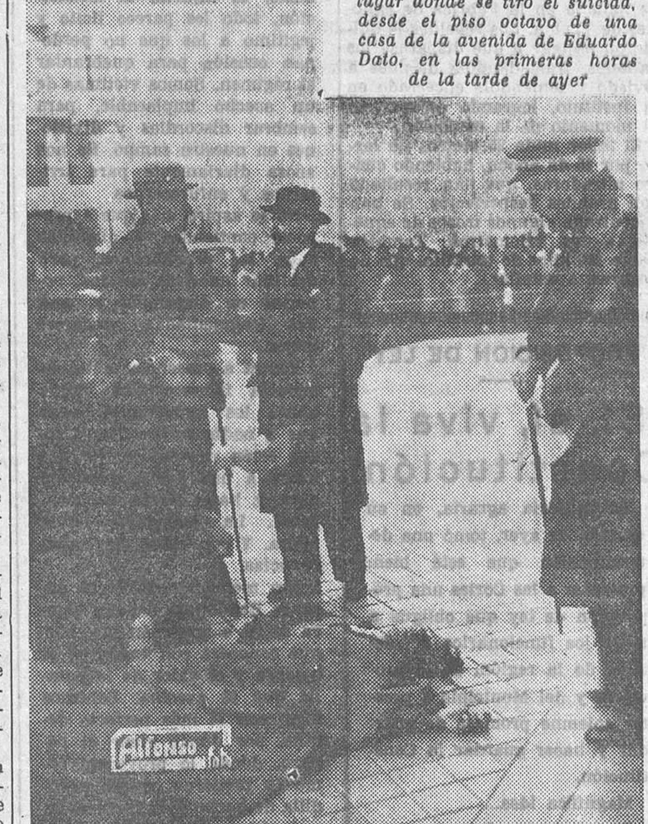
El juez y las autoridades en el lugar donde se tiró el suicida, desde el piso octavo de una casa de la avenida de Eduardo Dato, en las primeras horas de la tarde de ayer

En la casa número 32 de la calle de Eduardo Dato se presentó ayer a primera hora de la mañana un individuo elegantemente vestido, quien solicitó del portero de la finca que le enseñara un cuarto en el piso octavo, que se halla desalquilado. El portero accedió a los deseos del desconocido y le acompañó para que viera el cuarto desalquilado. El desconocido recorrió todas las habitaciones y se mostró conforme con la renta del cuarto y con los demás detalles exigidos para el alquiler. Arguyó, sin embargo, el desconocido que para habitar el cuarto era preciso hacer algunas reformas. Seguidamente se despidió del portero, diciendo que volvería más tarde para dar una contestación definitiva. A las pocas horas volvió a la casa el desconocido, manifestando al portero que le agradaba el cuarto, y como estuvo dispuesto a habitarle, deseaba ponerse de acuerdo con el administrador sobre las obras que habían de realizarse. El portero accedió a la pretensión del desconocido, y como el administrador vive en la misma finca, fué a manifestarle tal pretensión, dejando solo al visitante. Este, al verse solo, abrió uno de los balcones y se arrojó a la calle, cayendo el cuerpo del infeliz individuo delante de la taquilla del Coliseum. En aquel momento penetraban en el piso el portero y el administrador, quienes rápidamente comprendieron que algo anómalo