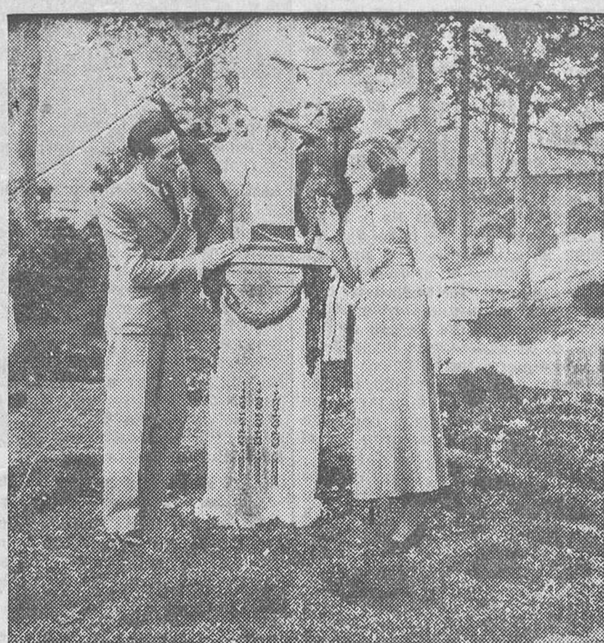
Una escena de «Madrid se divorcia», film nacional que se estrenará próximamente

porada, presentará hoy un gran film Paramount, que tiene una extraordinaria cualidad para nuestro público, y especialmente para el público popular: la intervención como protagonista del famoso cantador de tangos argentinos Carlos Gardel, ídolo de las multitudes. En «Cuesta abajo», a la técnica y la realización perfectas de la renombrada editora norteamericana se unen el interés de un asunto hispanoamericano, un diálogo