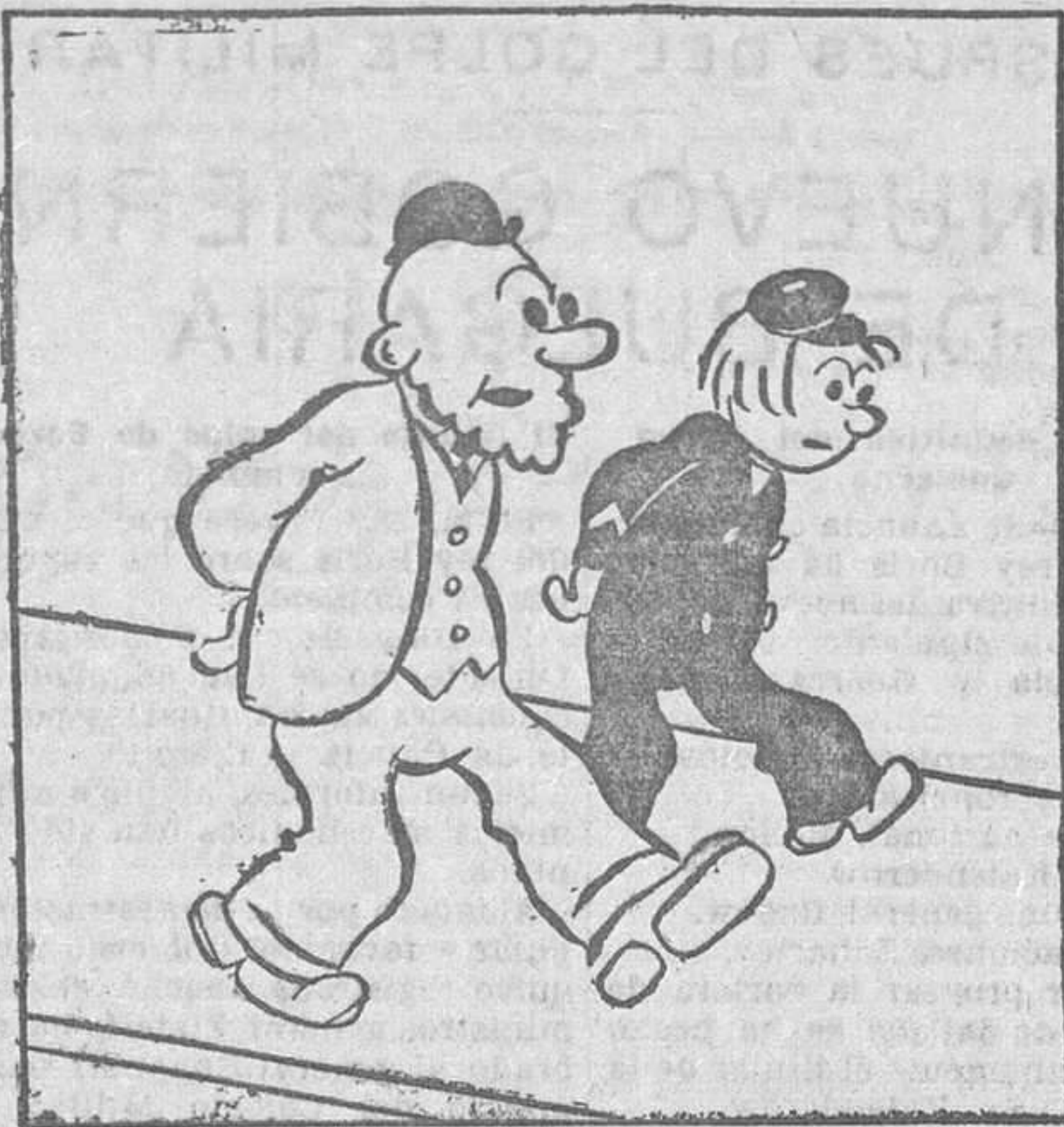
—Te has quedado sin premio!... ¡Qué vergüenza!..