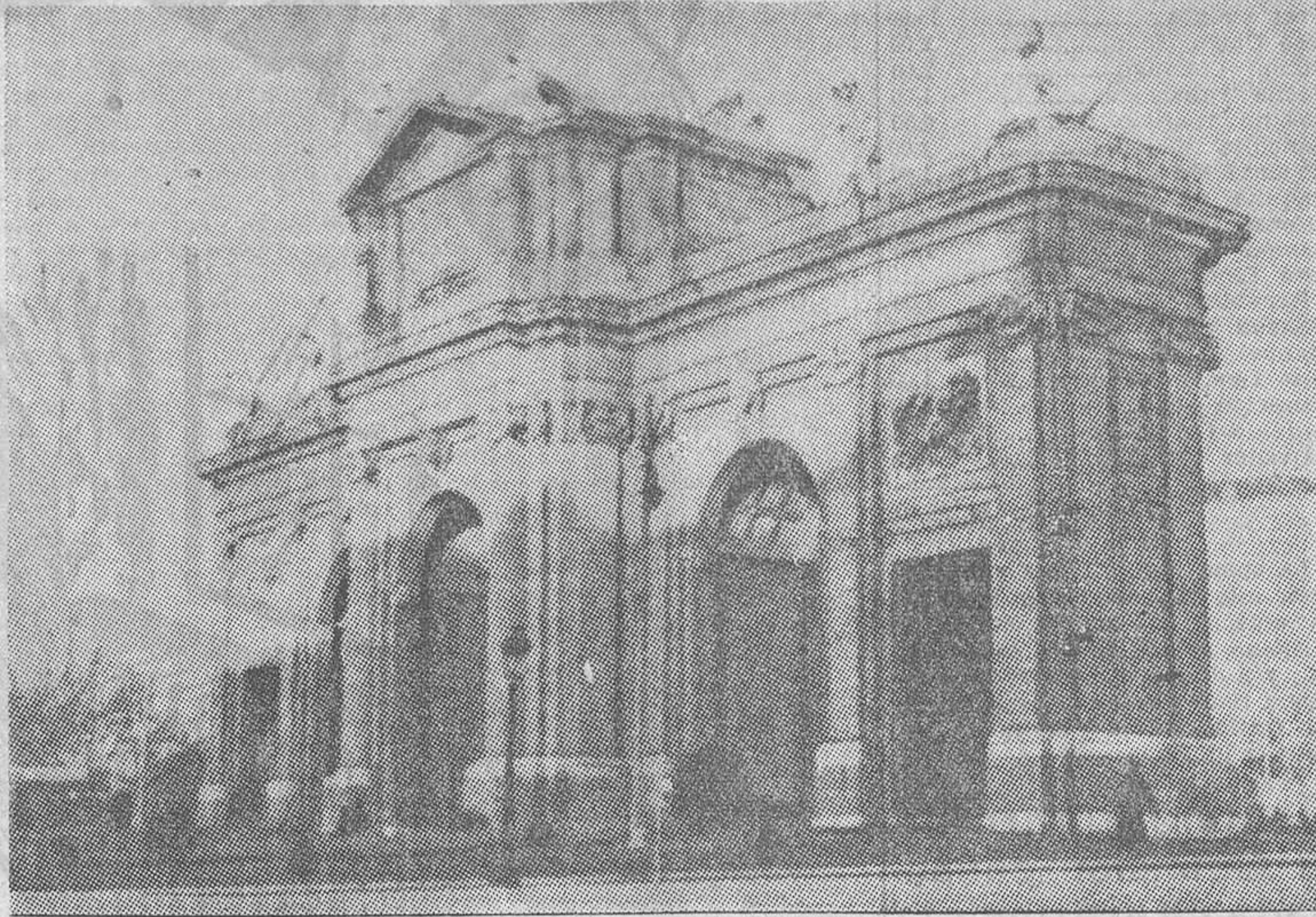
Puerta de Alcalá