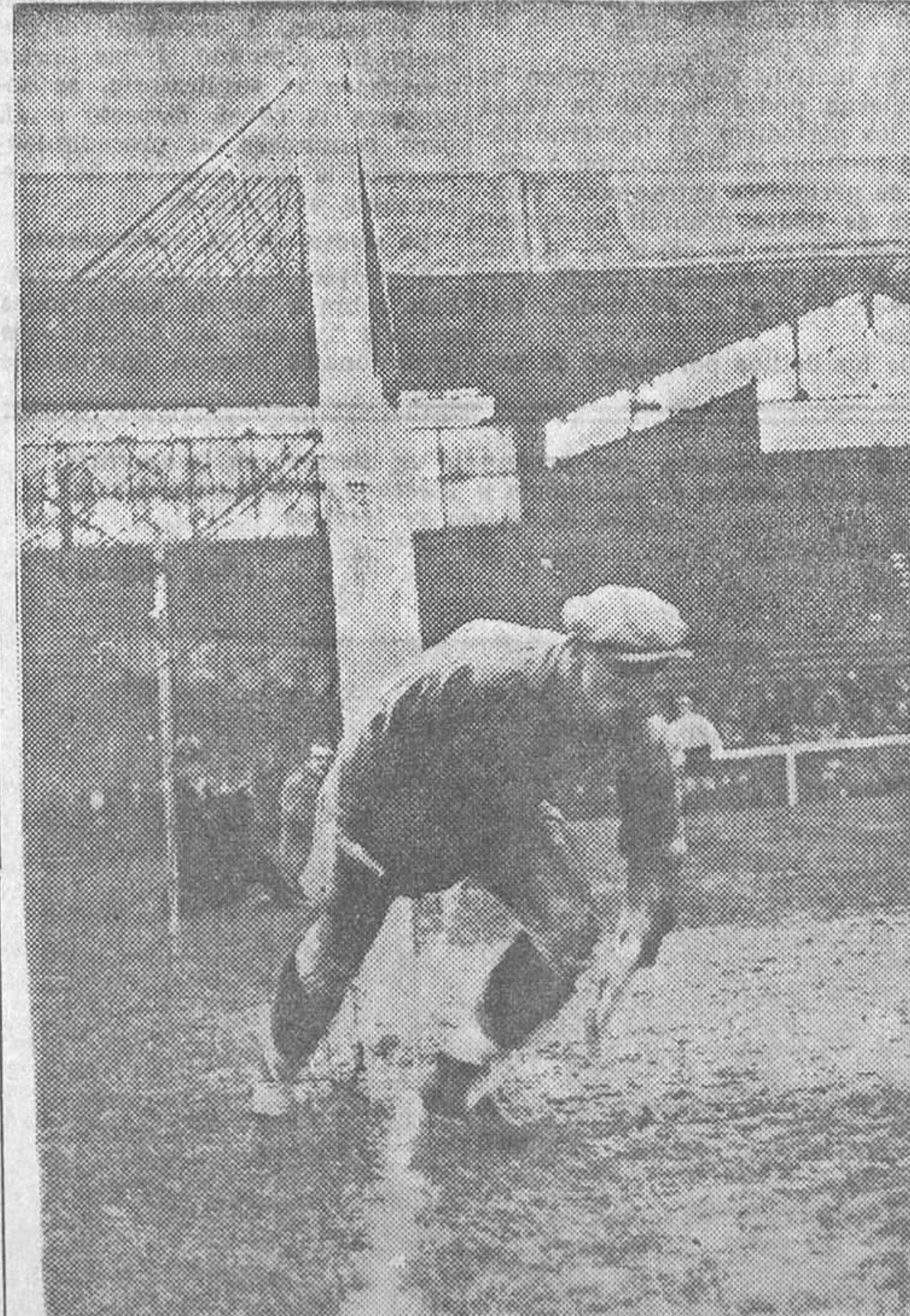
Thepot, portero del equipo francés, que hoy actuará en Chamartín, en una de sus características intervenciones

En la prueba principal reaparecerá «Leo's Fancy», que luchará contra los mejores galgos norteafricanos e ingleses.