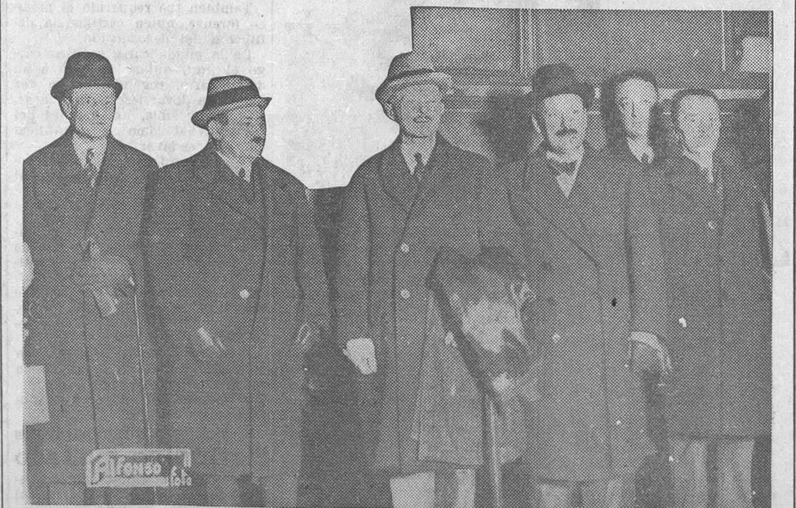
Llegada del general francés Weygand a Madrid, siendo recibido por el embajador de Francia y otras personalidades francesas

A consecuencia de esta decisión, se observa cierta resistencia en el Congreso. Todos los miembros republicanos, en efecto, estiman que la aplicación de créditos tan considerables pertenece únicamente al Congreso y no debía haberse dejado a la discreción del Gobierno.