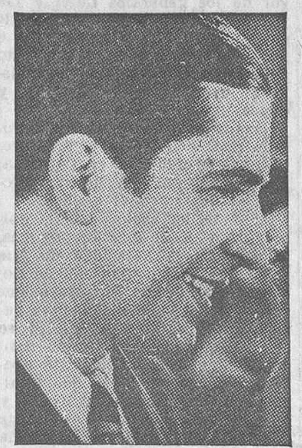
Carlos Gardel, protagonista de «Cuesta abajo», film Paramount en castellano que hoy se presentará en Fuencarral

porada, presentará hoy un gran film Paramount, que tiene una extraordinaria cualidad para nuestro público, y especialmente para el público popular: la intervención como protagonista del famoso cantador de tangos argentinos Carlos Gardel, ídolo de las multitudes. En «Cuesta abajo», a la técnica y la realización perfectas de la renombrada editora norteamericana se unen el interés de un asunto hispanoamericano, un diálogo