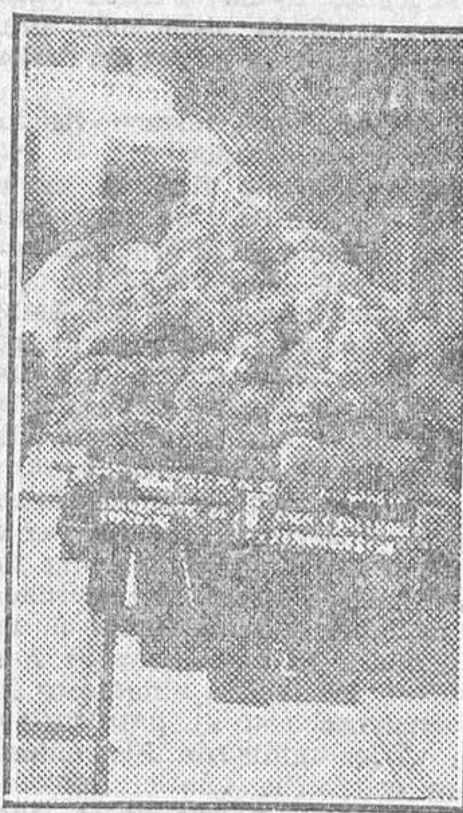
Transporte de esponjas por ferrocarril

espejos marinos. Aún no ha llegado el ciclón, rompiendo de un coleteo la espina dorsal del pueblo. Ajenas al escándalo de las coloradas de Isla de Pinos, que traen los vientos del Sur, las casas están, como las buenas mozas, inclinadas de pecho sobre el mar, el agua hasta la rodilla, pes-