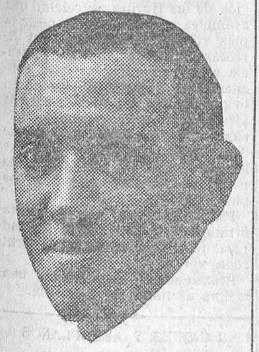
Ramón Pérez de Ayala