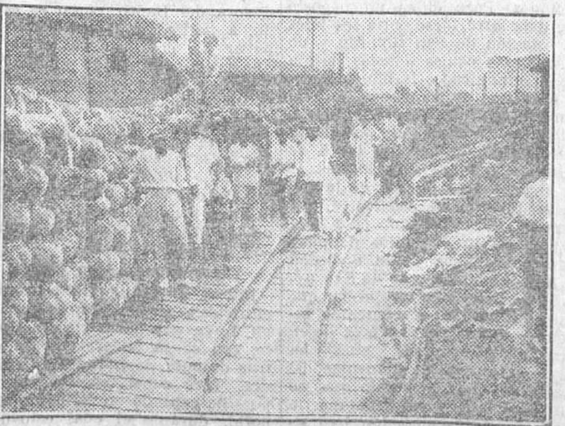
Mercancía de esponjas en el muelle de una estación de ferrocarril

La esponja es la riqueza del pueblo. Por ella, Batabanó es un pueblo rico, joven y esperanzado.