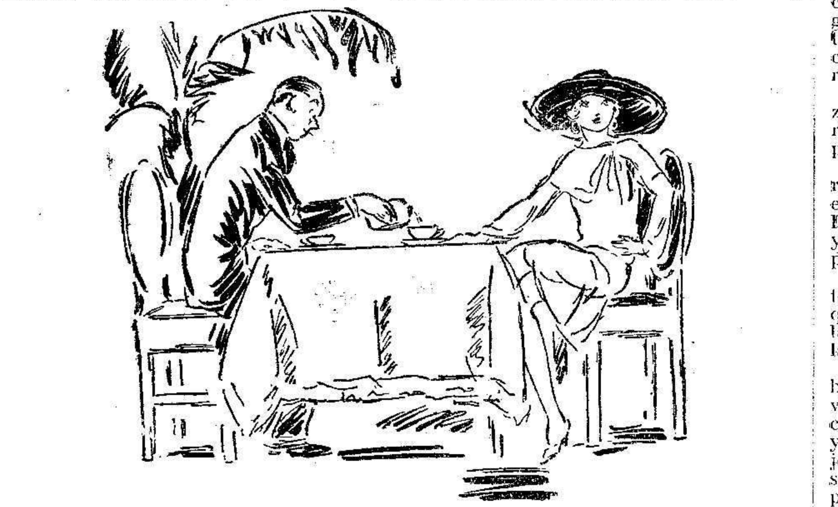
EL CALDO POR EL TE. ELLA.—Bebiendo esto, no se sabe si es caldo o té. EL.—Tómalo por té. El caldo vale tres pesetas más.