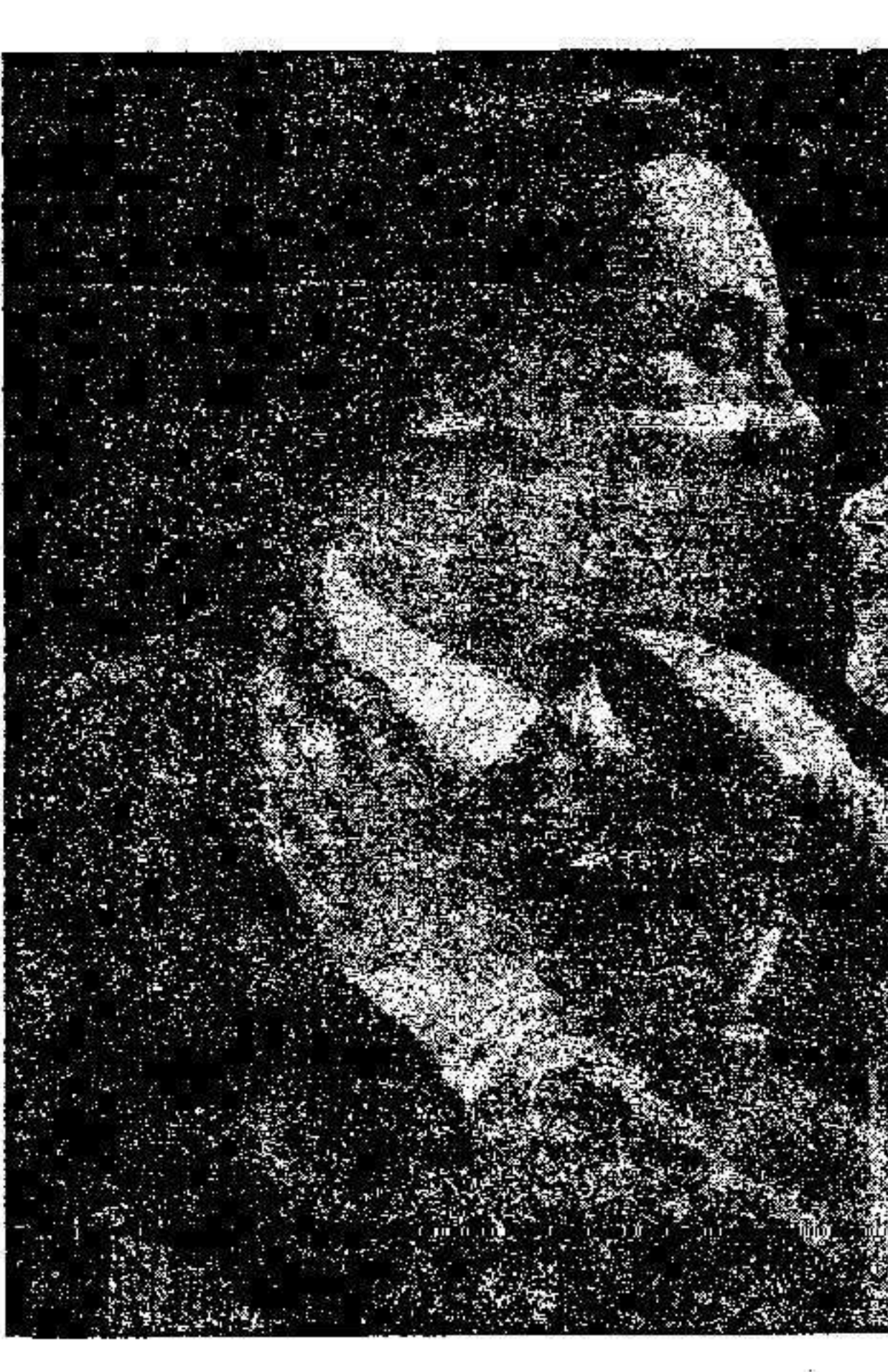
Marquesita, no. Te daré un beso Su Majestad la modistilla

Bailando, bailando se le había escapado el tacón de un zapato de Miguellina, yendo a parar a los pies del marqués.