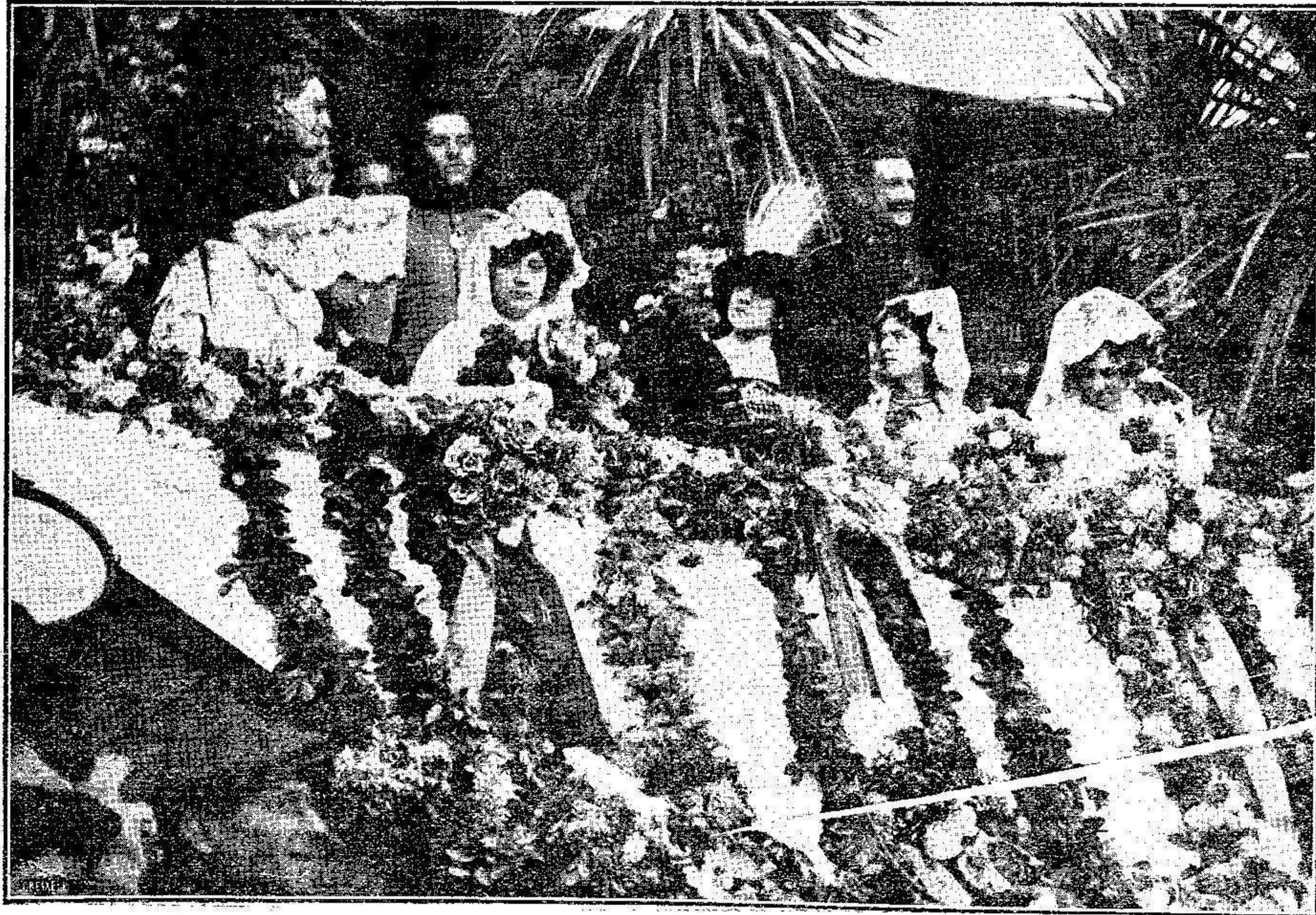
Presidencia de la corrida celebrada el domingo último en Zaragoza y cuyos fondos se destinan á dicho noble fin

tario de un testamento escrito ó dictado por el testador y los herederos (las personas llamadas por la ley, no los legatarios) tienen la alegación por verdadera, su dicho hará fé.