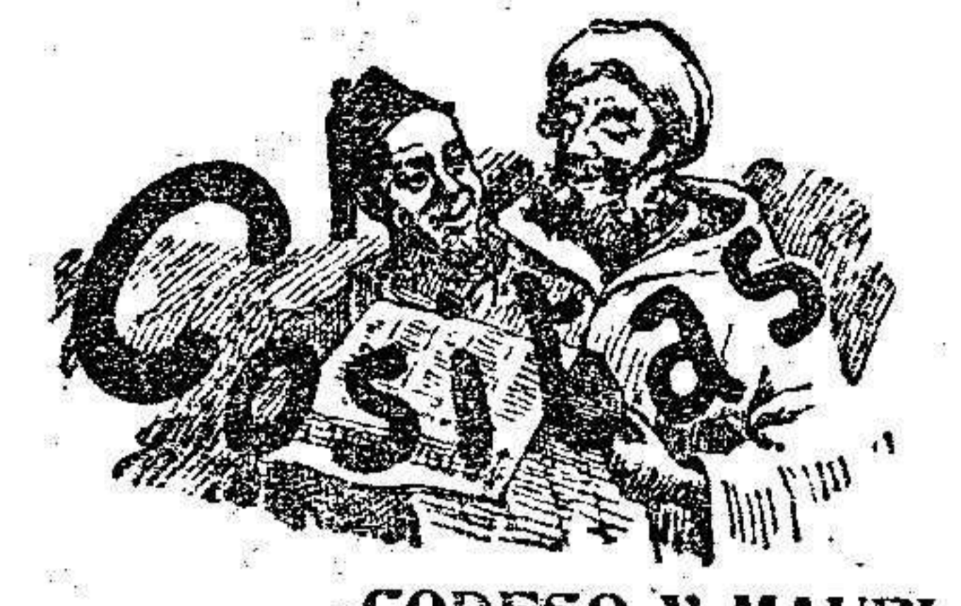
CODESO Y MAURI

Si queréis habas y avena, comprárlas en los TRANSPORTES GENERALES.