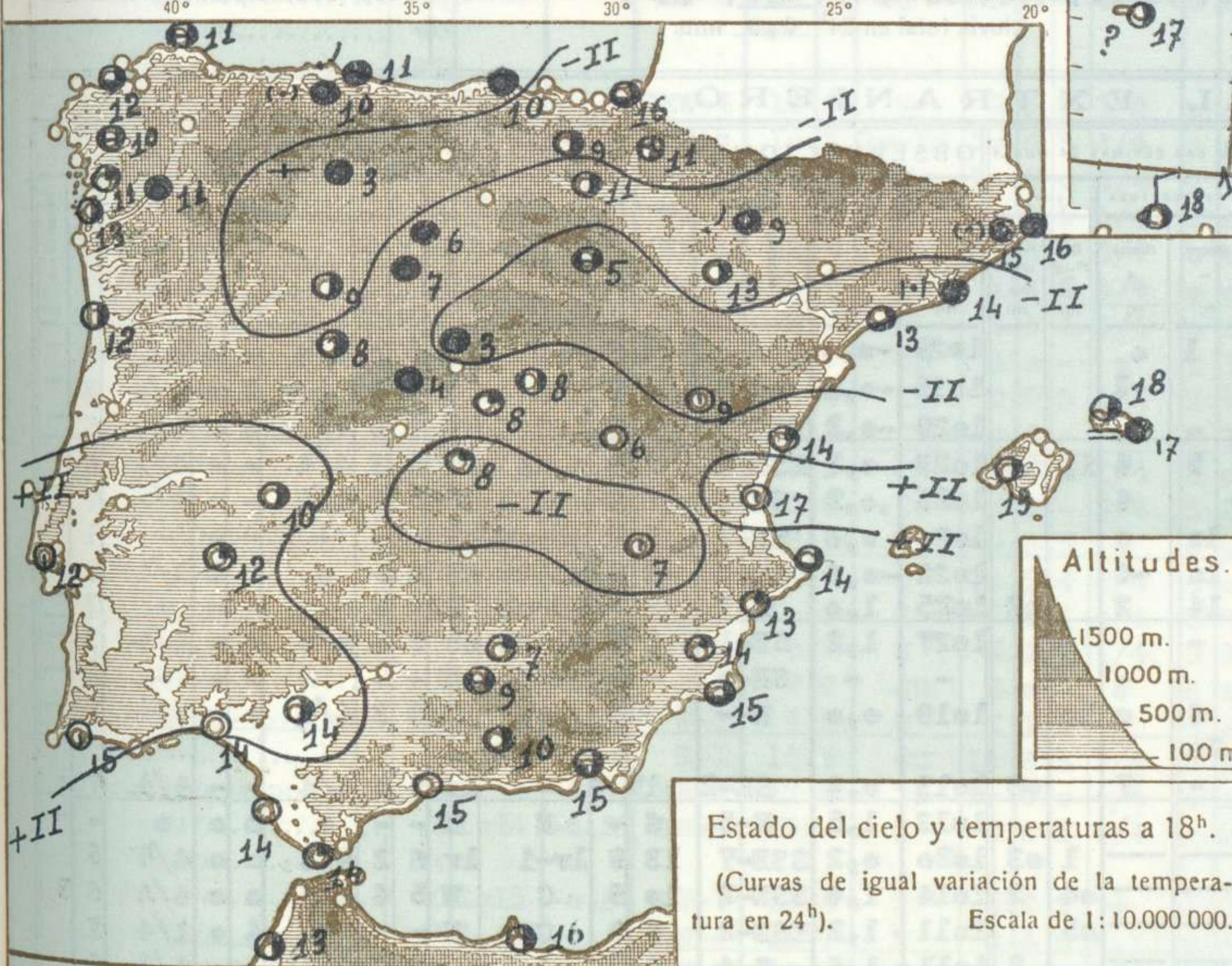
Estado del cielo y temperaturas a 18 h . (Curvas de igual variación de la temperatura en 24 h ). Escala de 1:10.000.000.