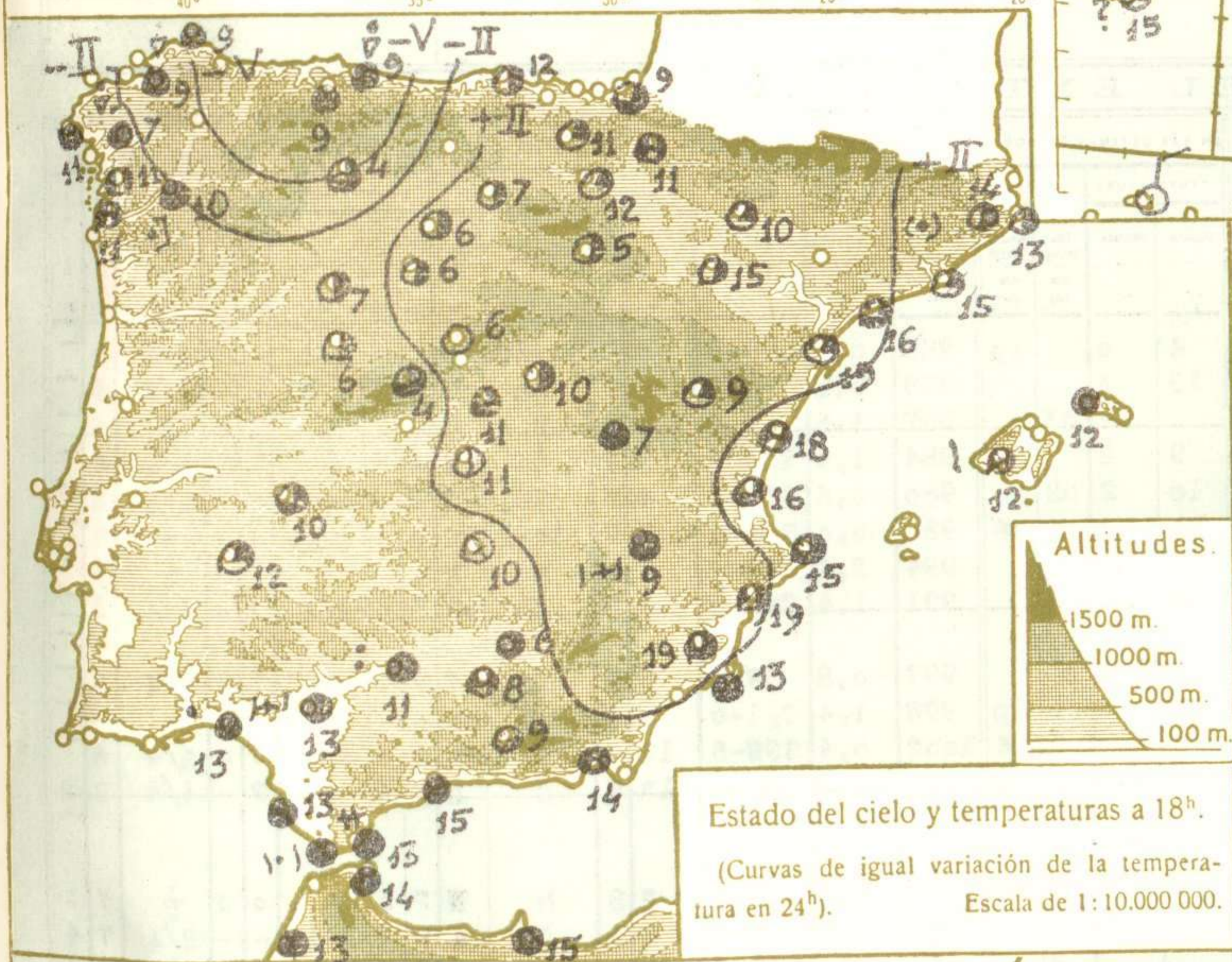
Estado del cielo y temperaturas a 18 h . (Curvas de igual variación de la temperatura en 24 h ). Escala de 1:10.000.000.