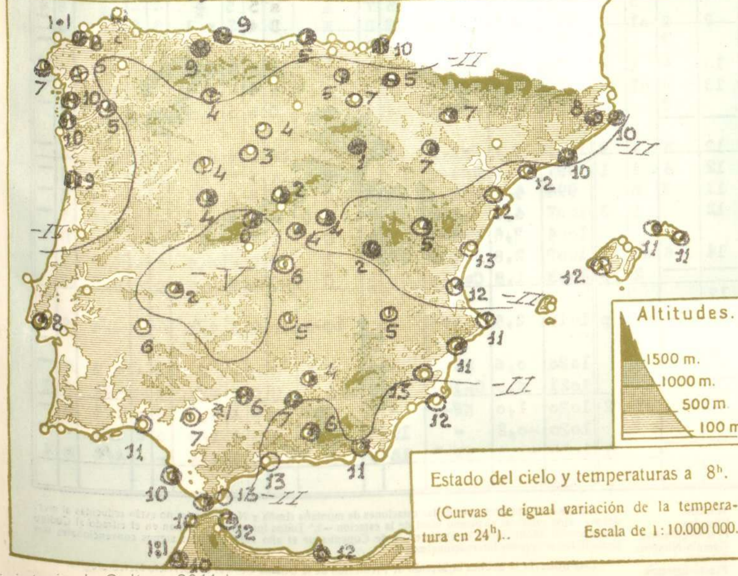
Estado del cielo y temperaturas a 8 h . (Curvas de igual variación de la temperatura en 24 h ). Escala de 1:10.000.000.