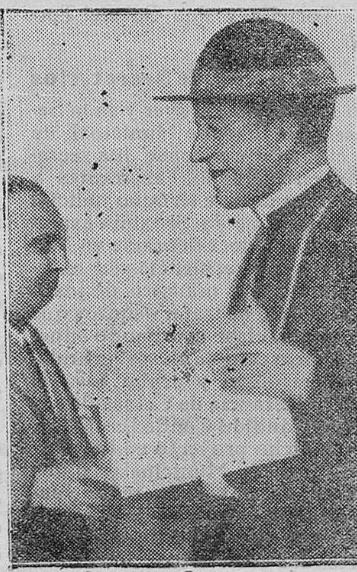
Monseñor Tedeschini, al salir de la reunión celebrada en el Ministerio de Estado con motivo de la reclamación presentada al Vaticano

Mahón 5 de Septiembre de 1931. —El Alcalde, Pedro Pons Sitges.