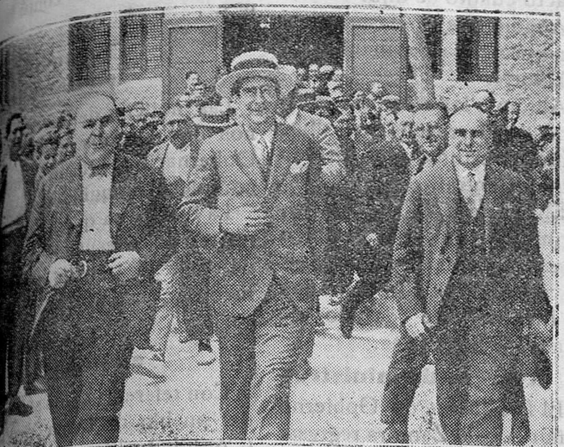
Marcelino Domingo al salir del Ateneo de Igualada donde pronunció un discurso con motivo de las bodas de oro de dicha Sociedad