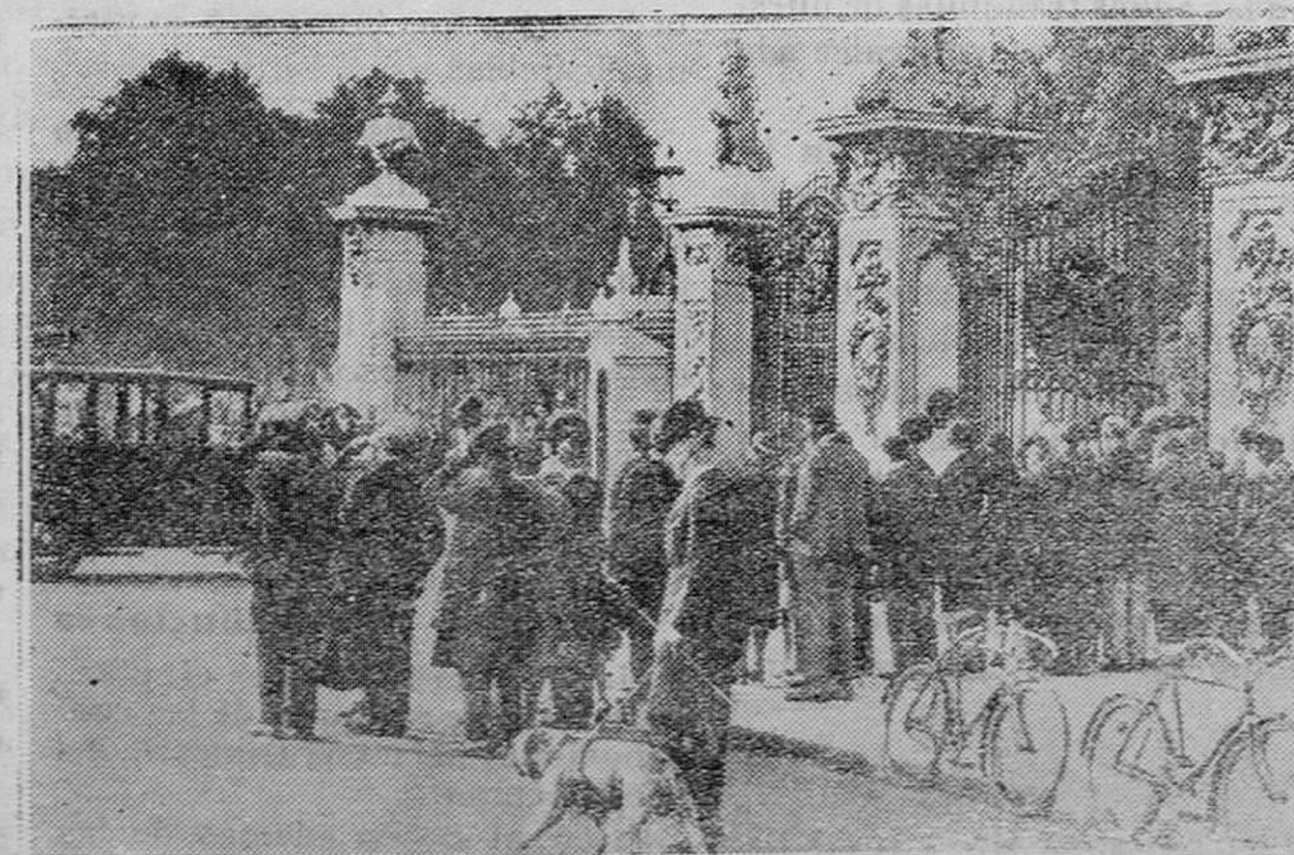
INGLATERRA. — De la crisis inglesa. — Los miembros del Gobierno presidido por Mr. MacDonald, a su llegada al palacio de Buckingham para presentar al Rey de Inglaterra la dimisión colectiva del Gabinete