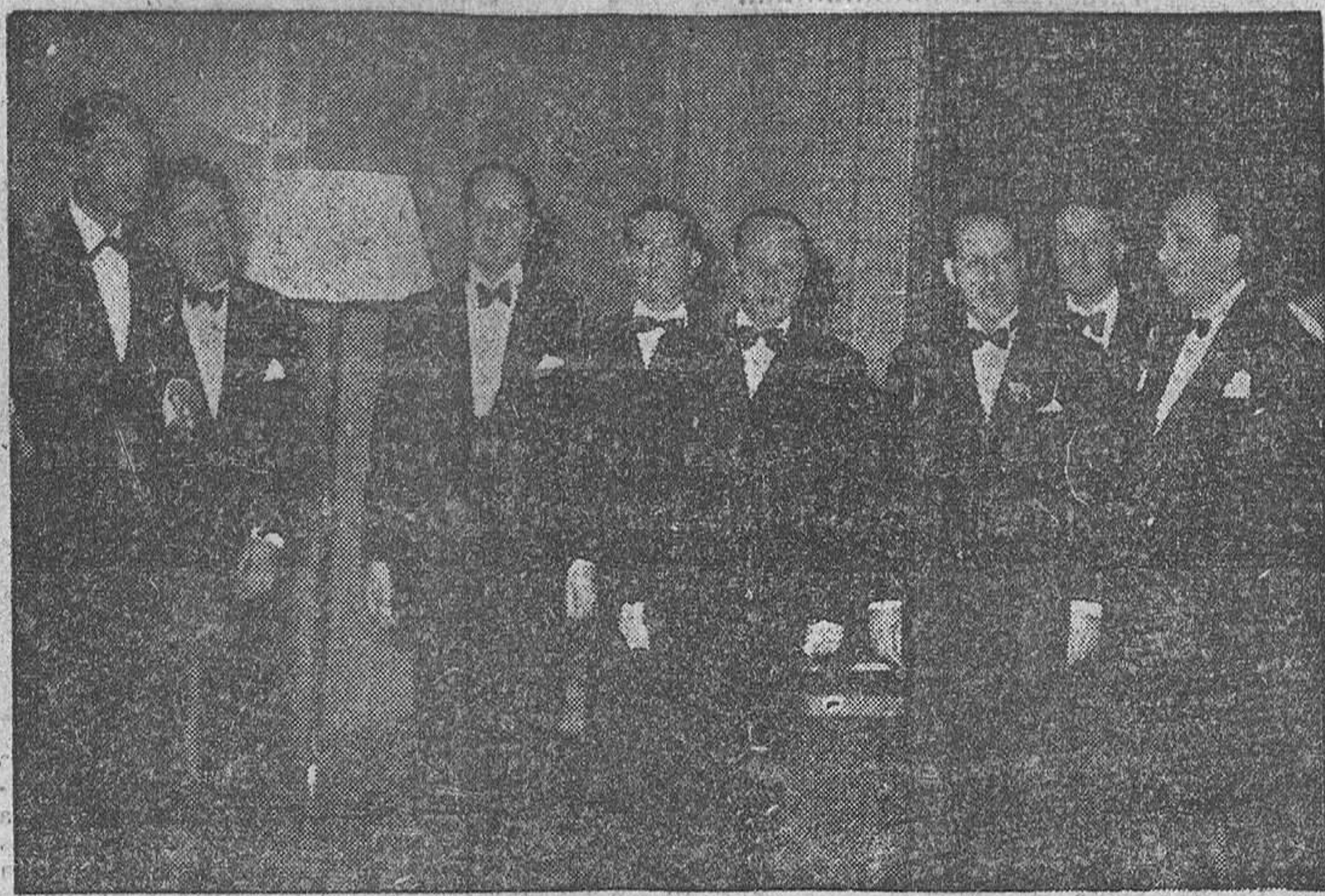
MADRID.— Los ministros Secretario General del Partido y el de Información en el acto de la entrega de los Premios Nacionales de Periodismo y Literatura de la Secretaría General del Movimiento. Los ministros con los cinco galardonados.— (Foto Contreras.)