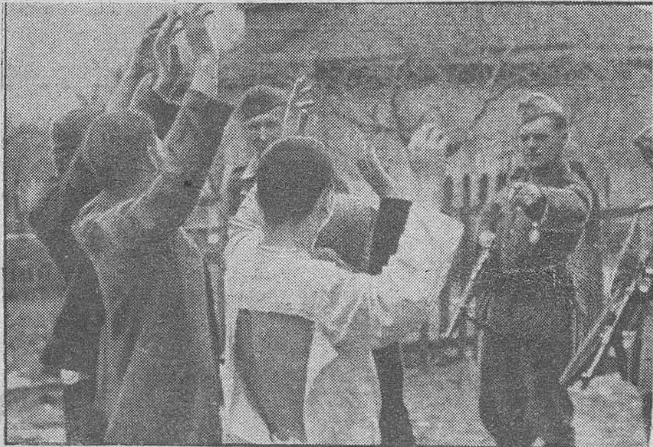
Individuos sospechosos detenidos e internados por una patrulla alemana en los sectores soviéticos liberados.