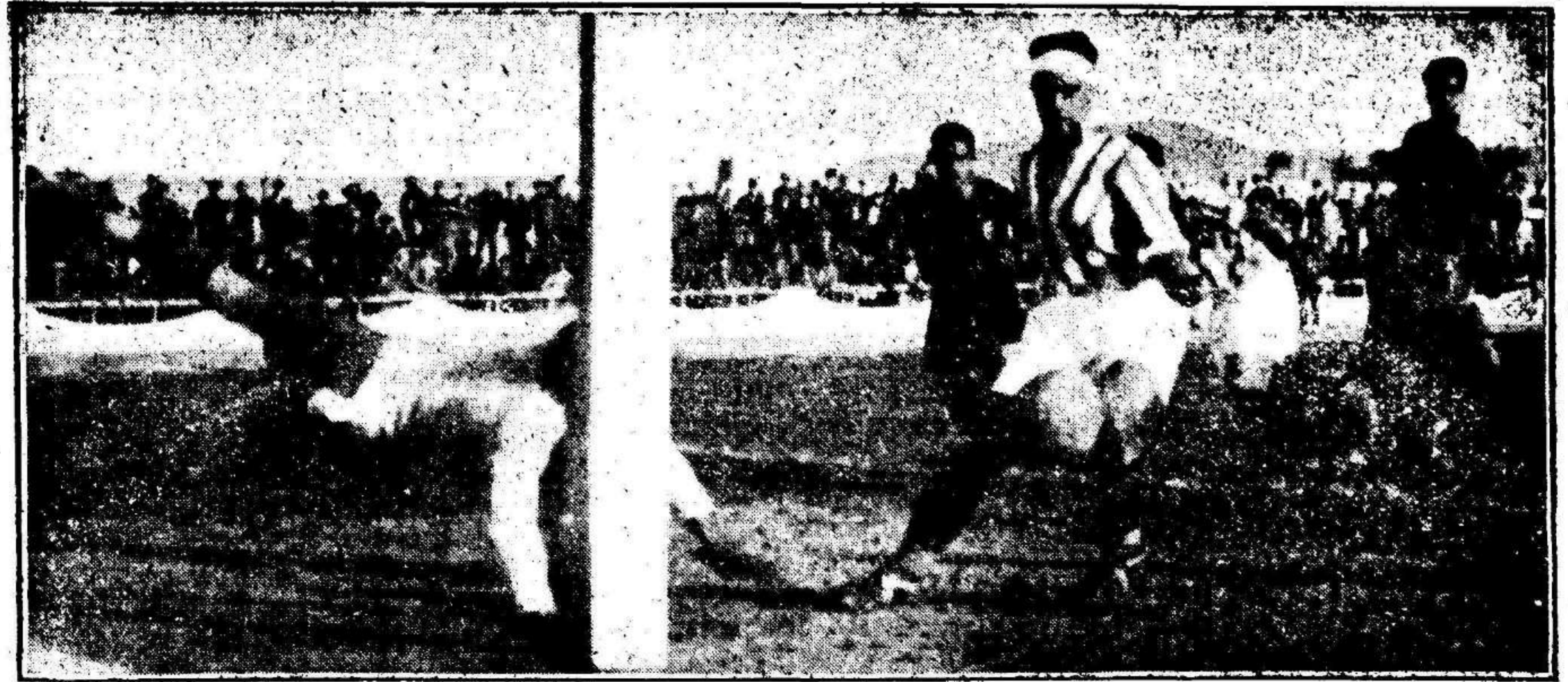
El portero bético desviando a corner un fuerte tiro de Sans.—(Foto Arenas)

Los medios alas murcianos que están desconocidos; los extremos sevillanos juegan a placer.