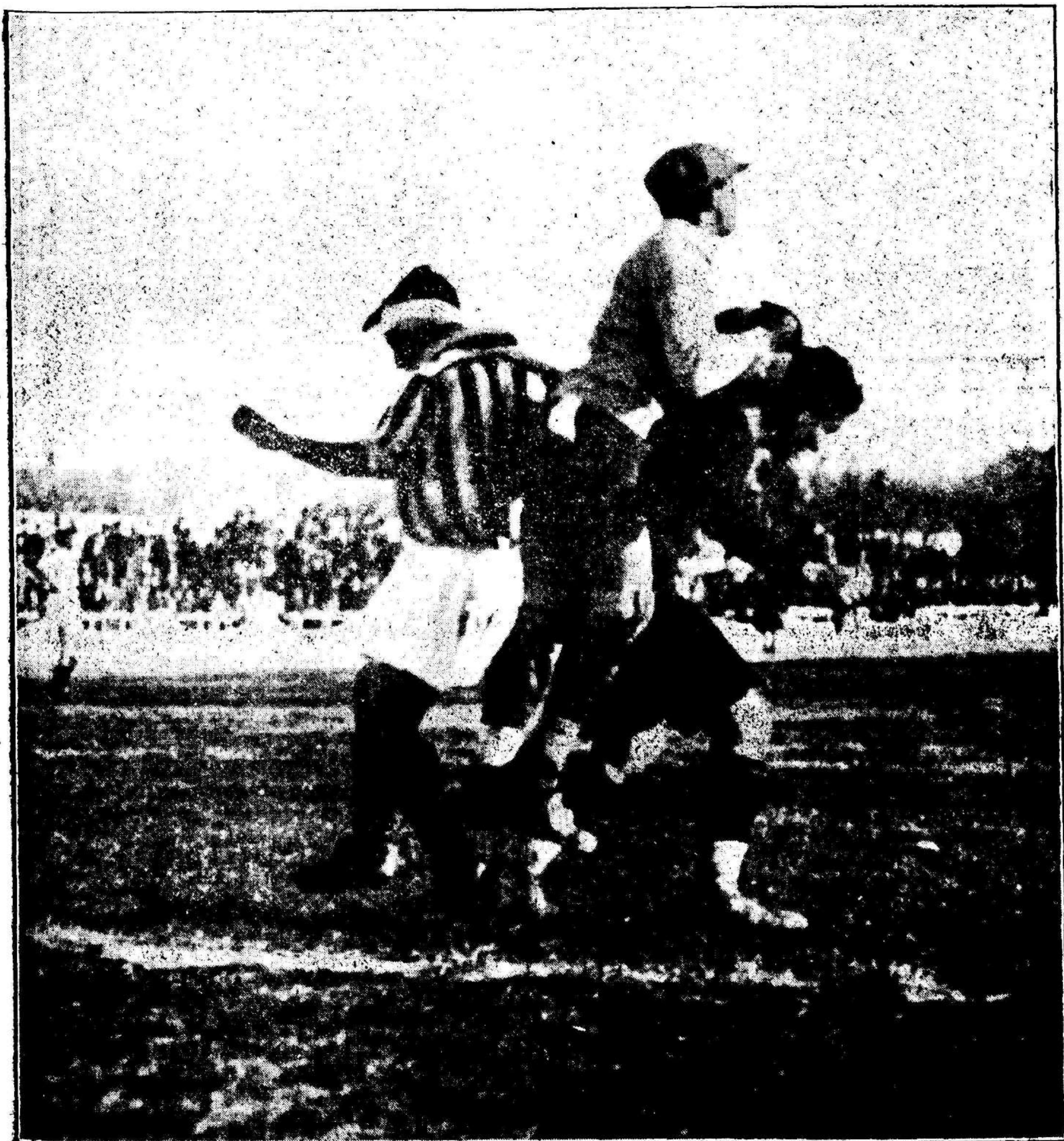
Pedrosa, el guardameta sevillano, salvando una situación de peligro ante la delantera roja.—(Foto Arenas).