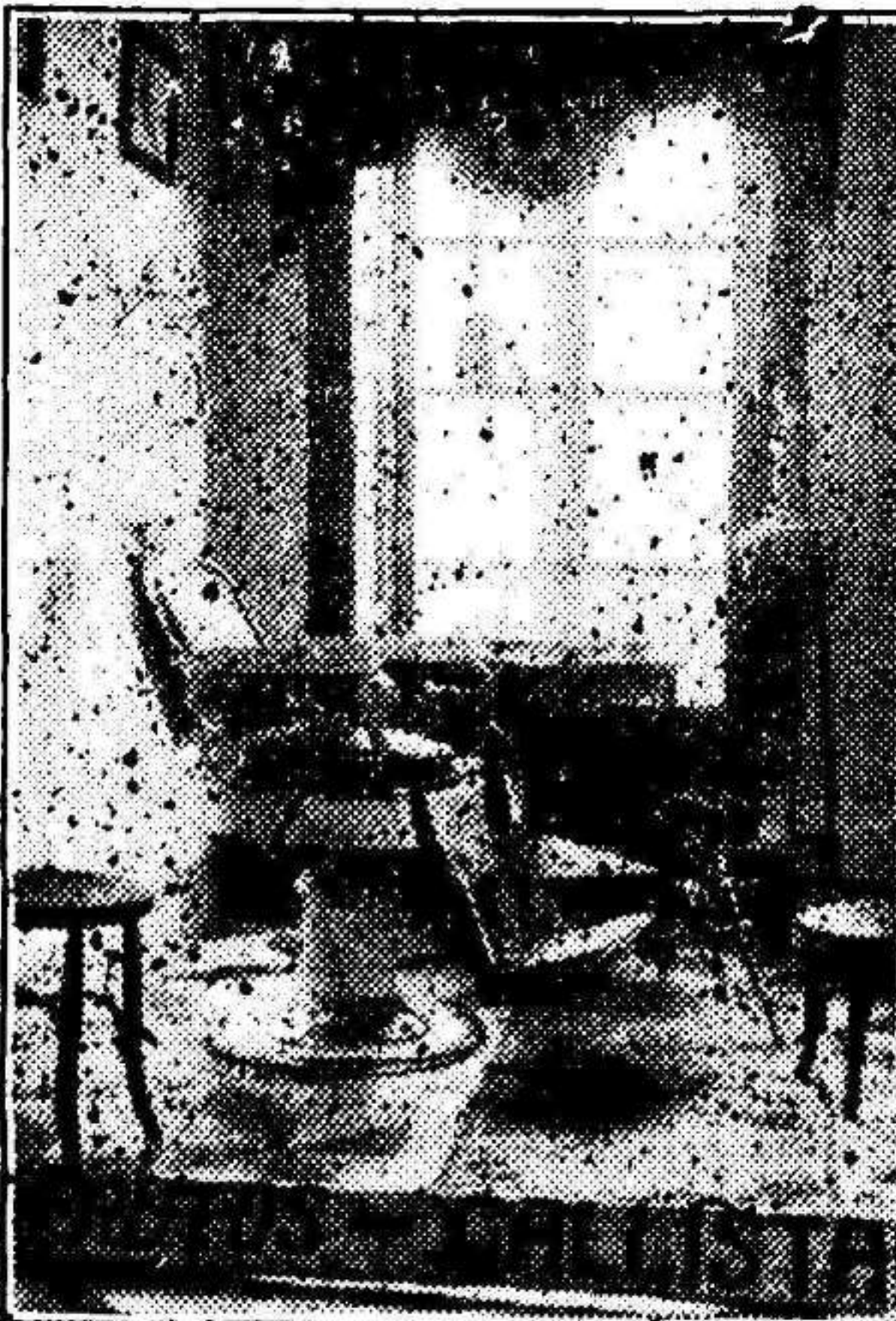
PLAZA SANTA ISABEL, 2.—MURCIA