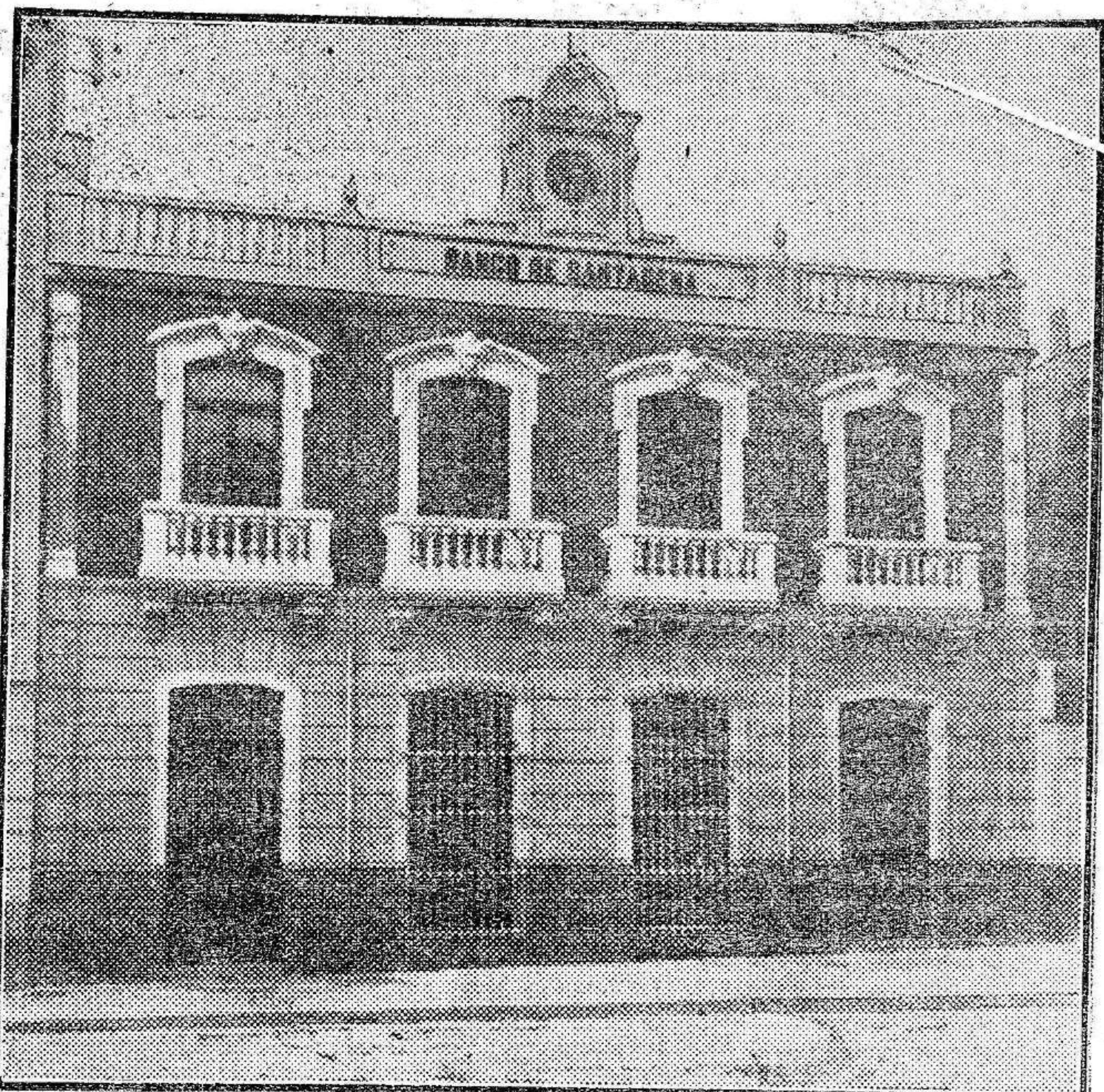
La casa del Banco de Cartagena