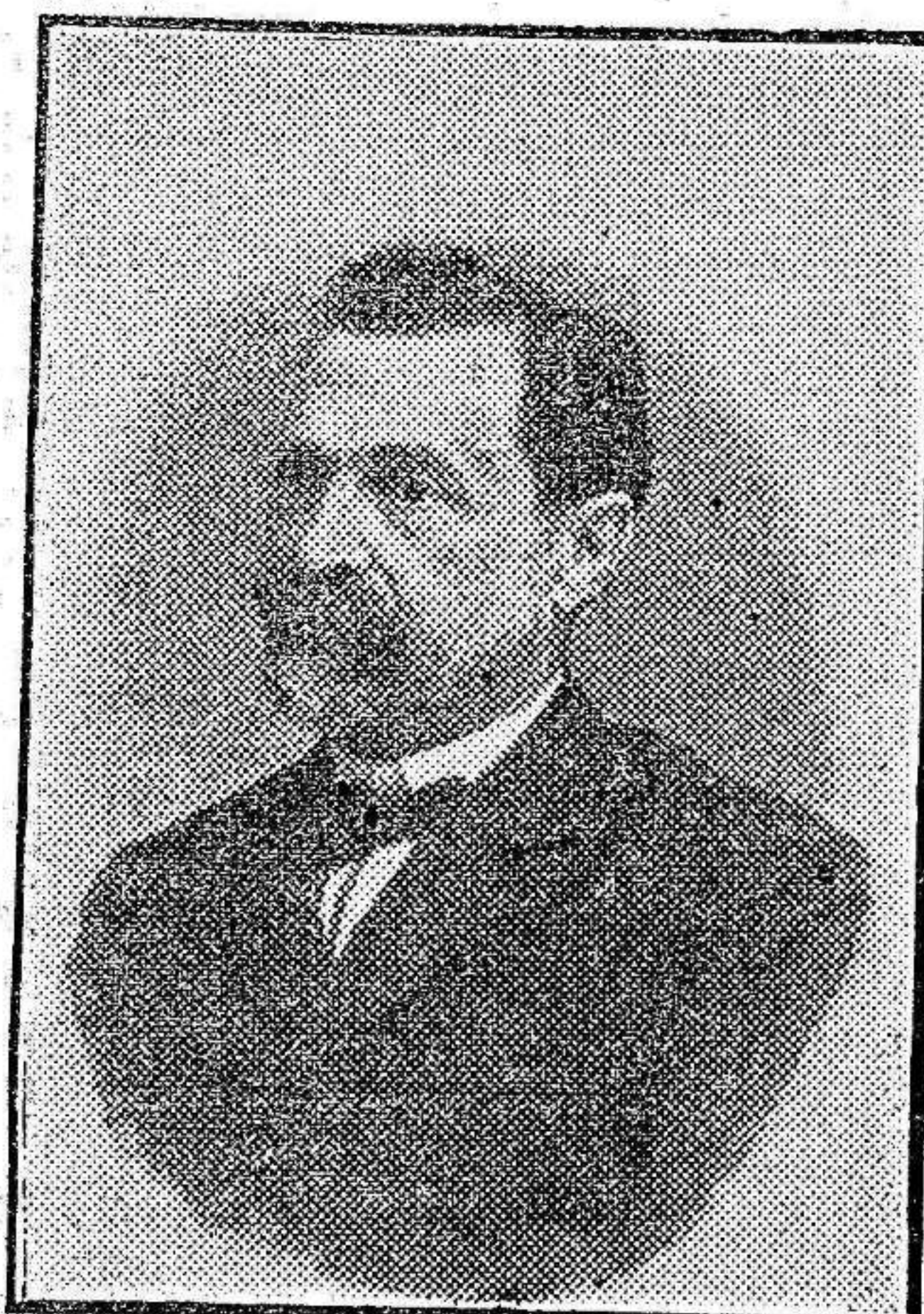
DON JOSÉ FERRERA ALCALDE DE ORIHUELA