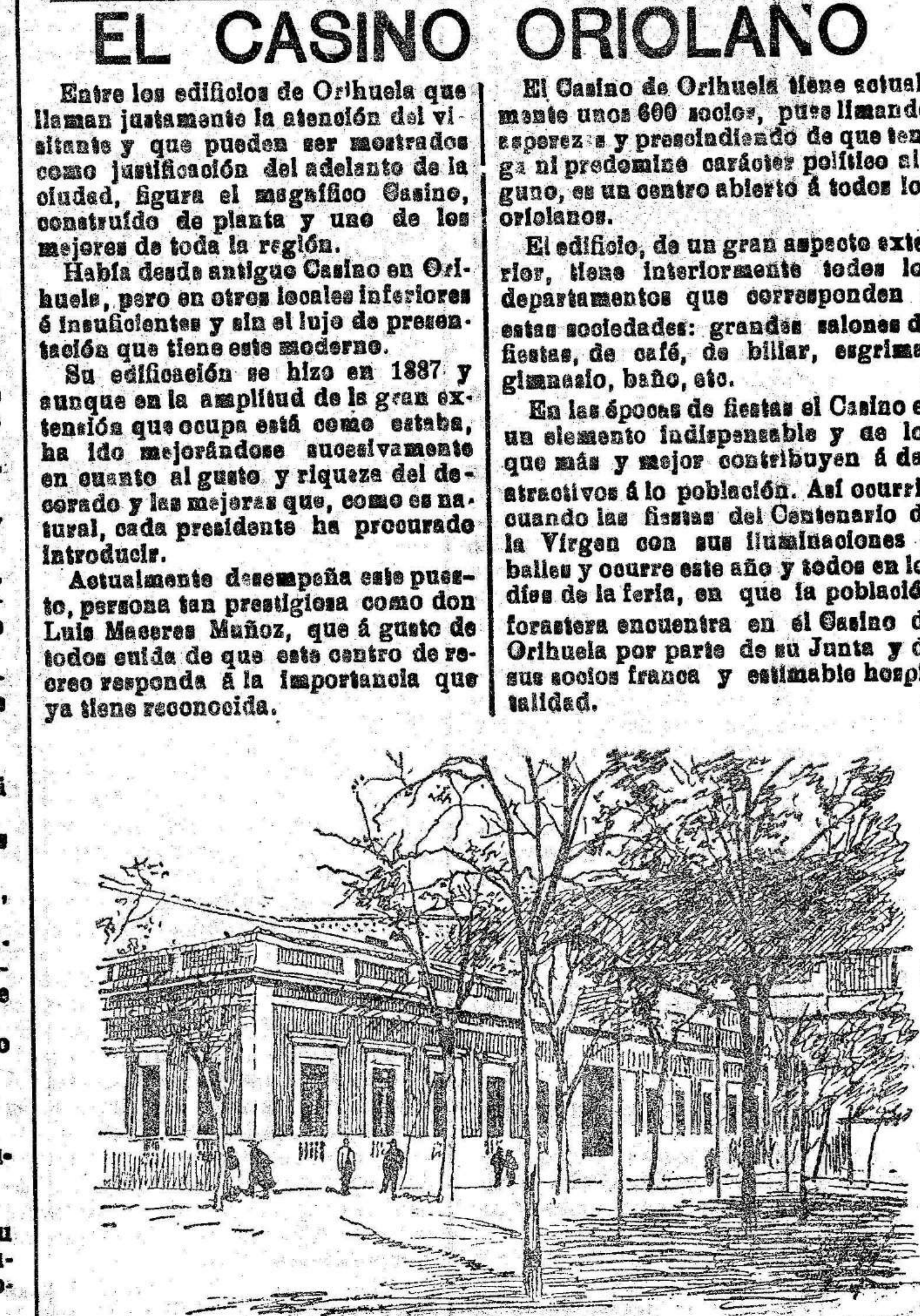
Apunte del Casino