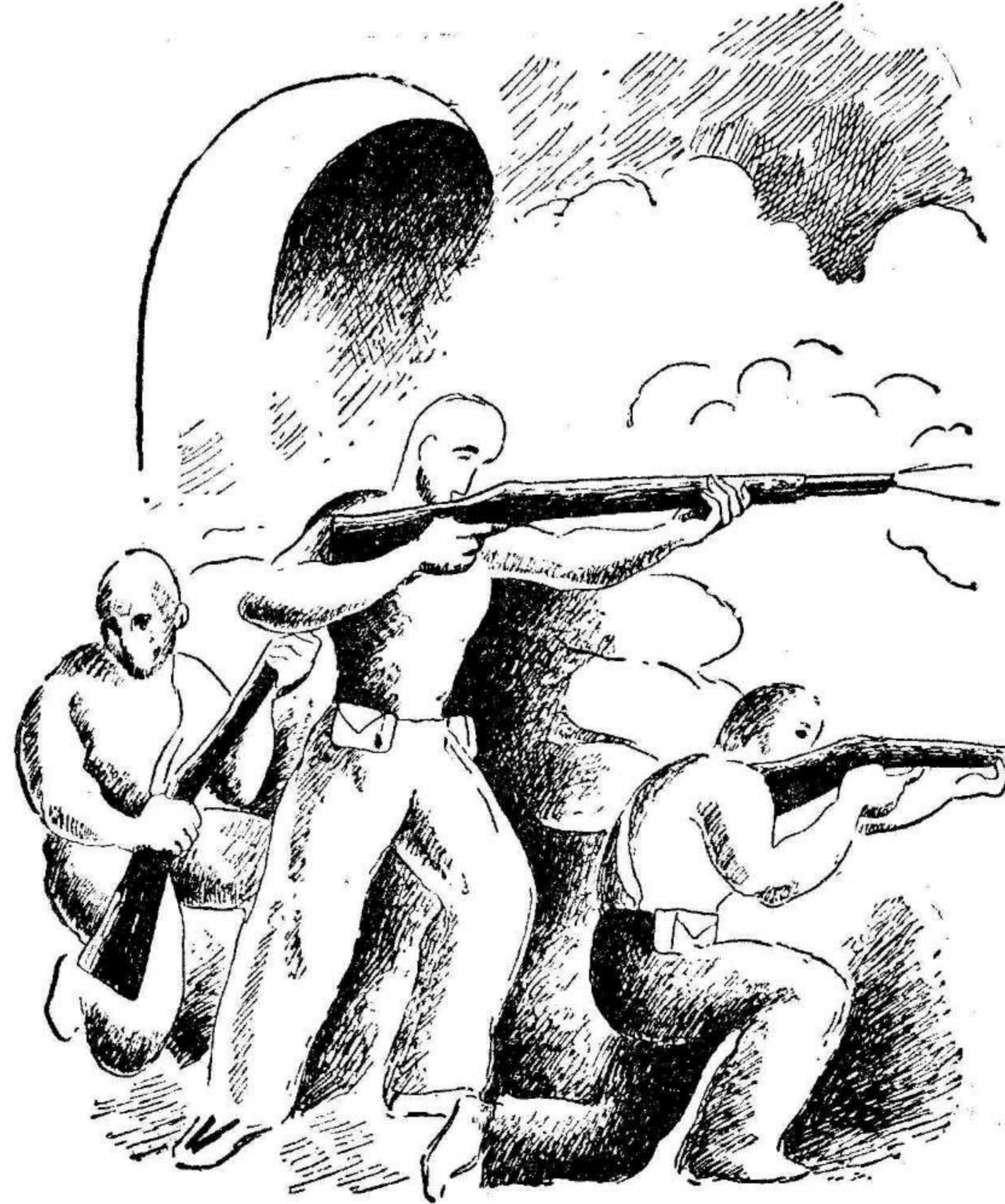
TRAS LAS ALEGRES CHANZAS EN EL CUARTEL, DURA PELEA EN LOS FRENTES; ASI SE HA FORJADO Y ES NUESTRO GLORIOSO EJERCITO.