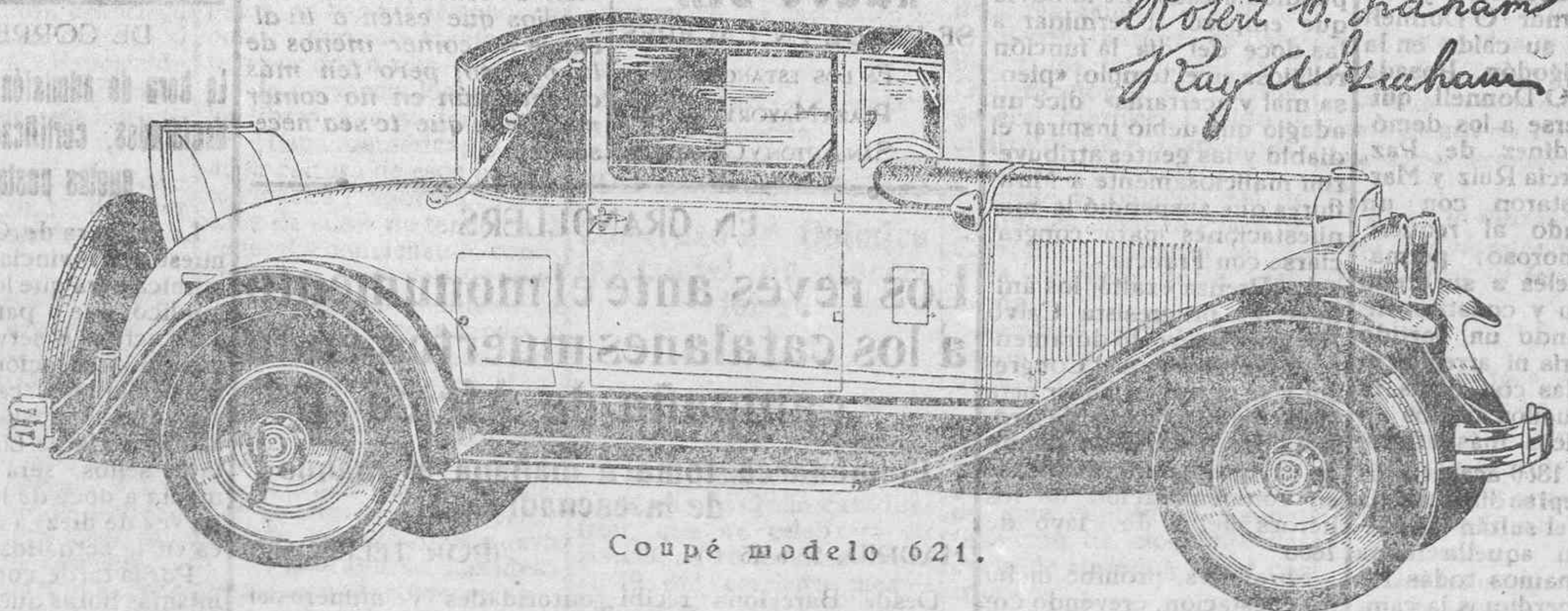
Coupé modelo 621.