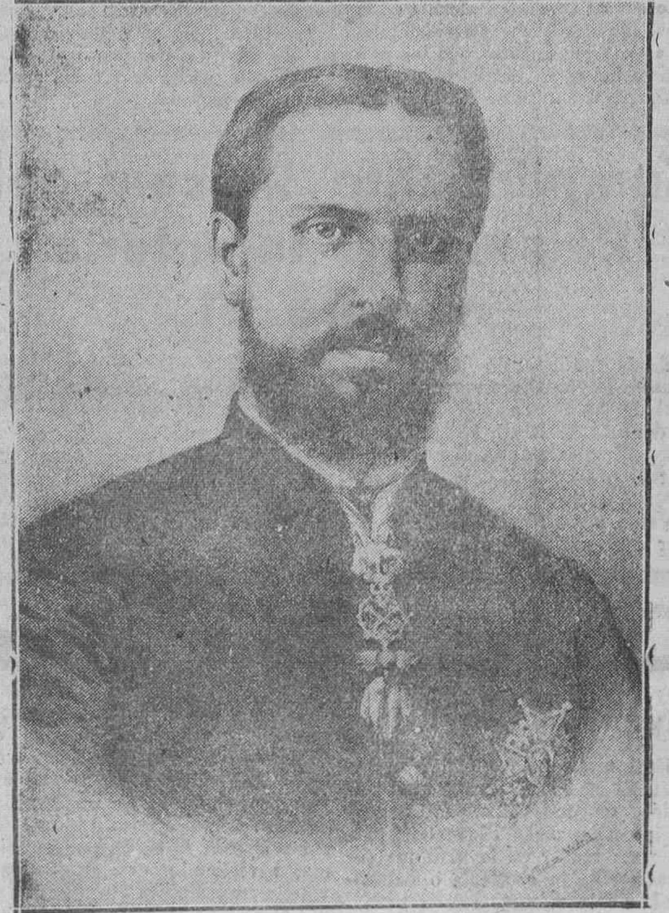
EL REY D. CARLOS VII, QUE INSTITUYO LA FIESTA DE LOS MARTIRES DE LA TRADICION FIESTA EN LA QUE EL GENERALISIMO FRANCO NOMBRÓ TENIENTES HONORARIOS DEL EJERCITO ESPAÑOL A LOS FIELES SOLDADOS DE DON CARLOS.

Inglaterra adoptará la misma decisión con respecto a otros países pero la nación más afectada por esta disposición es Bélgica. Se cree que con este motivo Alemania aumentará la exportación de carbón a Bélgica.—DNB.