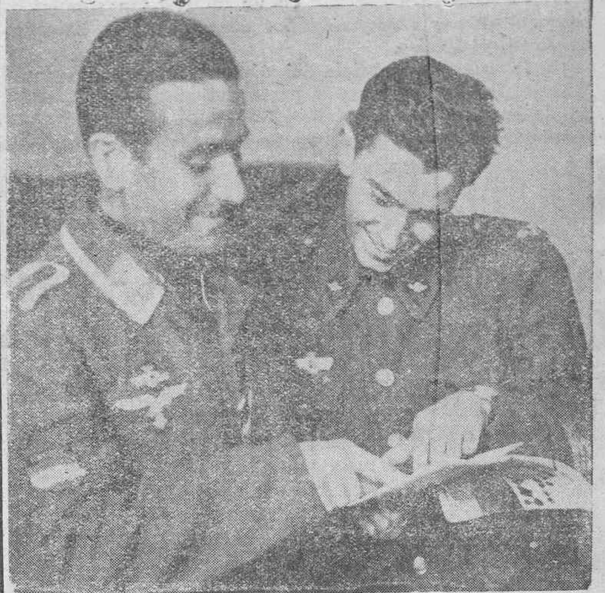
Estos dos voluntarios de la aviación española, el de la izquierda ya con uniforme alemán, aprenden con regocijo algunas indicaciones sobre la lengua alemana para "manejarse" con sus camaradas alemanes.