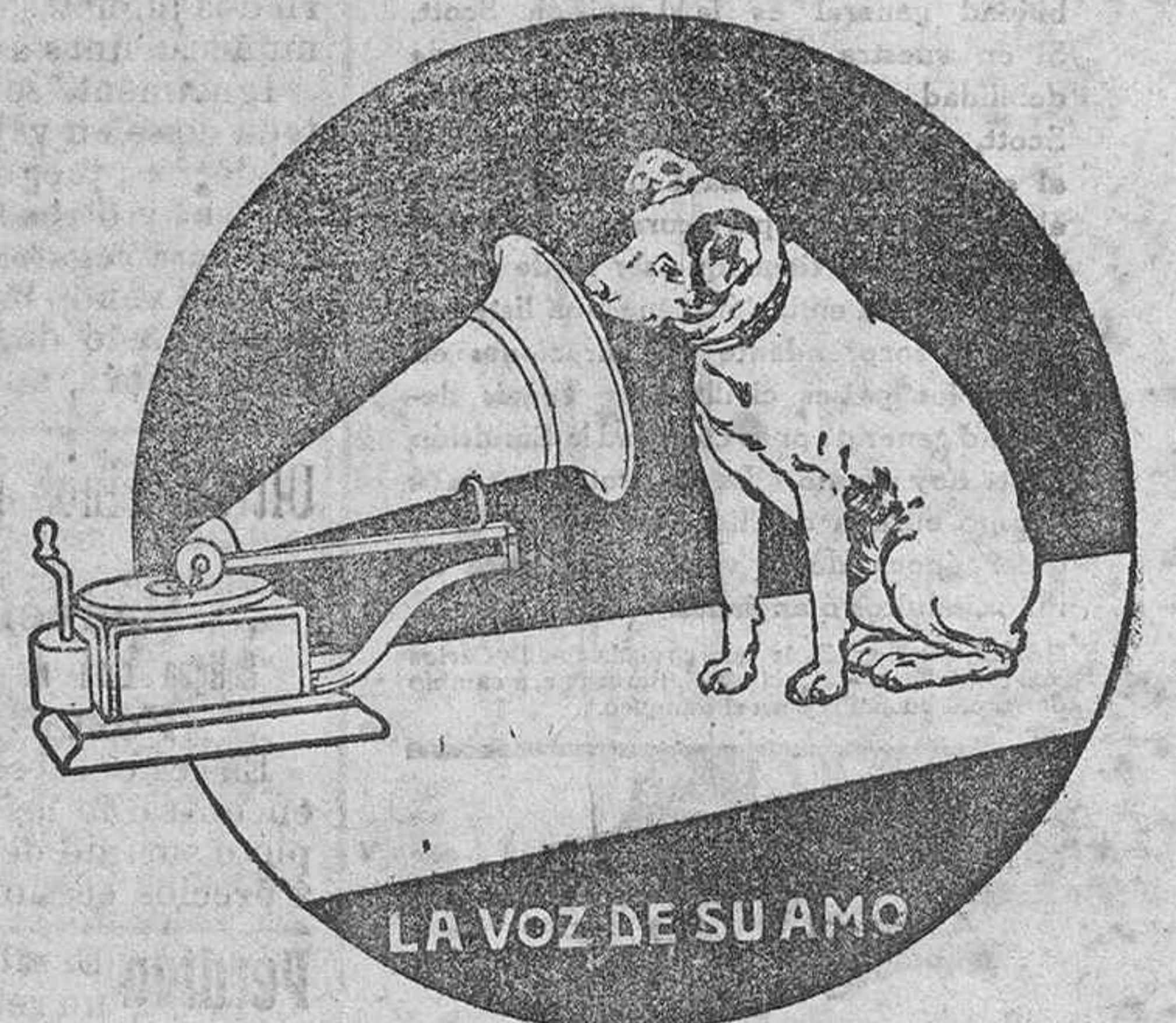
LA VOZ DE SU AMO

EXIGID y buscad en todos los aparatos y discos «GRAMOPHONE» nuestra célebre marca de fábrica «LA VOZ DE SU AMO» y la palabra «GRAMOPHONE» que únicamente nosotros podemos usar por ser de nuestra propiedad exclusiva, y sin cuyos requisitos no adquiriréis un legítimo «GRAMOPHONE».