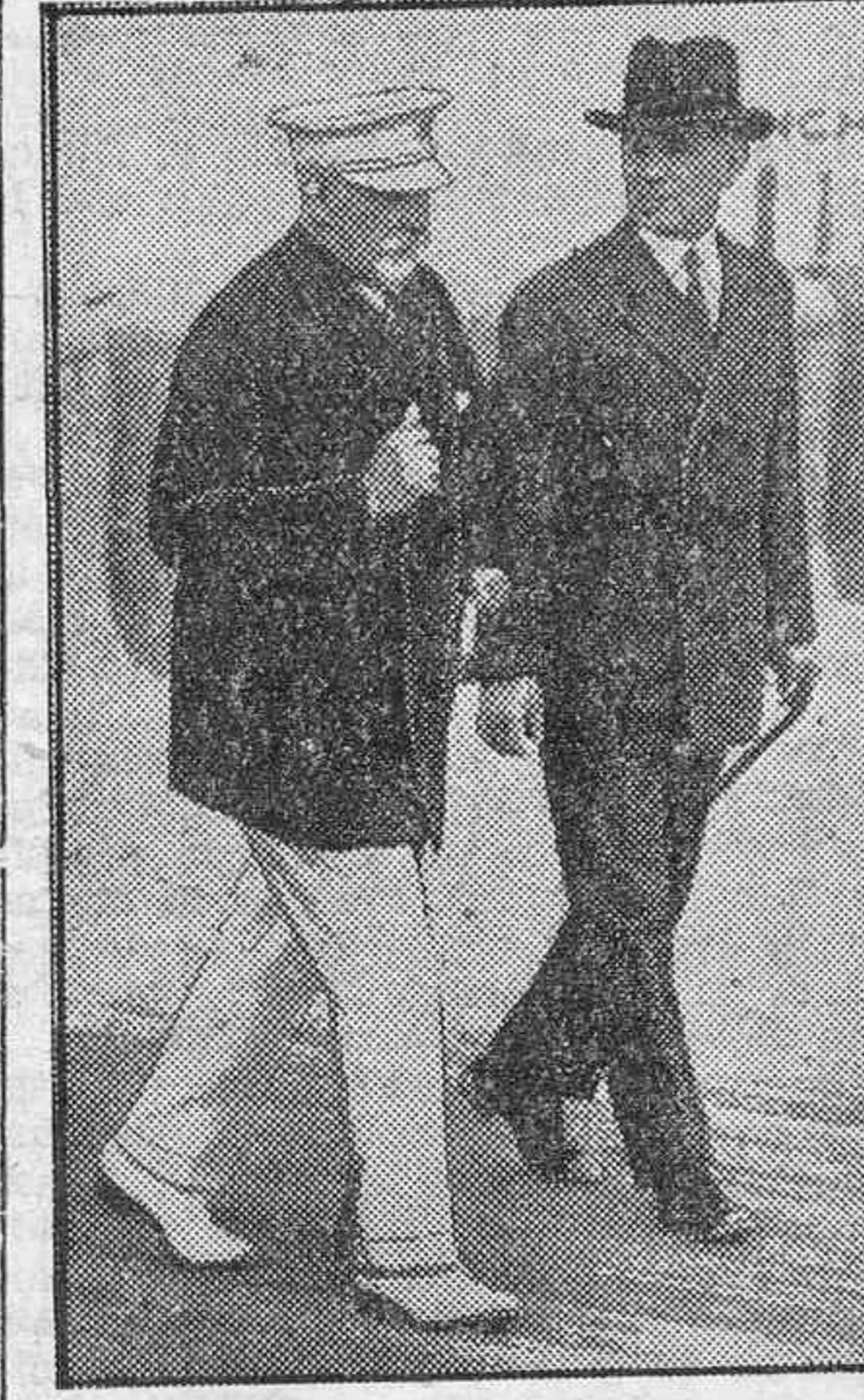
El ex-kaiser Guillermo de Alemania, que según noticias de París se halla enfermo de extrema gravedad en su residencia de Doorn (Holanda)

des maniobras del Ejército norteamericano, frente a Hawai, un gran avión de bombardeo, llevando siete tripulantes, se precipitó en el Pacífico.