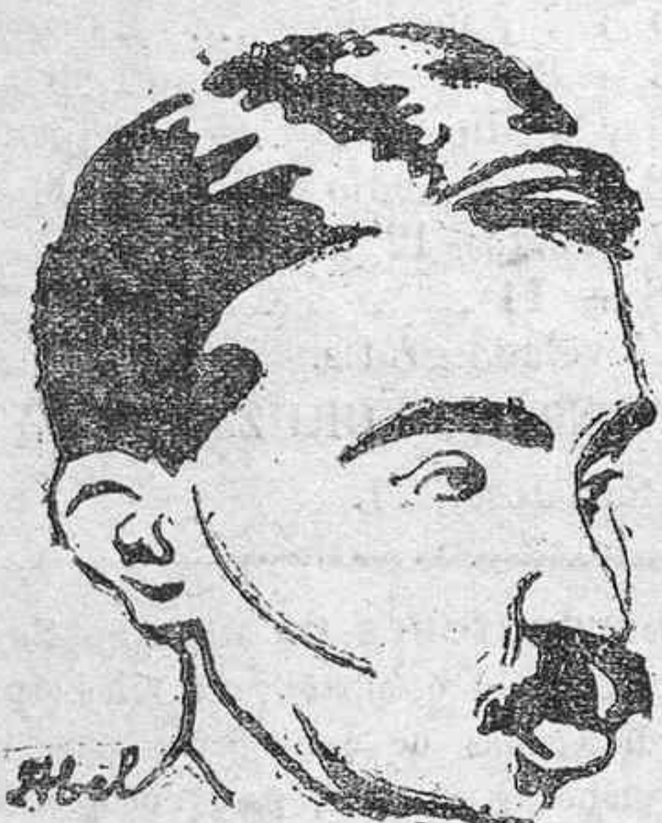
Gandhi, el famoso caudillo indio, que se desposó a los ocho años.

PLUMAS STILOGRAFICAS de Waterman's Swan and Lufkol, las mejores marcas.—Librería Curbelo La Laguna.