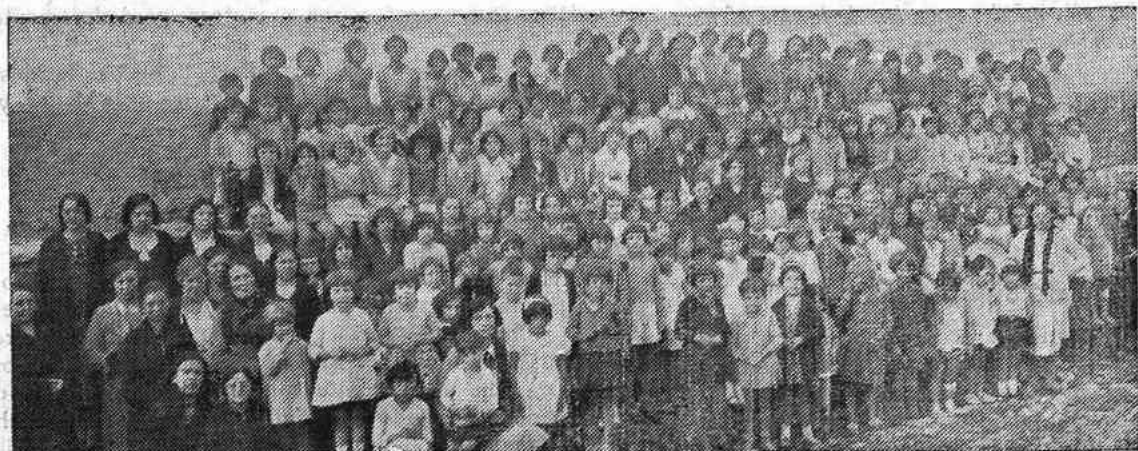
Grupo de niñas que asisten a la catequesis.