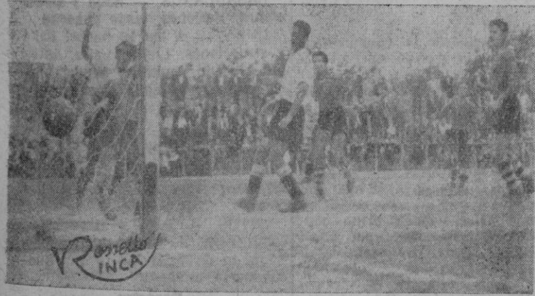
El primer gol obtenido por el Constancia

El Constancia ha conseguido su primera victoria en la presente temporada. Y aun que el triunfo haya sido sobre el Cieza, la alegría de sus partidarios fue mayúscula ya que la misma tuvo que conseguirse a pulso y tras noventa minutos de brega. La tabla clasificatoria no contaba en la tarde del domingo: el Cieza, aunque figurara en mejor posición que el Constancia, debía ser vencido con facilidad. Así al menos lo pregonaban los comentarios de los inquenses antes del partido. No obstante, desde el primer momento, se pudo comprobar que para vencerlo claramente sería necesario luchar sin desmayo, ya que a pesar del constante dominio de los inquenses, el balón se resistía a entrar en la meta contraria. El encuentro no tuvo más que una sola cara y esta fue siempre favorable al Constancia. El tres-