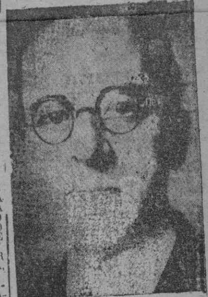
Londres, 28. — Sir Stafford Cripps ha negado en la Cámara de los Comunes que los Estados Unidos hayan ejercido presión sobre él para una posible desvalorización de la libra.

RADIO BUDAPEST AL CITAR UNA INFORMACION FRANCESA, DIO ESTA NOTICIA ANOCHE. LOS PERIODICOS COMUNISTAS ITALIANOS HAN COMENZADO UNA CAMPAÑA CONTRA EL GOBIERNO POR ESTE PRETENDIDO ACUERDO. — Efe.