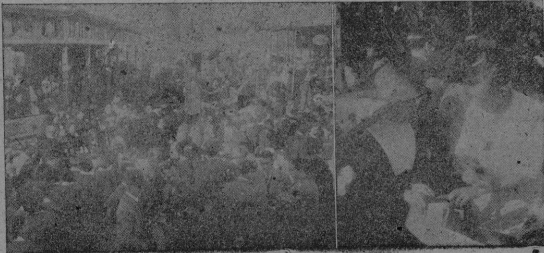
Dos aspectos del acto de inauguración de la Feria de Ramos celebrado ayer tarde

Douglas A. Hyde tiene, al parecer, el propósito de ingresar en el seno de la iglesia católica. — Efe.