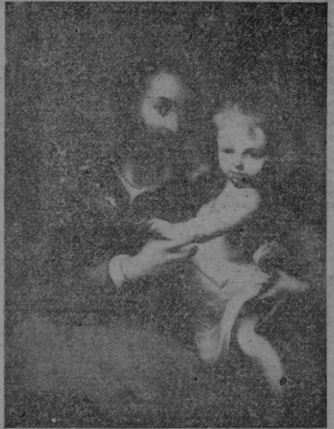
San José. Quadro que antiguamente era llevado a la Catedral para ser venerado durante los días de la Novena y Octava de San José, antes de construir la actual capilla

Las armas son de fabricación extranjera y tienen berradas las marcas. — Efe.