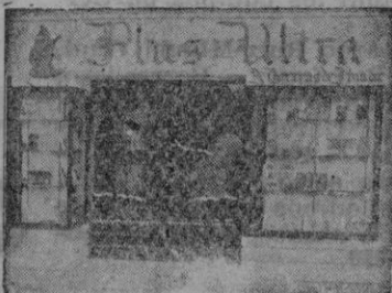
Plaza Sta. Catalina, Tomás, 10 Palma de Mallorca

Después de haber descargado una gruesa partida de mercancía general salió para Barcelona el vapor de la Compañía Ibarra "Cabo Huertas".