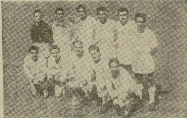
Equipo del Real Madrid, que hoy contendrá con el Manchester en el terreno de este último

La atención de los jugadores ingleses se centra, principalmente, en la potente línea de ataque del Real Madrid, que se calcula que ha costado casi veinte millones de pesetas al cambio normal. El encuentro será presenciado por cerca de 75.000 personas, aparte del millón y medio de aficionados que, ante las pantallas de televisión, seguirán todos los incidentes del encuentro, considerado como el más importante en Manchester.