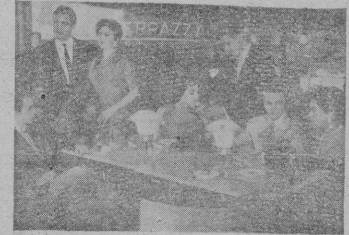
Una animada escena de "¿Con quién andan nuestras hijas?", que hoy podemos ver en Sala Augusta.

Hoy, por la noche a las diez, en Sala Augusta, tendrá lugar una auténtica gala cinematográfica. Verá las tremendas desgracias que pueden sobrevenir a sus hijas solteras si usted no vigila ce-