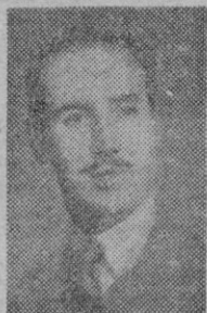
V. DE VILLACIAN

"que no puede esclavo ser pueblo que sabe morir".