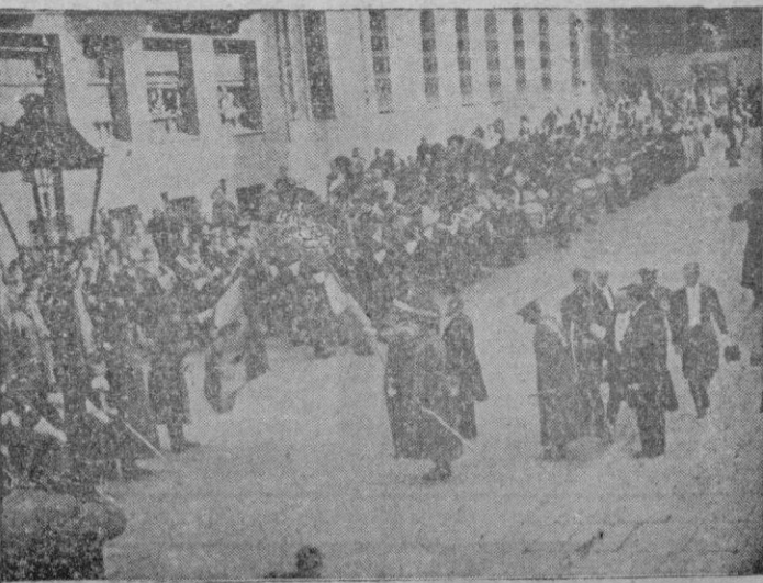
Madrid. — El Embajador del Perú, don Raul Porras, acompaña a la bandera militar de su país que entregó al Museo del Ejército ante la presencia de los Ministros del Ejército, Asuntos Exteriores y otras personalidades.

ENTREGA DE UNA BANDERA PERUANA AL MUSEO DEL EJERCITO