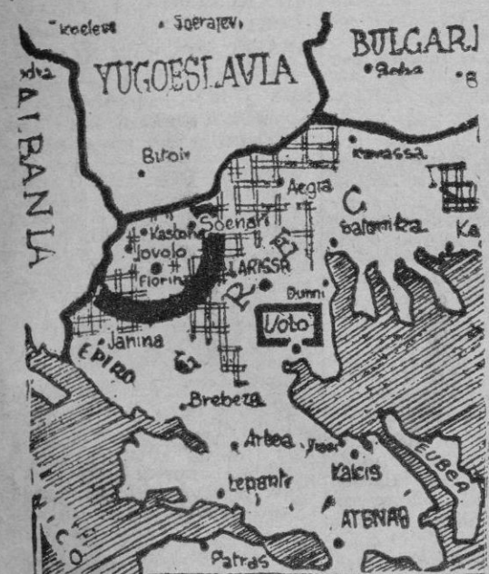
En Florina — localidad dentro del semicírculo de línea gruesa — los comunistas griegos han sufrido uno de sus mayores descalabros

Las armas, entregándose mansamente a la generosidad del rey Pablo. Por el contrario, Markos continuará la lucha, bajo el emblema de un «nacionalismo» en todo semejante al de su compinche y aliado. La ayuda que antes recibía a través de Albania, Bulgaria y Yugoslavia, vendrá ahora únicamente de esta última, mientras convenga al juego de Tito. Sea como fuere, la posición del Gobierno de Atenas quedará reforzada con la escisión que acaba de producirse en el campo rebelde. No es lo mismo combatir a las fuerzas unificadas por Rusia, que hacer frente a dos enemigos sin coordinación entre sí. Y como, por otra parte, se afirma que dentro de breves días el «mariscal» Tito celebrará una conferencia amistosa con representantes de las naciones occidentales, en una isla del Adriático, muy bien pudiera suceder que durante las conversaciones surgiera la posibilidad del acuerdo teórico entre Markos y Sofulís. Cosas más extraordinarias hemos visto a lo largo de estos últimos tiempos.