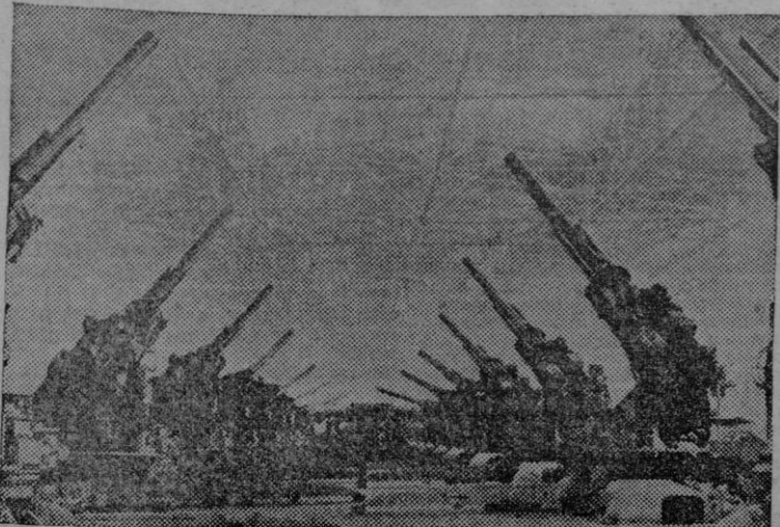
Dispuestos para su embarque, estos cañones antiaéreos de 47 pulgadas, esperan en el sector de montaje final de una fábrica de los Estados Unidos

Los pueblos exigen de nosotros mucho más; donde haya una inquietud que satisfacer, allí tiene que estar sirviendo la Falange.