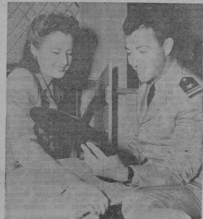
El Teniente Robert Taylor en una breve licencia que disfrutó antes de la invasión de Europa