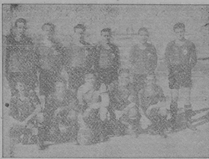
El Soledad, conjunto del grupo de los modestos, aunque de I División regional, que en esta temporada está dando mucha pelea y que va situado en primer lugar de la Liga Regional