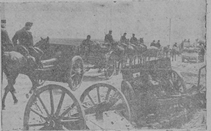
En duros combates en la zona pre-carpática los bolcheviques fueron rechazados por tropas húngaras y alemanas. Aquí vemos a un regimiento de artillería ligera húngara hacia nuevas posiciones, siguiendo al enemigo en retirada.