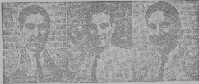
Los tres Bienvenida, que consiguieron un clamoroso éxito en Madrid

El público invadió el ruedo y les acompañó a su casa