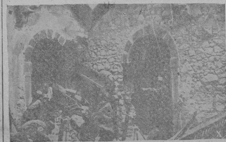
Soldados alemanes se disponen a abandonar las ruinas del Monasterio de Monte Cassino, duramente atacado por los aliados.